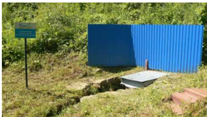
Расположен в 1 км севернее села Радовка.

Адамовский сельский совет Переволоцкого района