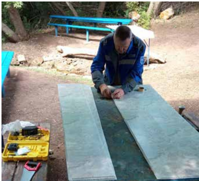
Расположен блиц хутора Южного.

(Садовый сельский совет Переволоцкого района)