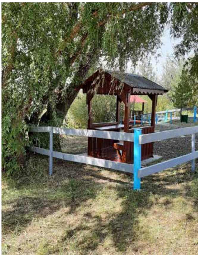
Расположен вблизи поселка Экспериментального.

(Экспериментальный сельский совет Оренбургского района)