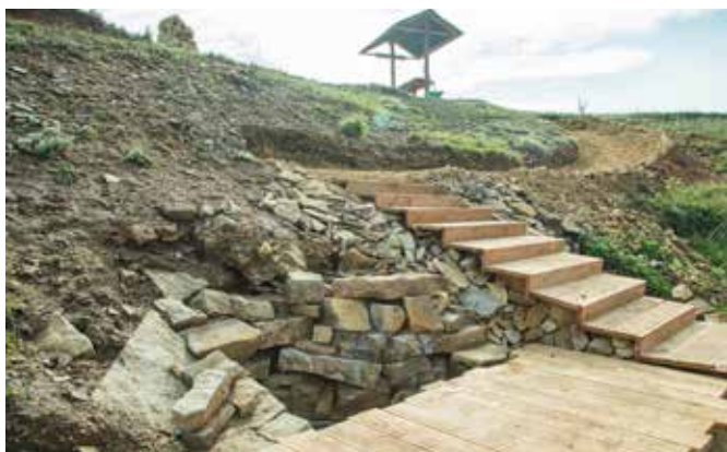
Расположен вблизи села Марьевка.

(Марьевский сельский совет Октябрьского района)