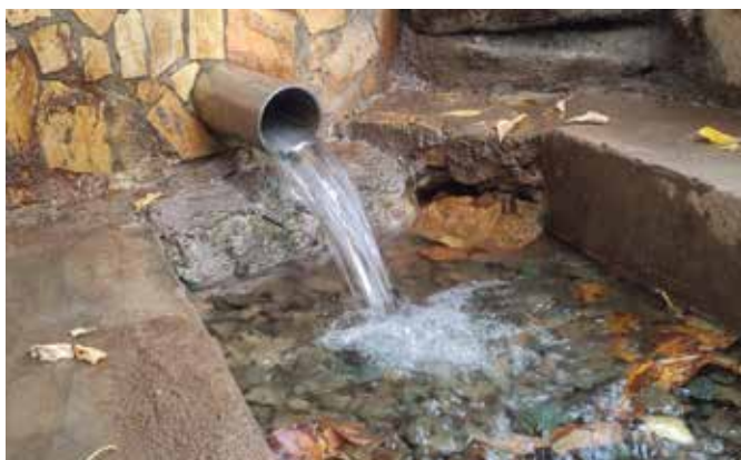
Расположен на окраине села Япрынцево.