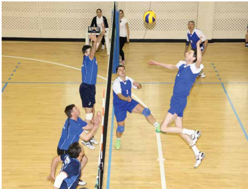
Команды ООО «Газпром добыча Оренбург» стали сильнейшими в двух возрастных категориях