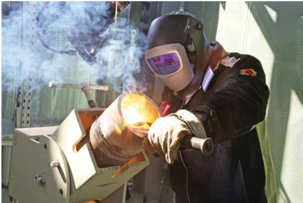
Главное при сварке — не допустить брака и уложиться в отведенное время

Когда образцы были сварены, наступил черед дефектоскопистов. Они приступили к визуально-измерительному, ультразвуковому и радиографическому контролю сварных соединений.