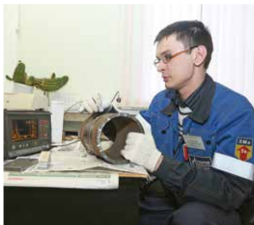
Ультразвук помогает «увидеть» недочеты в сварке