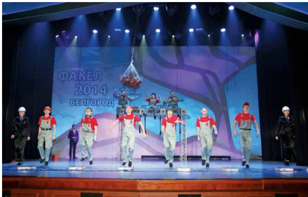
Группа «Степ-данс»: «Строим всё!»