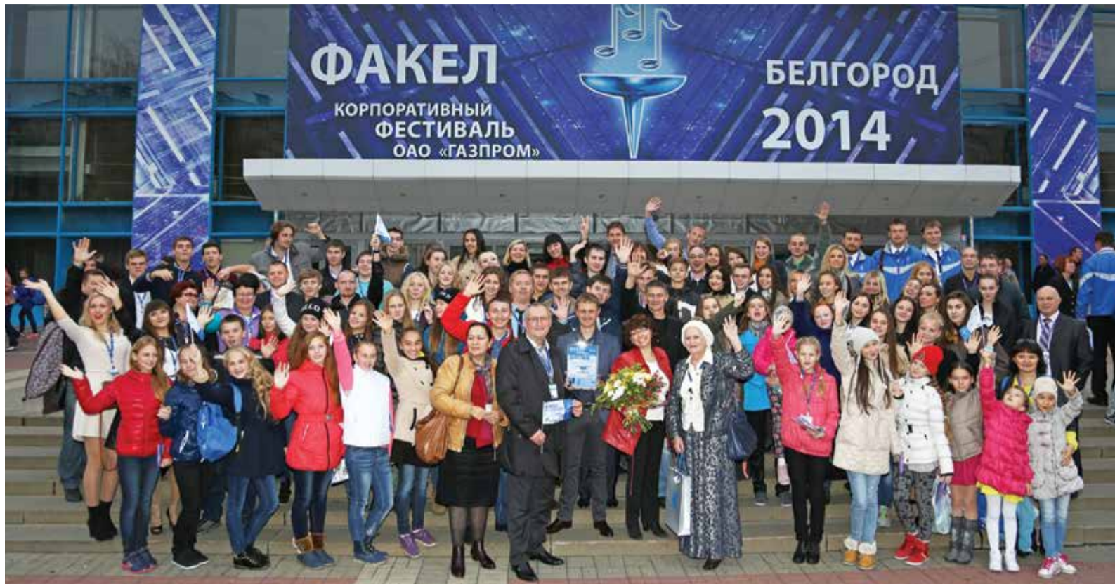
Творческая сила ООО «Газпром добыча Оренбург»

Важно, чтобы все, кто ступил на эту землю в дни фестиваля, знали историю и помнили, какое сражение стало переломным