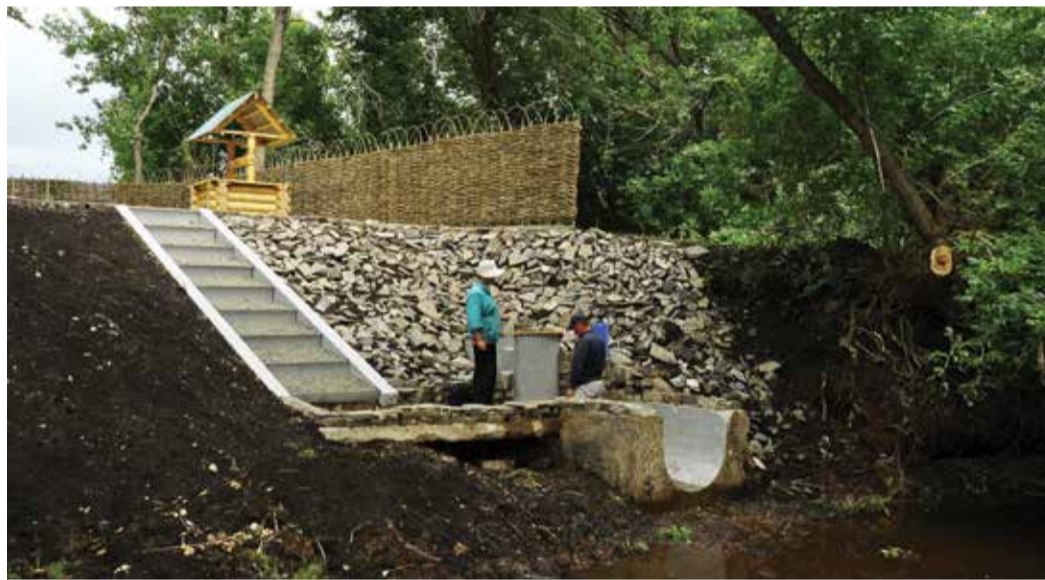
Один из родников, обустроенных УЭСП

Алексей ГАВРИЛОВ ■