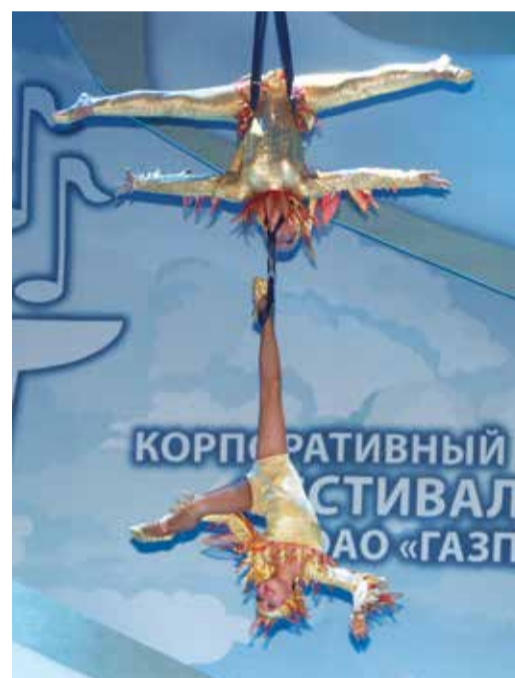
Полеты не во сне, а наяву — воздушные гимнасты эстрадно-циркового театра «Иллюзион»

Благотворительный концерт как солнышко озарил лучами добра и надежды первый дождливый день фестиваля.