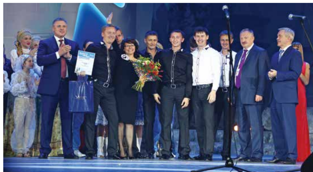
Ослепительный миг ВИА «Экспромт»