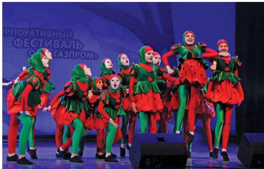
Народный хореографический коллектив «Маленькая страна» на пути к большим творческим успехам

Станислав Попов, заслуженный деятель искусств Российской Федерации, президент Российского танцевального союза, вице-президент Всемирной федерации спортивных танцев: — Хочу Оренбург поздравить! У вас много номинаций и много побед. Здорово выступили. В бальной хореографии — очень хороший номер. Повезло, что Иван и Настя пришли на мастер-класс накануне выступления, и нам удалось расставить смысловые акценты. Танцорам важно показать номер, который соответствует всем законам драматургии — есть завязка, перипетии, кульминация. У ребят все получилось! Успехов!