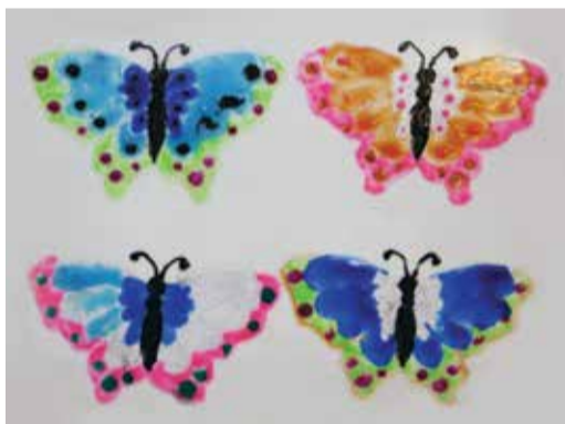
«Бабочки». Валерия ЗЕНИНА, 7 лет