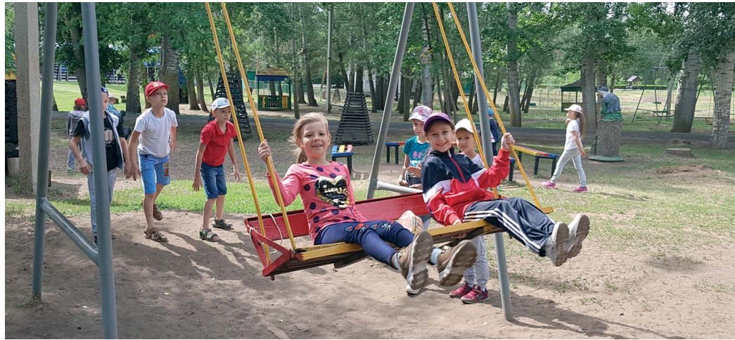
Отдых в «Самородово» открывает

В загородном лагере «Самородово» выявляют самых активных и позитивных. Вторая смена, стартовавшая 21 июня, называется «Быть первым — быть лучшим».