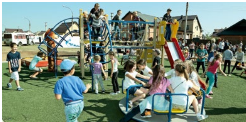
Самая востребованная площадка 2018 года

В поселке Газодобытчиков Оренбургского района появилась новая детская игровая площадка, построенная по программе «Газпром — детям».