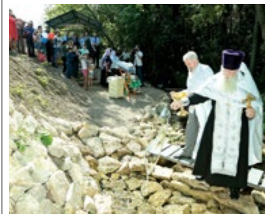
Теперь вода в роднике святая