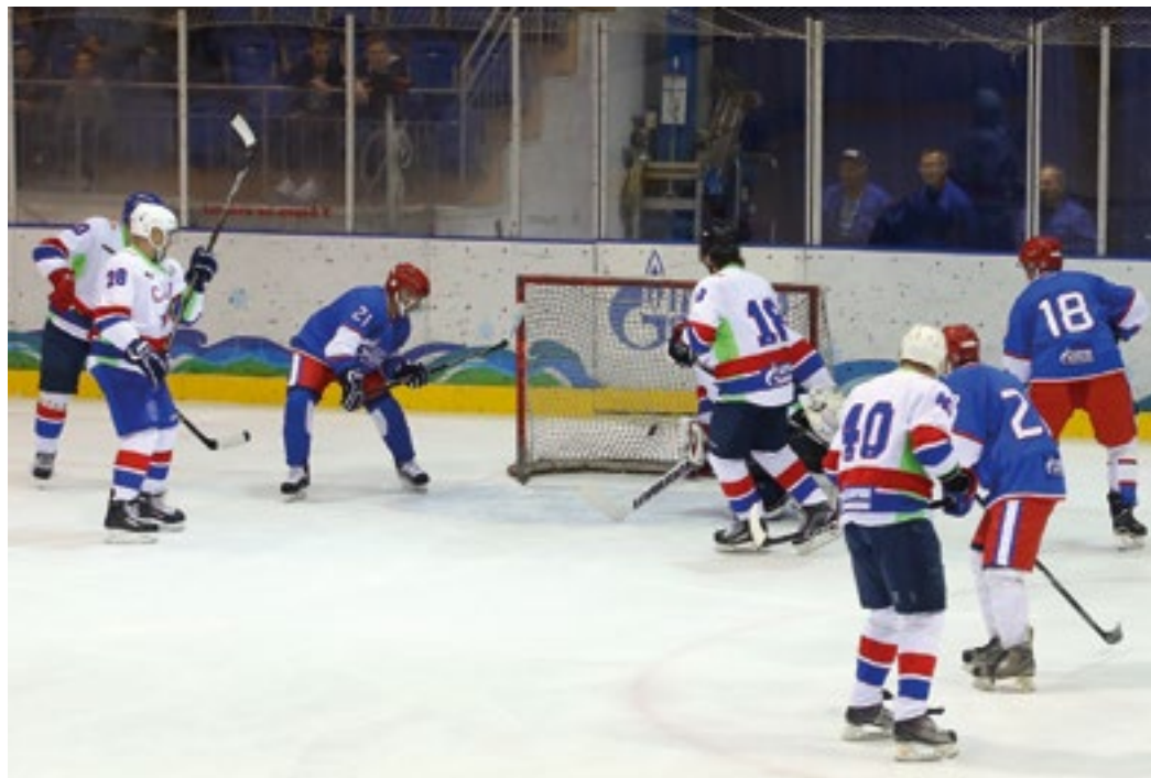
Шайба влетела в ворота команды СКА Санкт-Петербурга

1 сентября в Оренбург прибыли звезды российского хоккея, ветераны СКА Санкт-Петербурга, чтобы принять участие в товарищеском матче со сборной ООО «Газпром добыча Оренбург» и встретиться с юными спортсменами.