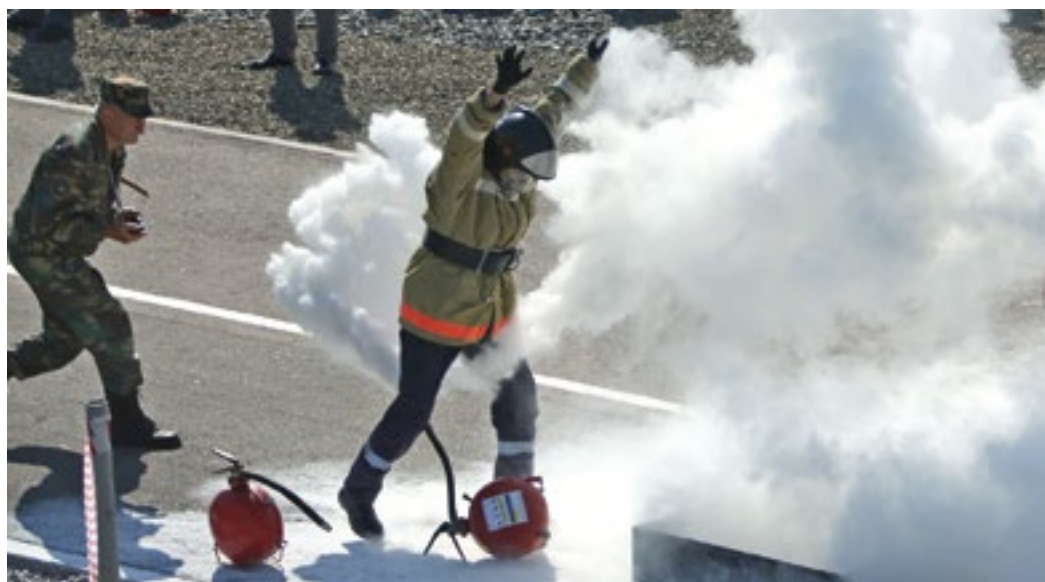
Дым без огня. Горящая жидкость потушена за секунды

В ООО «Газпром добыча Оренбург» определили лучших представителей добровольных пожарных формирований. Соревновались десять команд структурных подразделений.