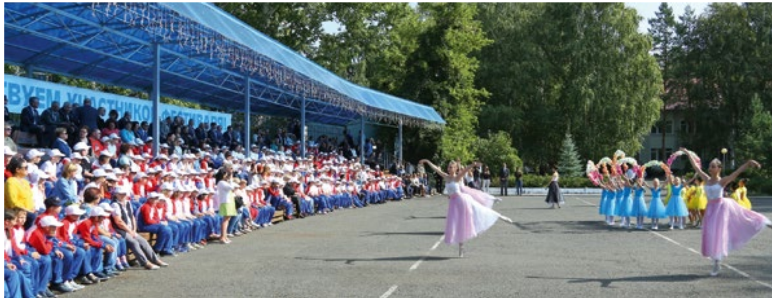
Открытие — одно из самых ярких событий фестиваля

«САМОРОДОВО» ВСТРЕТИЛО ПОЧТИ 300 УЧАСТНИКОВ XIII ФЕСТИВАЛЯ «ТЕПЛО ДЕТСКИХ СЕРДЕЦ» СОЛНЦЕМ