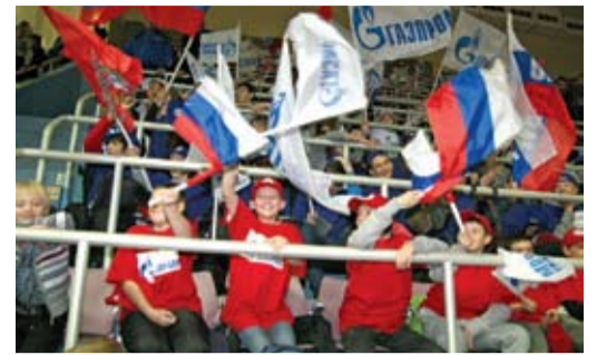
Вперед, Россия! Вперед, «Газпром»!