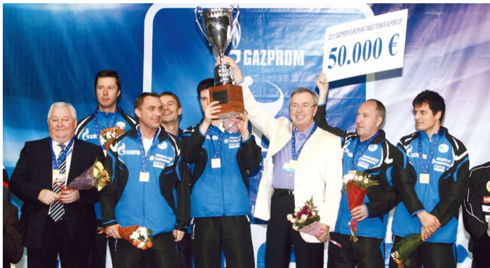
Сильнейший клуб мира

«ФАКЕЛ ГАЗПРОМА» ЗАВОЕВАЛ СУПЕРКУБОК ЕВРОПЫ В ТУРНИРЕ ЧЕТЫРЕХ СИЛЬНЕЙШИХ КОМАНД МИРА