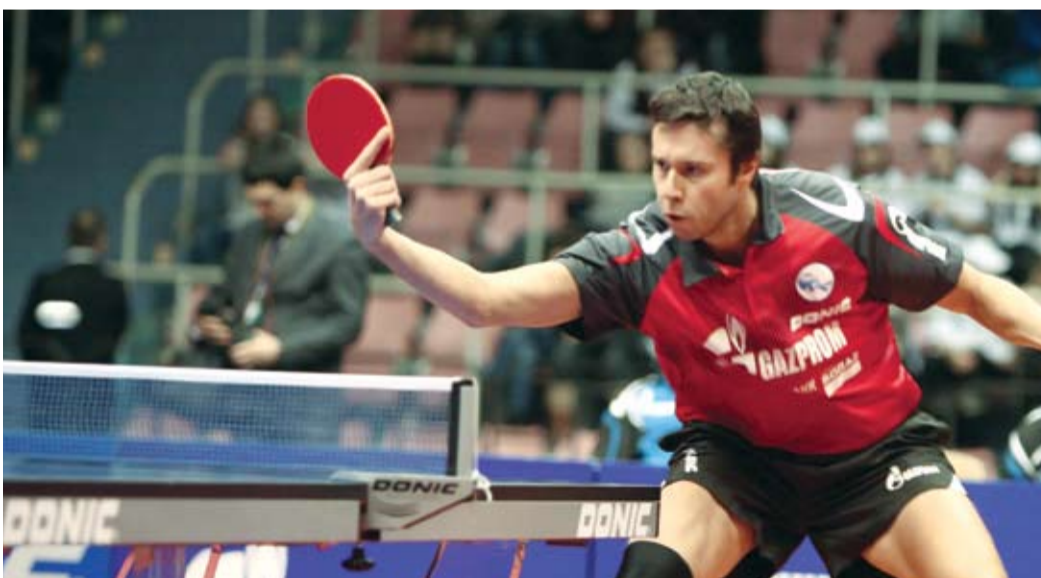
Владимир Самсонов: «Поддержка болельщиков для нас очень важна»