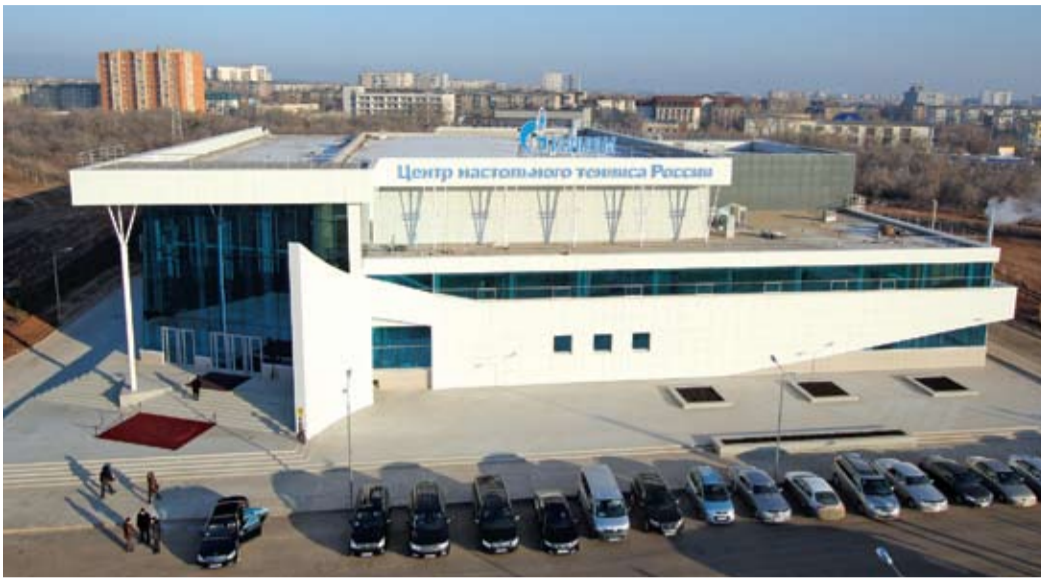
В Оренбурге созданы все условия для подготовки олимпийских чемпионов

«В Оренбуржье к настольному теннису особое отношение. Он является базовым видом спорта в нашем регионе, — отметил губернатор — председатель Правительства Оренбургской области Юрий Берг. — Этот комплекс — замечательный подарок, за который я искренне благодарен газавикам».