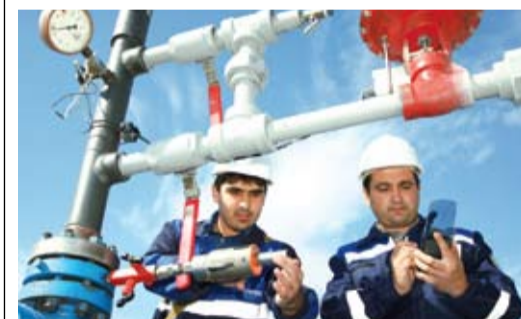
Борьба с обводнением скважины идет успешно