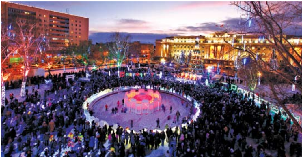
Центральная елка – главное новогоднее украшение города

28 декабря при поддержке предприятий некоммерческого партнерства «Газпром в Оренбуржье» в сквере у Дома Советов состоится открытие центральной городской елки.