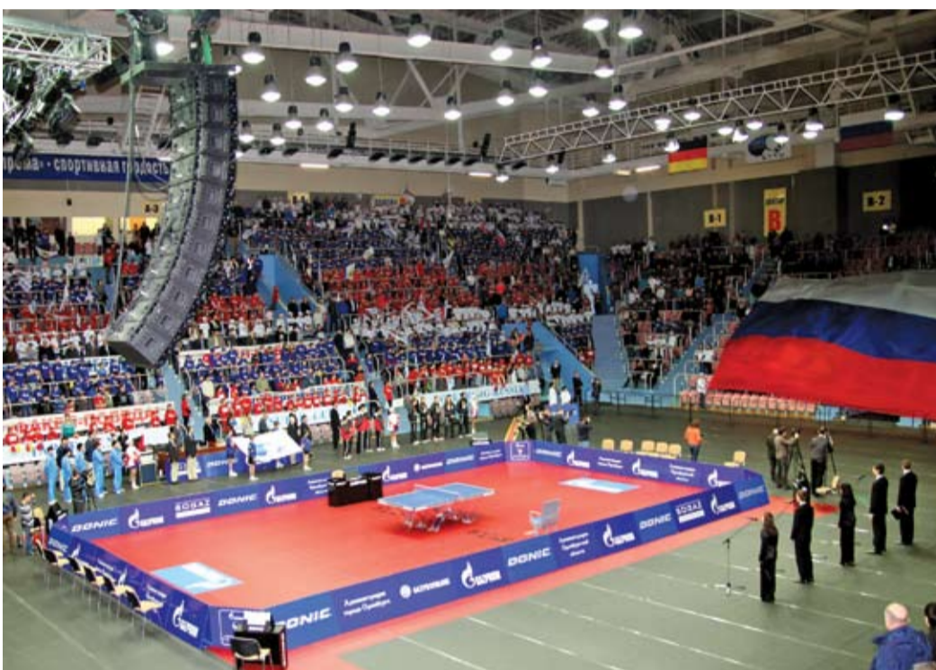
Спортивные победы во имя России