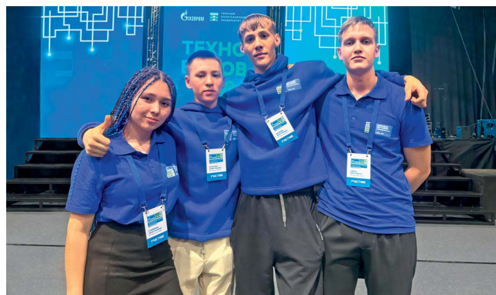
Ученики «Газпром-класса» Черноотрожской СОШ на «Техно-вызове — 2030», одном из масштабных мероприятий, которое посетили участники слета

Отдельный день был выделен под спортивные испытания. Школьники соревновались в стрельбе из лазерной винтовки, дартсе, подтягивании, бадминтоне, настольном теннисе, эстафете, кибергон-