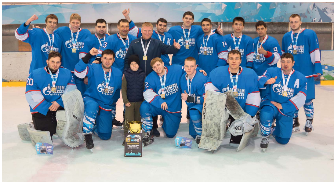
Оренбургские газодобытчики с золотыми медалями и кубком победителя

Наталья НИКОЛАЕВА