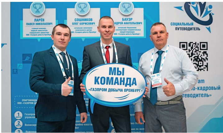
Делегаты конференции по выполнению Коллективного договора

«Мазутная конституция» — первый коллективный договор в истории рабочего движения в России. Подписан Советом съезда нефтепромышленников в Баку 19 (30) декабря 1904 года на основании постановления общего собрания нефтепромышленников, керосинозаводчиков и фирм, занимающихся подрядным бурением. Финансовые уступки нефтепромышленников по коллективному договору, завоеванные рабочими, составляли 150 тысяч рублей в месяц, или около 2 миллионов рублей в год. Генеральный коллективный договор ПАО «Газпром» можно назвать «Газовой конституцией». В 2000 году между работниками и руководителями «Газпрома», его дочерних обществ и организаций было заключено Тарифное соглашение, которое стало предшественником Генерального коллективного договора Компании.