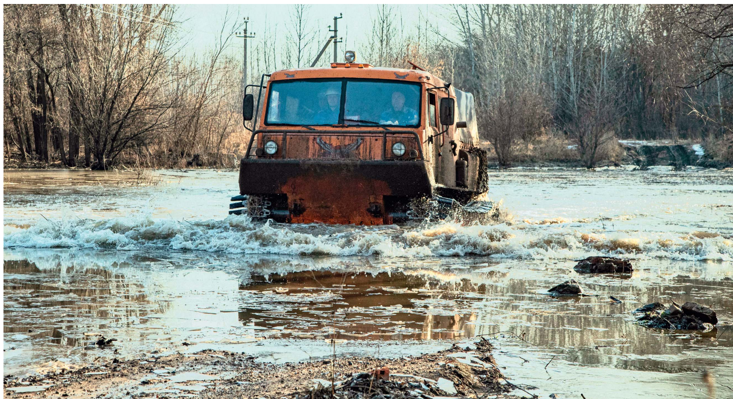
До труднодоступных производственных объектов газодобытчики добираются на специальной технике

Уровень основных водных артерий в центральной части региона расти перестал. А совсем недавно на Урале, Сакмаре, Салмыше он поднимался за сутки на пару сантиметров, несколько дециметров и даже метров. Ни одна из указанных рек из берегов не вышла. Но все равно до части производственных объектов газодобытчики могут добраться только на высокопроходимой технике: низины и овраги заполнили тальные воды.