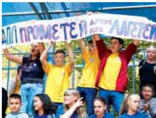
Подхватившие огонь «Прометей»

Сегодня, когда спортивная общественность следит за чемпионатом мира по футболу, который проходит в России, в палаточном лагере «Прометей» ставят свои рекорды и зажигают свои звезды.