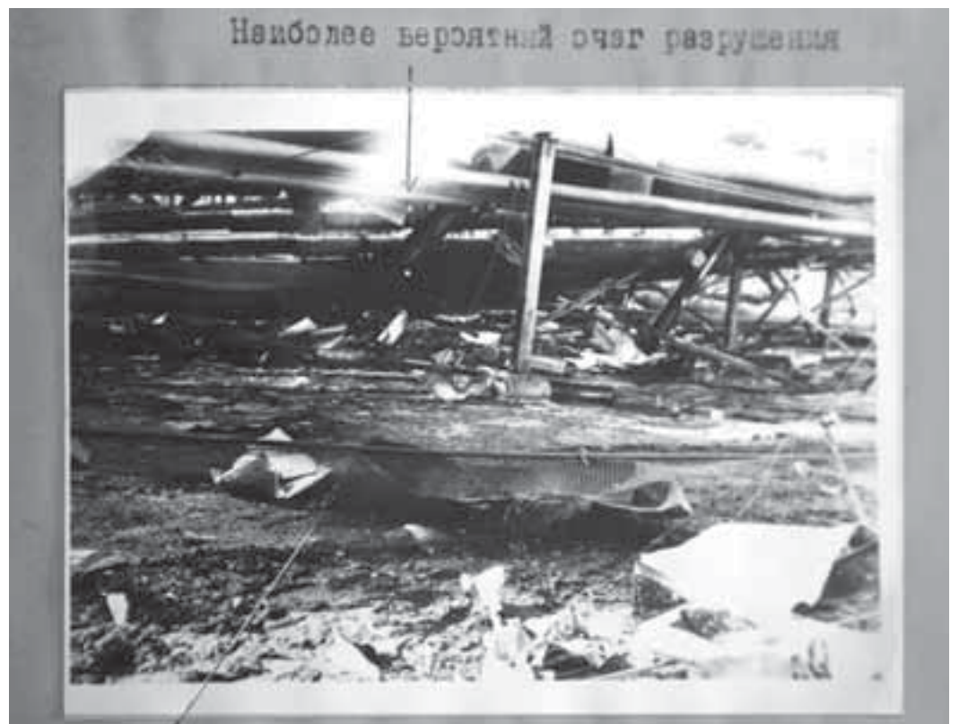
Фото из материалов расследования аварии на газоперерабатывающем заводе. 1987 год