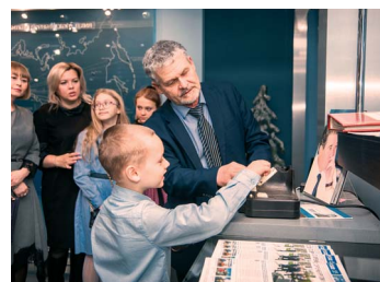
ВЕКТОРЫ ЖИЗНИ стр. 10