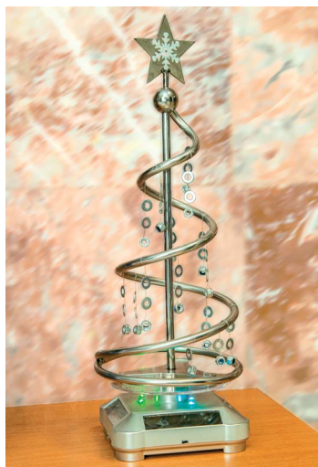
«Сколько вешать в граммах?»

«Взрослые иногда нуждаются в сказке даже больше, чем дети» — под таким девизом в инженерно-техническом центре (ИТЦ) состоялось творческое мероприятие, организованное первичной профсоюзной организацией и советом молодых ученых и специалистов структурного подразделения.