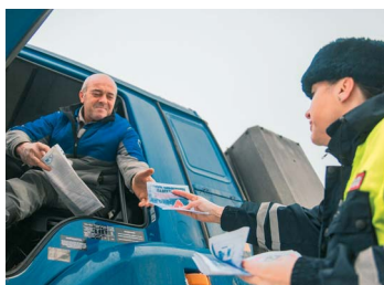
СКОРОСТЬ — НЕ ГЛАВНОЕ стр. 6