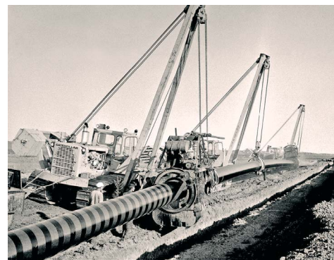
Строительство этанопровода Оренбург — Казань