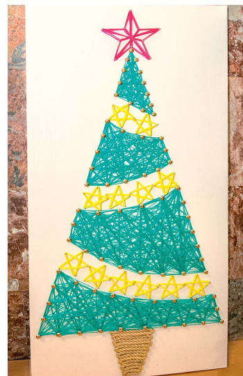
Полет фантазии при подготовке к празднику безграничен

дает эффект в любом деле, будь то праздничная художественная или серьезная инженерная задача.