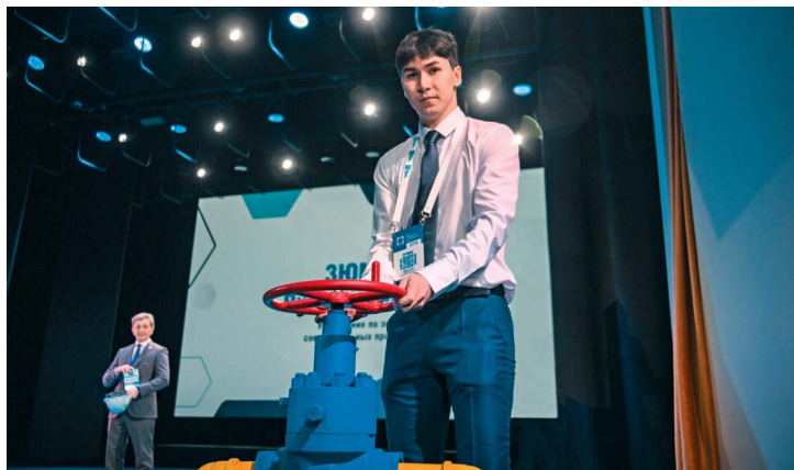
Поворот задвижки — как символ вступления в семью газодобытчиков

Свыше 200 тысяч рублей удалось выручить в рамках благотворительной ярмарки «Дорога добра — Простые истины» в 2024 году. Эти средства были переданы центру «Солнечный круг», который помогает развитию, общению, адаптации и социализации детей с ограниченными возможностями здоровья.