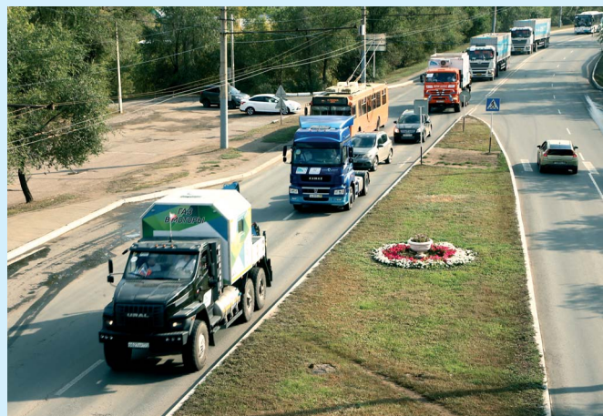
Участники автопробега «Газ в моторы» едут по Оренбургу. 2018 год

Наталья НИКОЛАЕВА