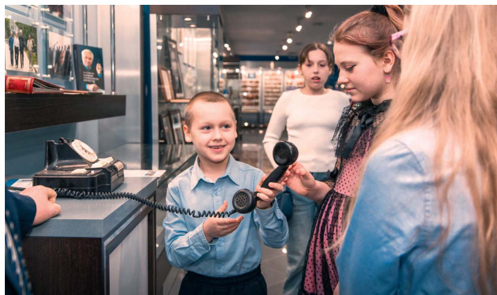
После церемонии награждения победители отправились на экскурсию по музею истории и трудовой славы предприятия

тели из числа работников состоят в профсоюзе. Их дети со временем тоже могут присоединиться к нашей дружной профсоюзной семье. 22 декабря профсоюзные активисты Оренбургской области празднуют свой профессиональный день. Приглашенных на церемонию награждения я поздравляю с победой в творческом состязании и с нашим общим праздником, — подчеркнул председатель ОППО «Газпром добыча