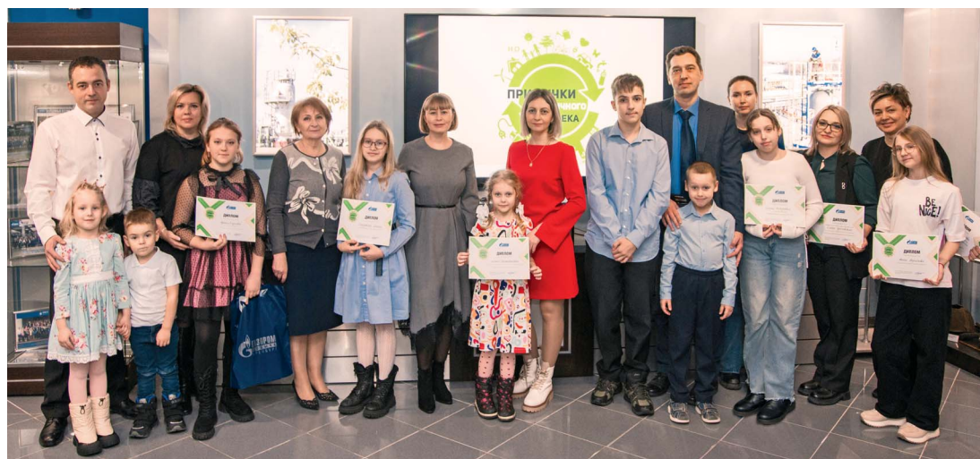
Победители конкурса «Привычки экологичного человека»

Подробнее о конкурсах мы рассказали здесь.