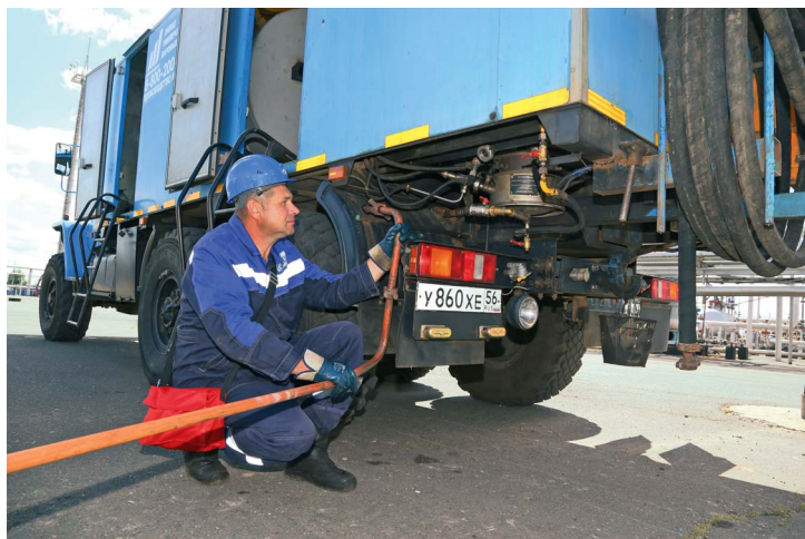
Точка подключения паровой передвижной установки к трубопроводу очищенного газа на одном из промыслов. 2016 год

2024 год. В рамках международного форума «Газ. Нефть. Оренбуржье» была организована выставка техники. ООО «Газпром добыча Оренбург» представило на ней пять машин в газовом исполнении. Еще шесть единиц техники различного назначения приняли участие в автопробега «По Оренбуржью на метане».