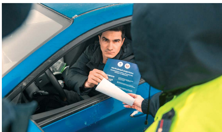
Сотрудники ГАИ вручают памятки водителям

ходимости соблюдать дистанцию и скоростной режим, пристегиваться ремнями безопасности, не отвлекаться на мобильный телефон во время движения и неукоснительно соблюдать правила дорожного движения. Каждому водителю вручали памятку с советами по безопасному вождению на снежной трассе.