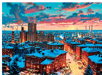
ГАЛЕРЕЯ ЧУДЕС стр. 9