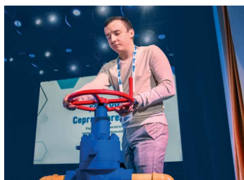
НОВЫЕ ЛИЦА стр. 4