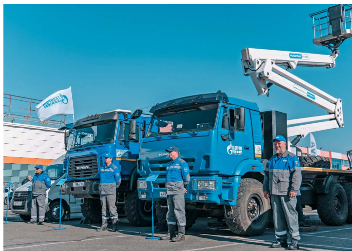
Газомоторная техника Общества на международном форуме «Газ. Нефть. Оренбуржье». 2024 год

ООО «Газпром добыча Оренбург» занимает активную общественную позицию в плане