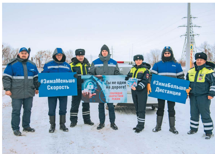
Профилактика — важный элемент снижения аварий на дорогах