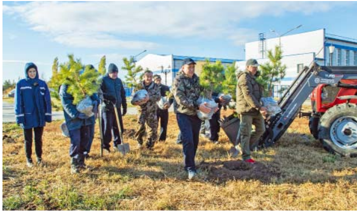
В посадке сосен участвуют жители села им. 9 Января Оренбургского района