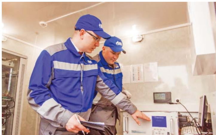
Рабочие будни сотрудников лаборатории

Лаборатория производственного экологического контроля центра газовой и экологической безопасности военизированной части Общества получила заключение «О состоянии измерений».