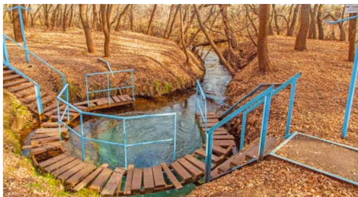
Родник Голубой Глаз пользуется популярностью у туристов

Наталья АНИСИМОВА