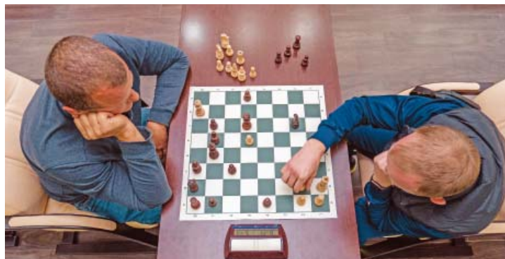
Для победы в шахматах нужно продумывать шаги наперед

Работники Общества на спартакиаде соревновались в шахматах.