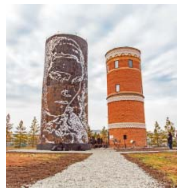
Новая локация в Черном Отроге