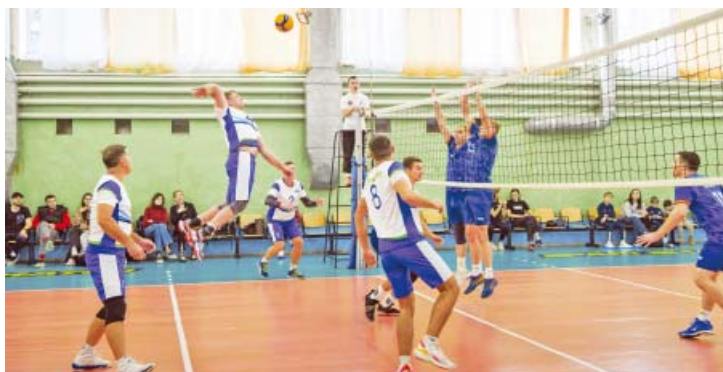
Газодобытчики атакуют в матче против команды «Газпромнефть-Оренбург»

Оренбургские газодобытчики выступили на традиционном городском турнире четырех сильнейших женских и мужских команд по волейболу.