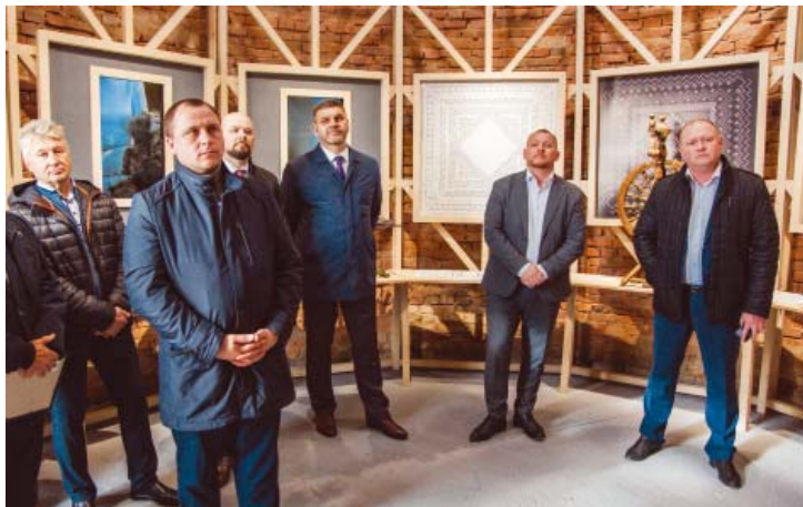
Представители Общества «Газпром добыча Оренбург» и гости праздника на первой экскурсии

Культурное пространство музея Черномырдина в Черном Отроге Саракташского района расширилось.