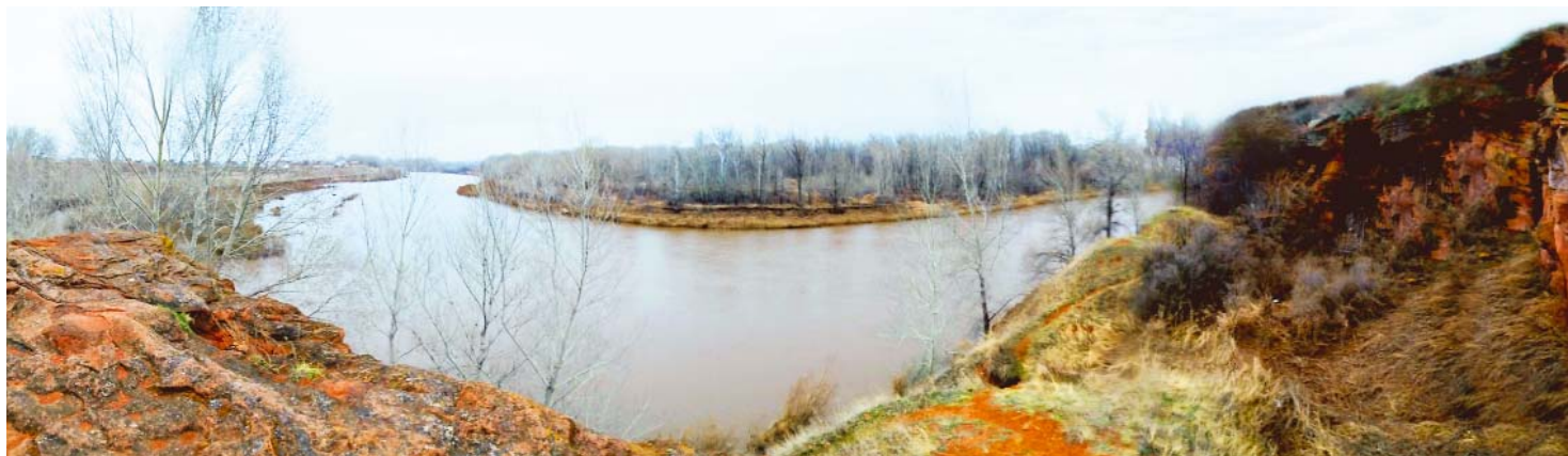
Урочище Муратауз — памятник природы областного значения

Осень, пока не зарядили дожди, — отличное время для поездок. Это пора, как подметил Александр Пушкин, когда «в багрец и в золото одетые леса, в их сенях ветра шум и свежее дыхание». Но в Оренбуржье вовсе не «унылая».