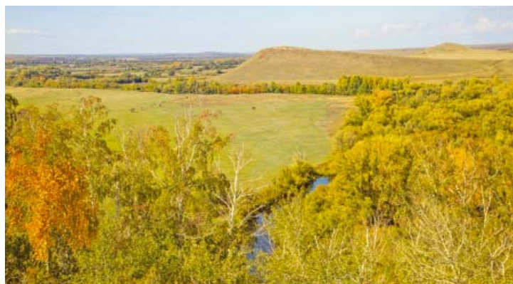
Гору Каменную видно издалека