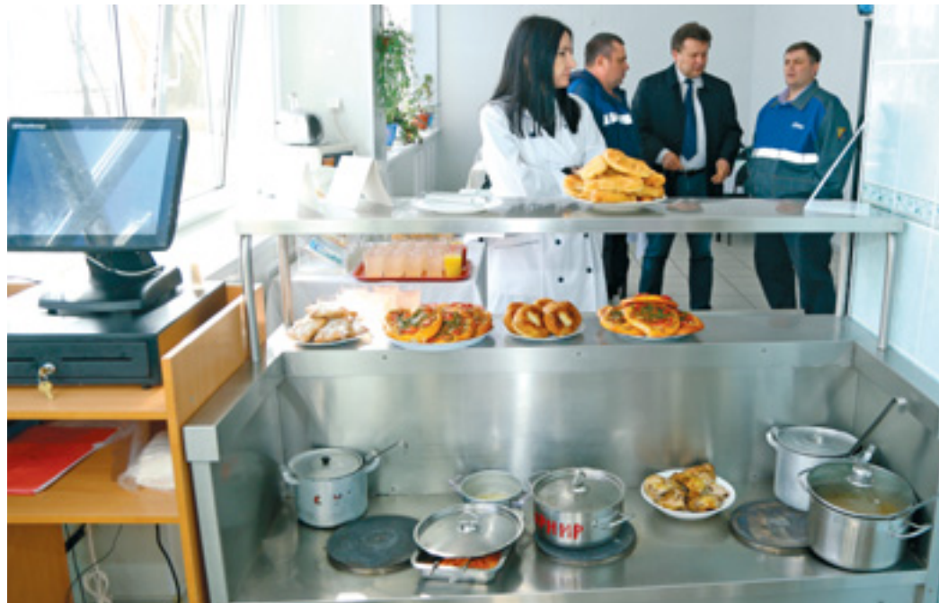
По правилам половники и ложки не должны находиться в готовых блюдах