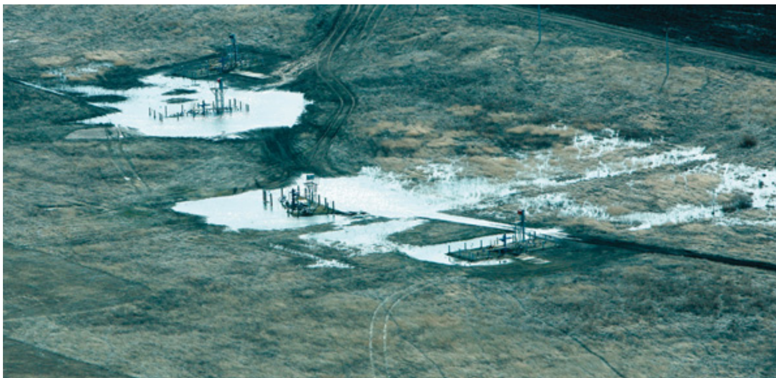
В зоне подтопления находится около ста скважин УКПГ № 14 и № 15, расположенных в пойме реки Урал

Весна, отсчитав добрую половину отмеренных ей календарных дней, наконец-то вступила в свои права: заметно потеплело, растаял снег, вскрылись реки. Со стометровой высоты, которую набрал вертолет Ми-8, открывается захватывающая дух панорама: природа пробуждается от зимнего сна.