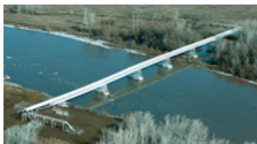
Воздушные переходы трубопроводов контролируют работники УЭСП