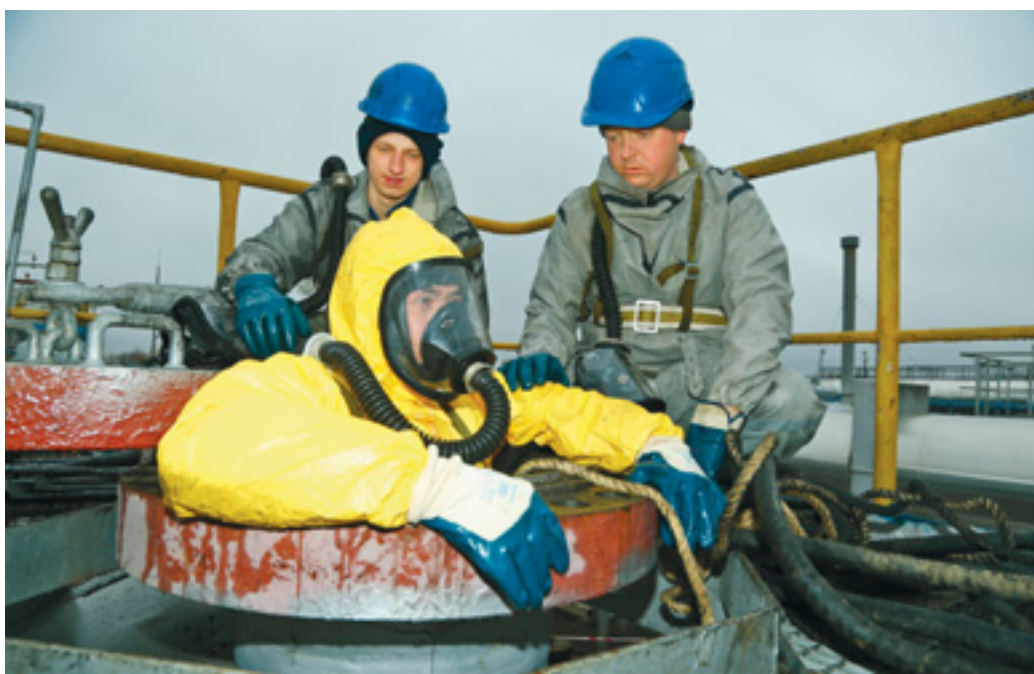
Выполняется проверка качества нанесения антикоррозионного покрытия на внутренней части сепаратора

С помощью твердомера измеряют другое важное свойство металла — твердость. Специалисты пояснили: чем выше этот параметр, тем больше металл подвержен растрескиванию. «Входной контроль включает применение оборудования и материалов, не соответствующих требованиям