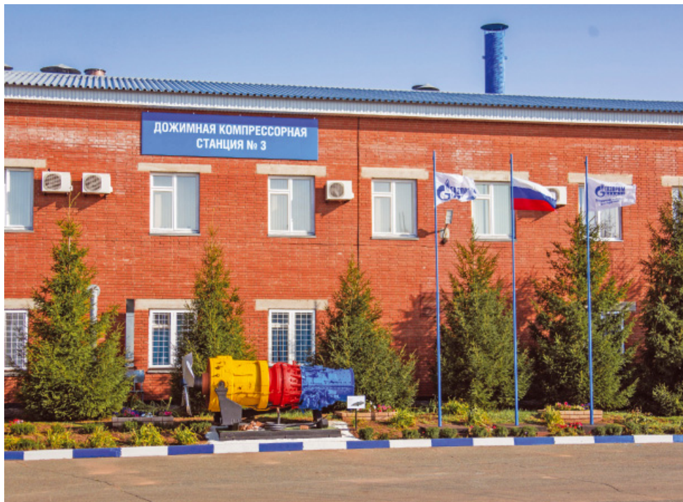
Дожимная компрессорная станция № 3 газопромыслового управления

На объектах Общества «Газпром добыча Оренбург» проводится серьезная работа, чтобы территория деловой и производственной деятельности была пространством, где важно все: от технологического процесса до состояния шкафчика для одежды, где люди, следуя внутренней потребности, соблюдают требования безопасности, поддерживают порядок на своих местах, разделяют корпоративные ценности компании и духовно-нравственные — нашей страны.