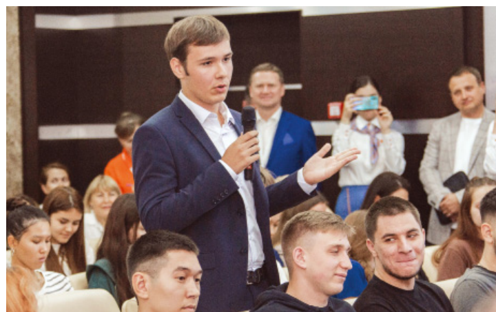
Молодые люди задали интересные вопросы и получили развернутые ответы

Он поделился с коллегами опытом создания «Газпром-классов» в школах и «Газпром-групп» в высших и средних специальных учебных заведениях, реализации программы «Формула успеха», благодаря которой талантливые и активные студенты получают право на трудоустройство.