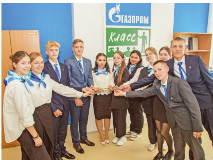
Ученики «Газпром-класса» Черноотрожской школы готовы к обучению

— Открытие каждого «Газпром-класса» для нас — знаковое событие, особенно в школе, носящей имя Виктора Степановича Черномырдина. Впереди вас