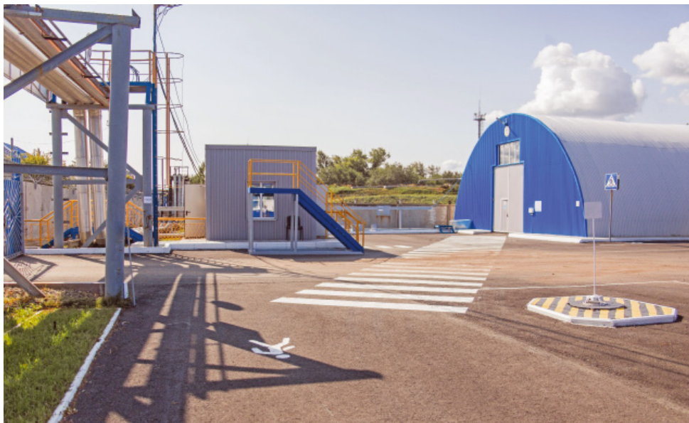
Участок аварийно-восстановительных работ на объектах добычи газа, газового конденсата и нефти управления аварийно-восстановительных работ

В первой группе оценивались газопромысловое управление (ГПУ), управление по эксплуатации соединительных продуктопроводов (УЭСП), управление технологического транспорта и специальной техники (УТТиСТ) и управление материально-технического снабжения и комплектации (УМТСиК), во второй — управление аварийно-восстановительных