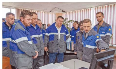
Данные энергонезависимых датчиков транслируются на автоматизированное рабочее место