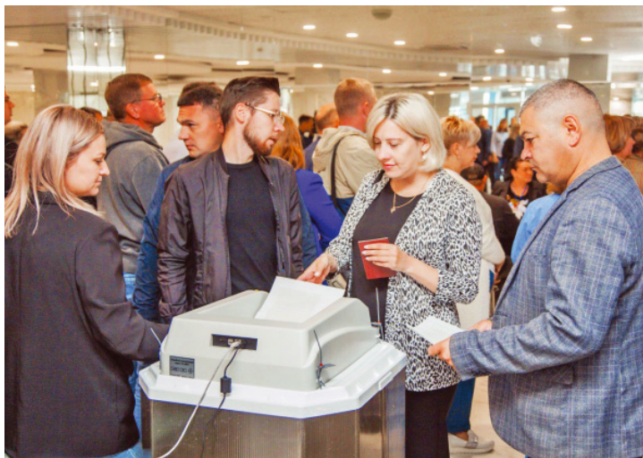
На избирательном участке № 1081 было многолюдно: голосовали работники нашего предприятия и другие жители Оренбурга

— Не только мне, но и всему коллективу «Газпром добыча