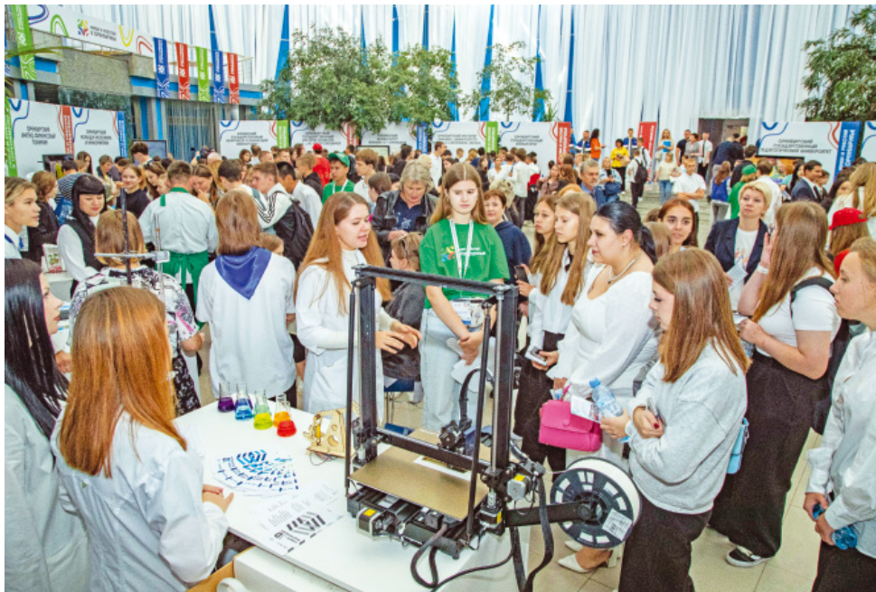
Экспозиция учебных заведений

Заместитель главного инженера ООО «Газпром добыча Оренбург» по автоматизации и метро-