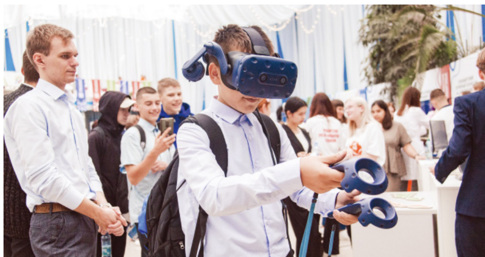
Юные участники форума осваивали современные технологии

В сквере Дворца культуры и спорта «Газовик» участники форума труда познакомились с экспозицией «Этапы большого пути», узнав много интересных фактов об истории оренбургского газа, вкладе газодобытчиков в развитие областного центра и региона в целом. Специалисты службы по связям с общественностью и СМИ ООО «Газпром добыча Оренбург» рассказали, как наш аграрный край получил статус индустриального. Виртуальное экспресс-путешествие «Путь газа» было посвящено специфике