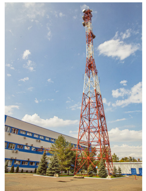
Связисты, как и коллеги из других подразделений, уделяют большое внимание эстетике производства

Ольга КОНСТАНТИНОВА