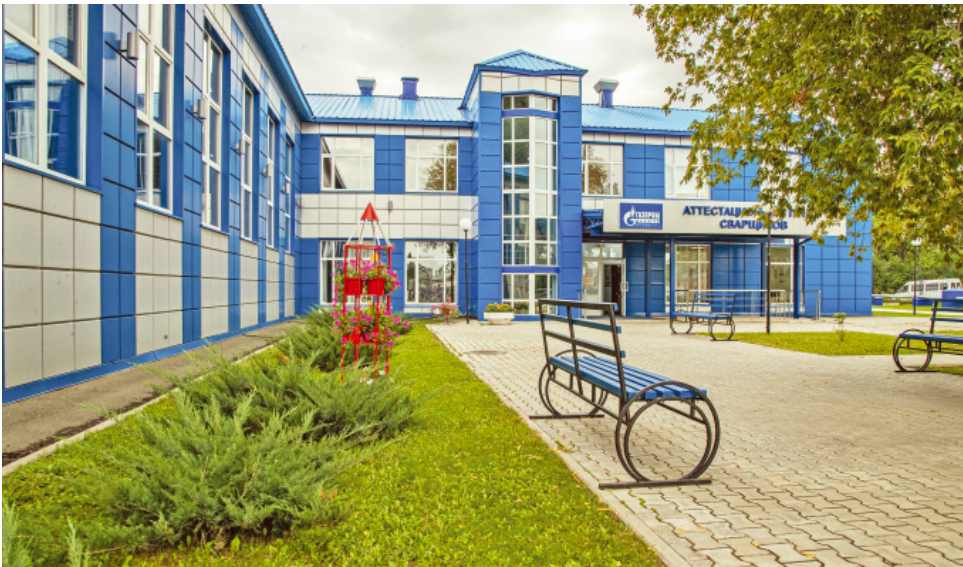
Благоустройством территории аттестационного пункта сварщиков занимаются работники управления по эксплуатации зданий и сооружений