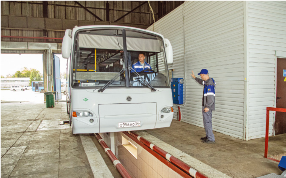
Диагностическая линия технического осмотра в управлении технологического транспорта и специальной техники