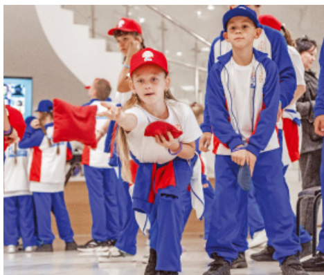
В Оренбурге снова тепло от детских сердец

Делегации поприветствовала вице-губернатор Оренбургской области — заместитель председателя Правительства по социальной политике — министр здравоохранения