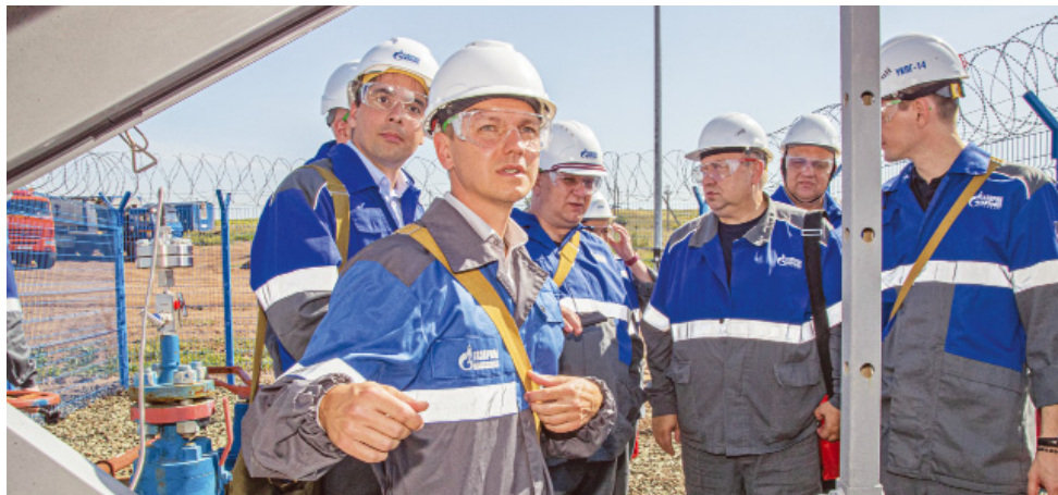
Демонстрация работы системы телеметрии на скважине базового участка

В ООО «Газпром добыча Оренбург» состоялось совещание по реализации инвестиционного проекта «Внедрение беспроводных энергонезависимых датчиков с использованием технологии промышленного интернета вещей с внедрением цифрового двойника Оренбургского нефтегазоконденсатного месторождения». Это инициатива нашего предприятия в рамках Стратегии цифровой трансформации ПАО «Газпром».