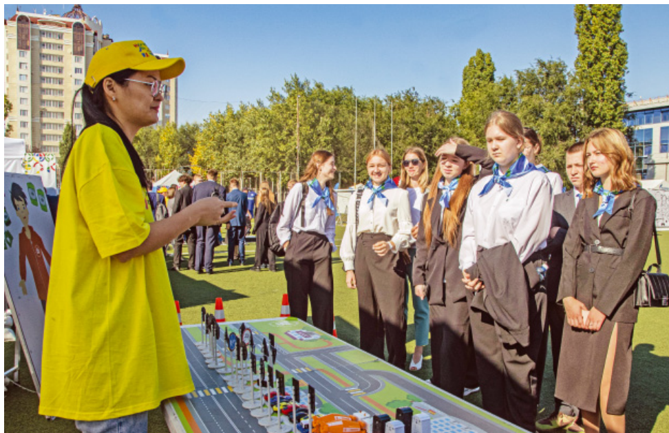
На фестивале безопасности ученики «Газпром-класса» решают задачи по правилам дорожного движения

На стадионе «Факел» проходил фестиваль, посвященный культуре безопасности. Основной аудиторией мероприятия были школьники и студенты. На поле работали десять «островков». Каждый из них был посвящен определенной теме, например, взаимодействию с домашними и дикими животными, безопасности на воде, на дорогах, в быту, во время занятий спортом и в других жизненных ситуациях. Работники ООО «Газпром добыча Оренбург» — внутренние тренеры