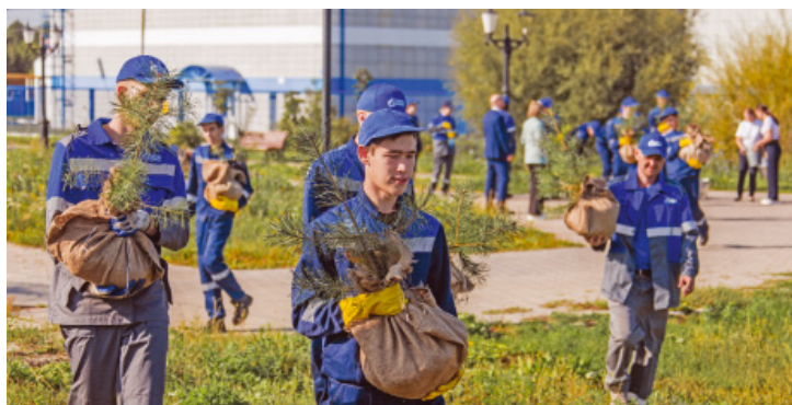
Аллея в селе имени 9 Января получила продолжение

Завершила работу третья смена экоотряда-2024. За три летних месяца в проекте приняли участие 90 оренбургских школьников