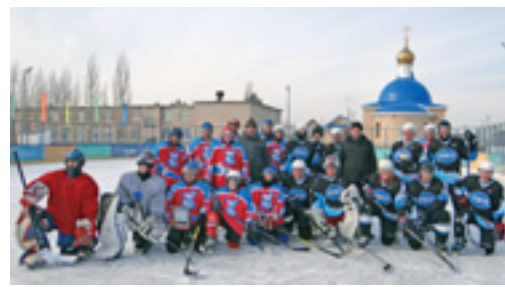
После турнира соперники — одна дружная спортивная команда