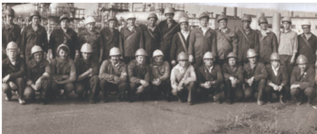
Коллектив УКПГ-10. 1980 год