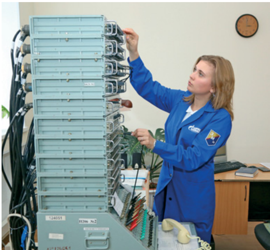
Татьяна строга в работе и приятна, обаятельна в общении