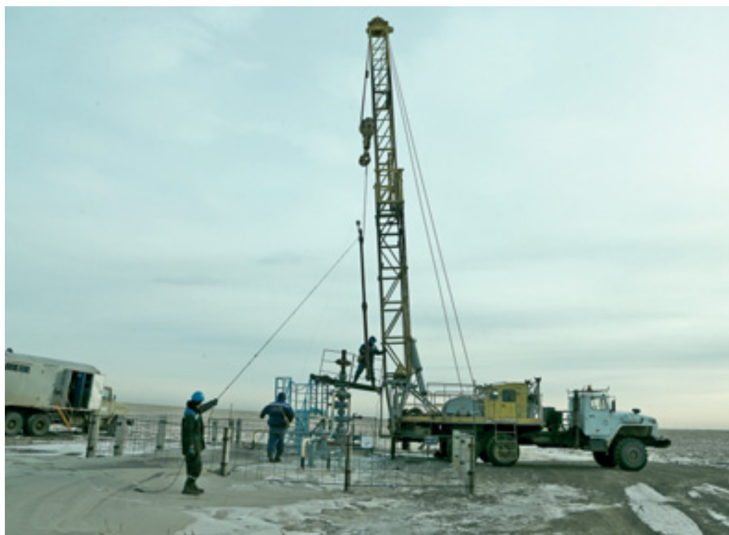
Подрядная организация опускает трубку Вентури в ствол скважины

В ГАЗОПРОМЫСЛОВОМ УПРАВЛЕНИИ ПРОВОДИТСЯ ЭКСПЕРИМЕНТ, КОТОРЫЙ МОЖЕТ УВЕЛИЧИТЬ ДЕБИТ ГАЗОВЫХ СКВАЖИН