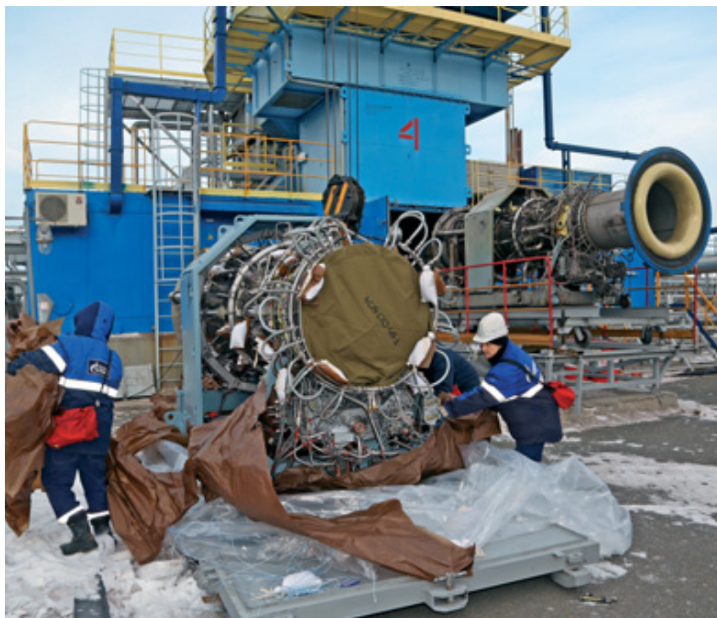
Работники станции подготавливают двигатель к монтажу

Освободившееся место занял двигатель, прошедший капитальный ремонт. Специалисты станции приступили к его «обвязке» и подключению к технологическому оборудованию.