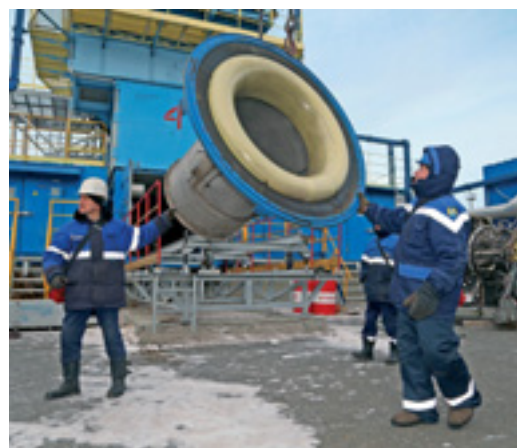
Всасывающий диффузор устанавливают на отремонтированный двигатель

Ветер, мороз и ледяная пыль. Ничто не помешало выполнить замену газотурбинного двигателя газоперекачивающего агрегата на дожимной компрессорной станции (ДКС) № 3 газопромыслового управления.