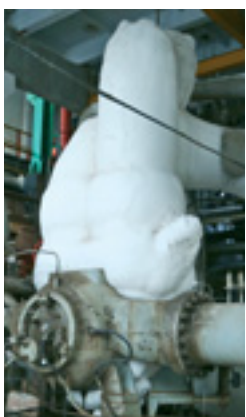
Слева — остановленный турбодетандер, справа — работающий