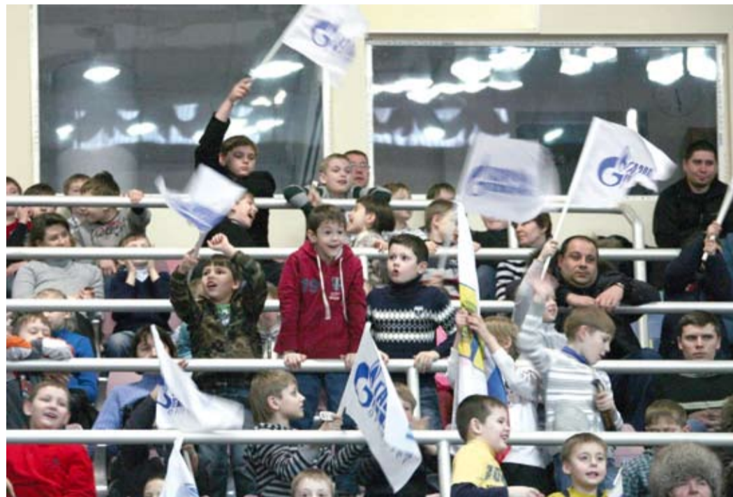
Оренбург болеет за «Факел Газпрома»

событиях 7-летней давности. Тогда в Кубке Европы в Оренбурге «Факел Газпрома» потерпел поражение от нынешнего соперника с похожим счетом 2:3.