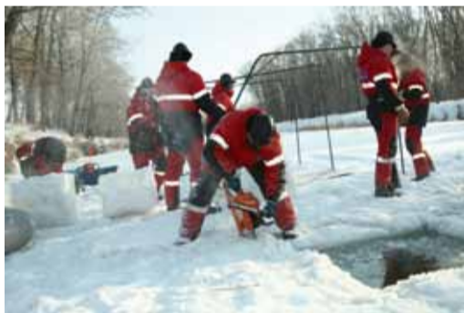
Это прорубь не для купания