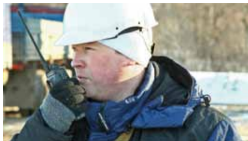
Всегда на связи