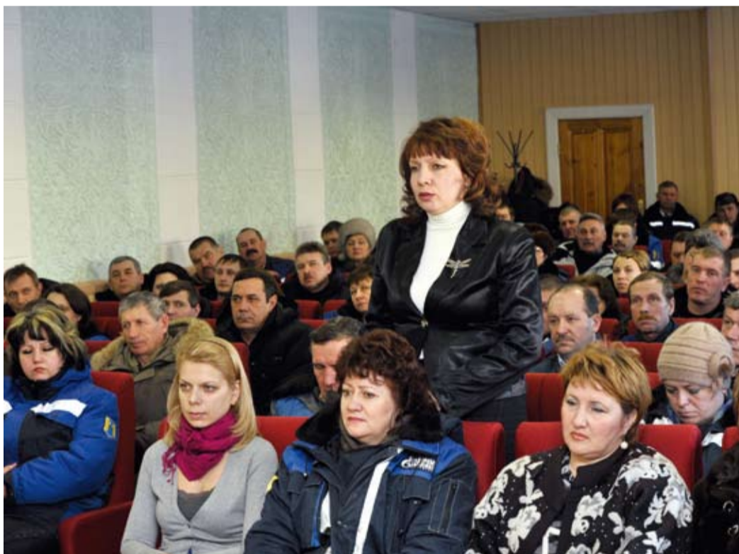
Руководители ООО «Газпром добыча Оренбург» ответили на вопросы коллектива

Кроме того, в ходе встреч трудовые коллективы были проинформированы о подготовке к собранию акционеров ОАО «Газпром», которое состоится 29 июня 2012 года в Москве. В ходе единого дня информации представители рабочих групп ответили на вопросы производственного и социально-бытового характера.