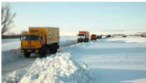
Колонна движется к месту учения

За дело взялись снегоочистители. Площадка, на которой будут устанавливаться боновые заграждения, должна быть чистой. Сразу же после того, как утихли моторы, за дело взялись бензопилы. Другого более эффективного инструмента, чтобы