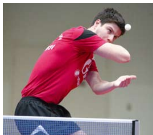
Дмитрий Овчаров приносит первое очко «Факелу»