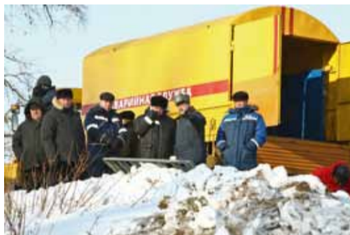
Учения — это отработка навыков