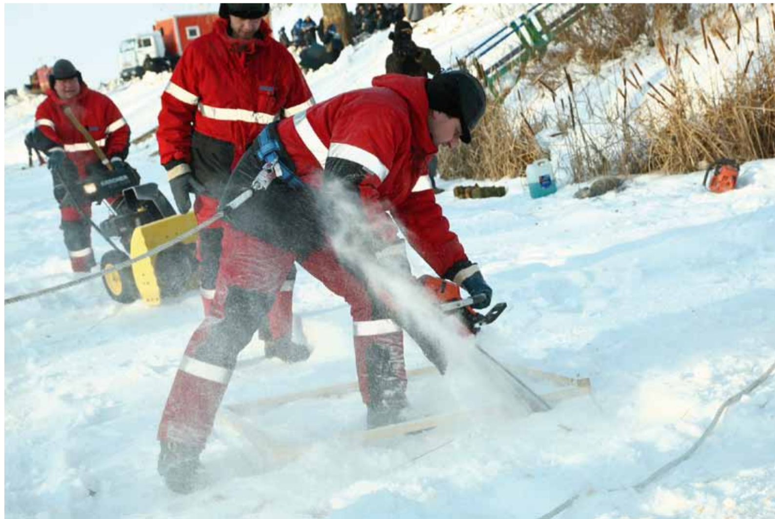
Без бензопилы зимой не обойтись

Здесь, на небольшой речке Салмыш, еще пять минут назад царил необычайное умиротворение: снег поблескивал под по-весеннему яркими лучами солнца, пустовала накатанная санками сельских ребятишек горка на высоком берегу, а напротив на дереве покачивалась забытая кем-то с прошлого лета тарзанка. И полнейшая тишина!