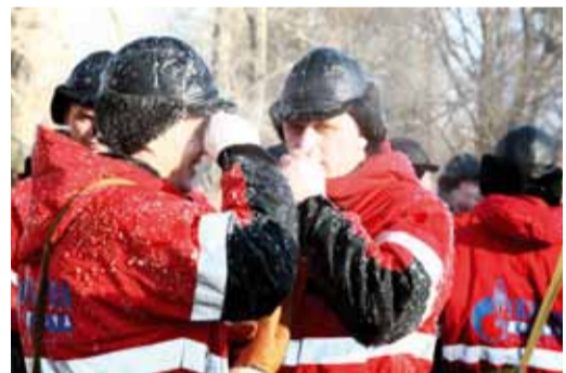
Мороз работе не помеха