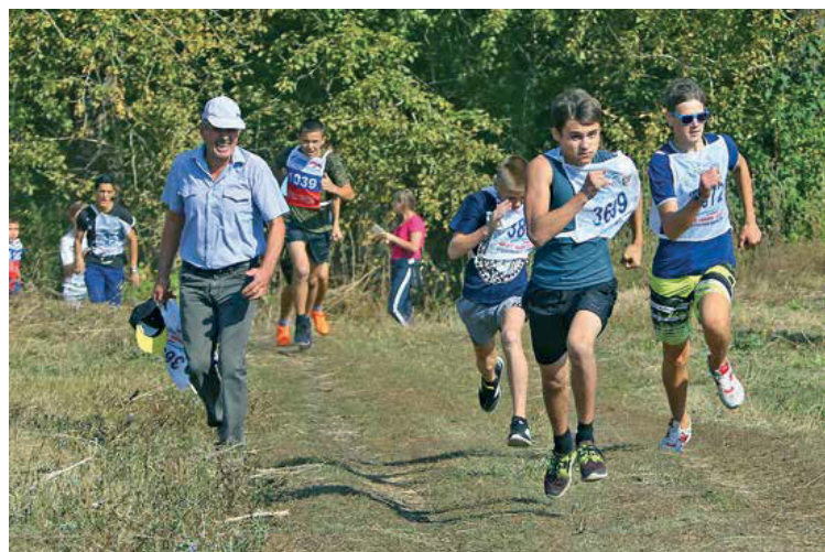
По шесть лидеров в каждом забеге получили награды

Наибольшего успеха достигли легкоатлеты. Они соревновались в беге на 400 и 600 метров, метании мяча и прыжках в длину. В эстафете наши девочки заняли первое место, мальчики — седьмое. В общем зачете девочки завоевали серебро, мальчики стали шестыми. В соревнованиях по футболу и плаванию у оренбуржцев одиннадцатое место, в шахматах — девятое.