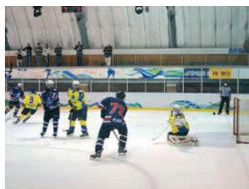
Первый матч Юниорской хоккейной лиги нового сезона

Победой оренбургской команды завершился первый тур нового сезона Юниорской хоккейной лиги России.