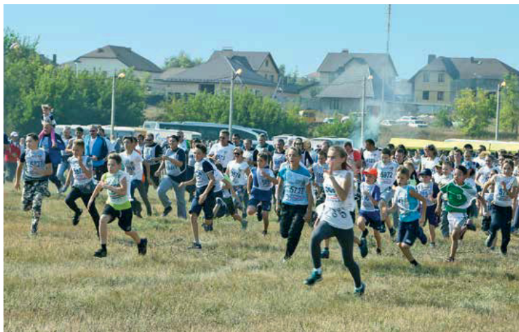
Массовый старт в селе Павловка Оренбургского района

Более 4 тысяч работников ООО «Газпром добыча Оренбург», предприятий некоммерческого партнерства «Газпром в Оренбуржье» и жителей сельских поселений вышли на старт «Кросса нации». Массовые состязания в рамках Всероссийского дня бега состоялись в селе Павловка Оренбургского района и райцентре Переволоцком. Их ежегодно организует Общество совместно с администрациями муниципалитетов. Кроме того, газовики присоединились к любителям бега в областном центре на стадионе «Оренбург».