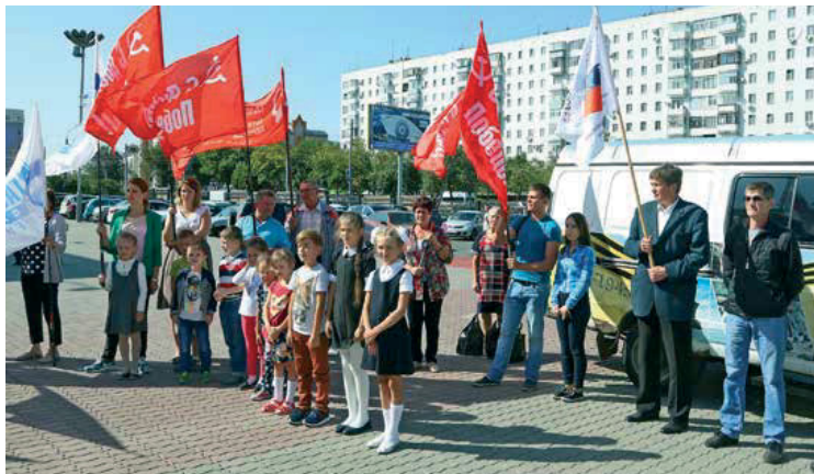
Оренбуржцы пожелали поисковикам доброго пути и успешной экспедиции

На прошлой неделе работники ООО «Газпром добыча Оренбург», составляющие основу Оренбургского сводного поисково-поискового отряда, отправились в экспедицию в Крым. Проводить их в торжественной обстановке пришли газовики, воспитанники детской школы искусств «Вдохновение» и горожане.