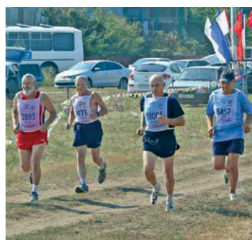
Ветераны подают пример здорового образа жизни

«Кросс нации» — особый спортивный праздник. Он объединяет людей разных