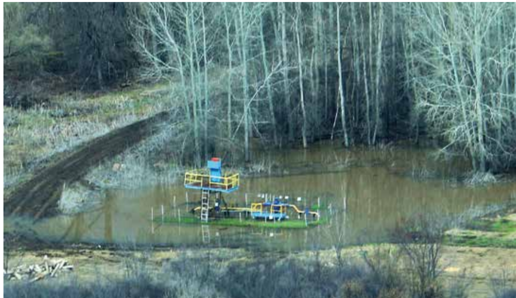
С высоты подтопленная скважина похожа на корабль. Промысловики позаботились о том, чтобы «плавание» было безопасным