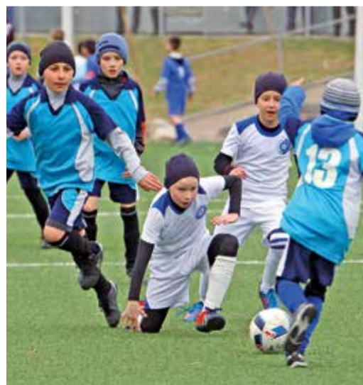
В турнире приняли участие 288 юных футболистов

Но немного не повезло. Тот матч в пятницу команда Димы уступила сопернику 0:4.