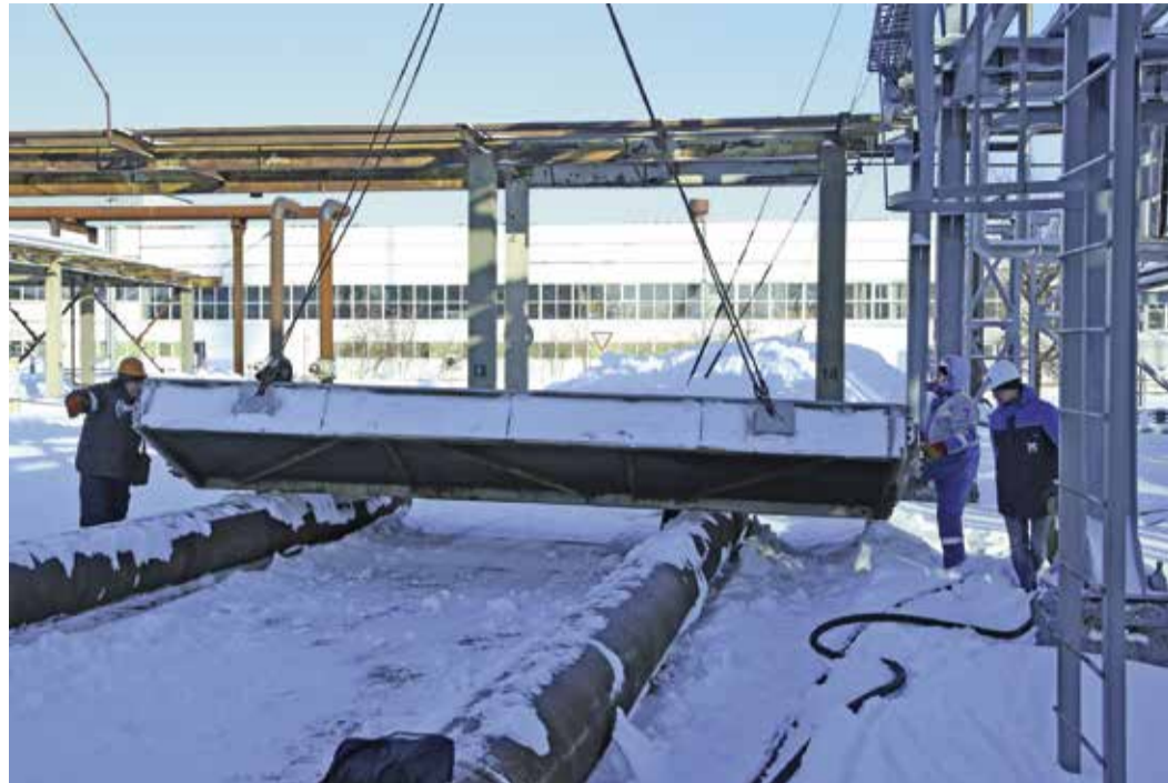
Идет демонтаж секции аппарата воздушного охлаждения и подготовка ее к пропарке

Технологическая сауна — так специалисты газового завода ООО «Газпром добыча Оренбург» шутя называют комплекс мероприятий по ремонту аппаратов воздушного охлаждения (АВО) пропано-холодильных установок.