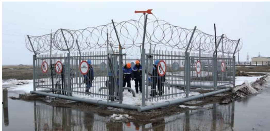
Сегодня подобраться к крановым площадкам — непросто