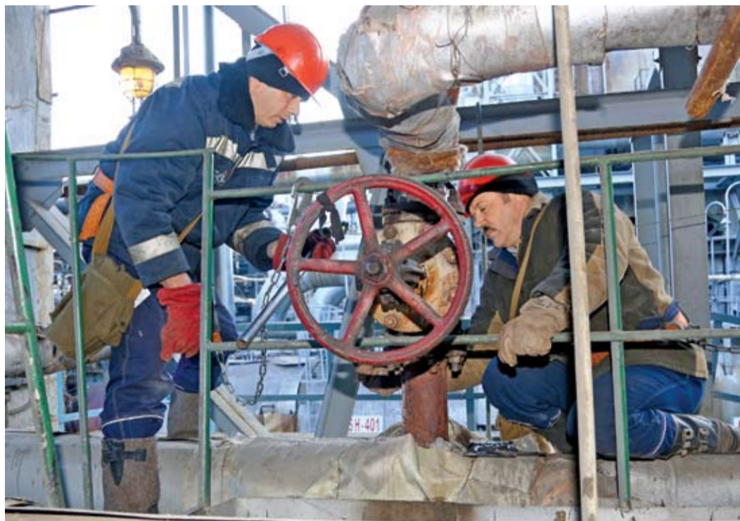
Ремонт серной установки в самом разгаре

Без серы трудно себе представить производство удобрений, бумаги и резины, спичек и тканей, лекарств и косметики, пластмассы и красок. До середины прошлого века ее основными источниками были добыча самородной серы и получение при выплавке металлов из сульфидных руд. С открытием Оренбургского нефтегазоконденсатного месторождения серу в нашем регионе стали производить из сероводорода, содержащегося в природном газе.