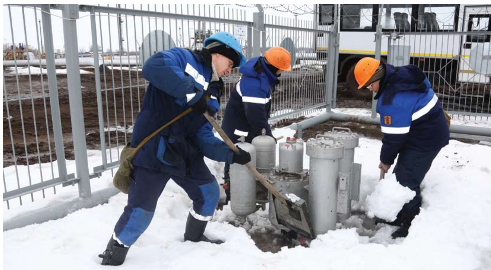
Во время половодья многие крановые площадки трубопроводов могут оказаться затопленными

По расчетам специалистов Оренбургского областного центра по гидрометеорологии и мониторингу окружающей среды, ледоход на Урале начнется в период с 9 по 14 апреля. Но уже сегодня лед на реке скрылся под водой: уровень воды в реке поднялся на два метра.