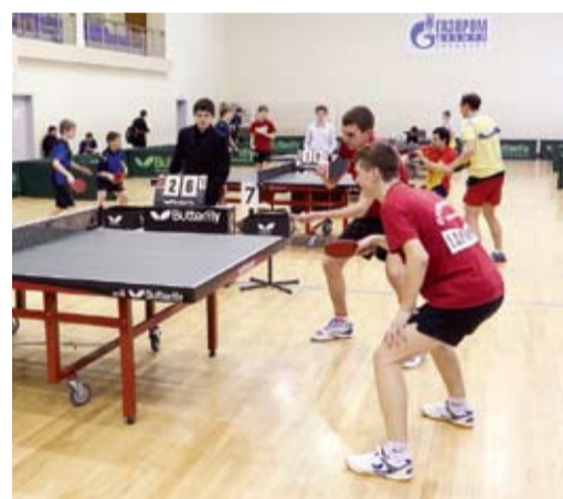
Соревнования проходили одновременно за 14 игровыми столами