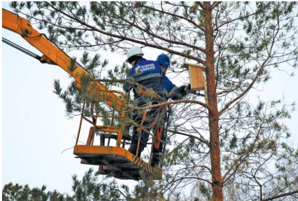
Свой дом — каждой птичьей семье

промышленного управления Елены Афанасовой, на текущий год, объявленный «Газпромом» Годом экологии, запланировано