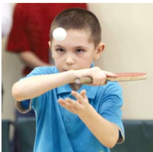
Точность — холодный расчет

В рамках недавно подписанного соглашения между ОАО «Газпром» и Группой MND (Чехия) планируется создать новое подземное хранилище газа в Дамборжице (Южная Моравия). Начало строительства запланировано на 2014 год. Введение в эксплуатацию намечено на 2016 год. ПХГ будет иметь активный объем газа 448 миллионов кубических метров. Инвестиции в создание ПХГ будут выделены компаниями в равных долях и составят около 128 млн долл. США.