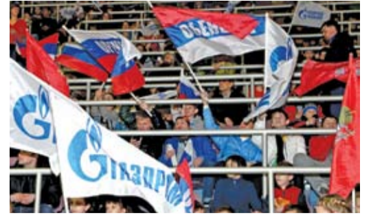
Болельщики увидят любимый клуб в финале

Победителю будет вручен денежный приз в размере 100 тысяч рублей.