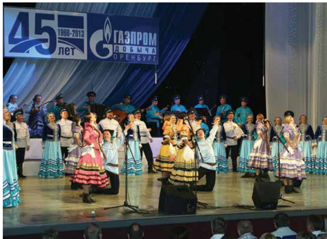
Подарком для гостей юбилея стало выступление Оренбургского русского народного хора

Почетными грамотами Министерства энергетики РФ награждены четыре работника Общества. Еще восемь получили от Минэнерго благодарности. Одному газовику присвоено звание ветерана ОАО «Газпром», семнадцать человек награждены почетными грамотами и благодарностями Компании. Законодательное собрание области отметило двоих работников Общества, правительство области и губернатор — троих. От города Оренбурга и Оренбургского района благодарность получили четыре человека.