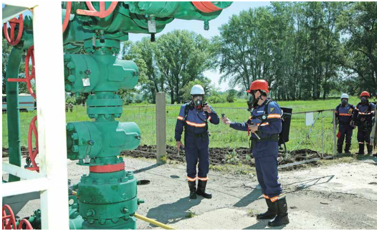
Ведется замер уровня загазованности воздуха на скважине № 12000 с помощью портативного газоанализатора, показания передаются диспетчеру

«Воздушная тревога». Сигнал сирены, который звучал в оперативно-производственной службе № 12 газопромыслового управления, не создавал паники. Здесь 26 мая «репетировали» действия персонала на случай военных конфликтов.