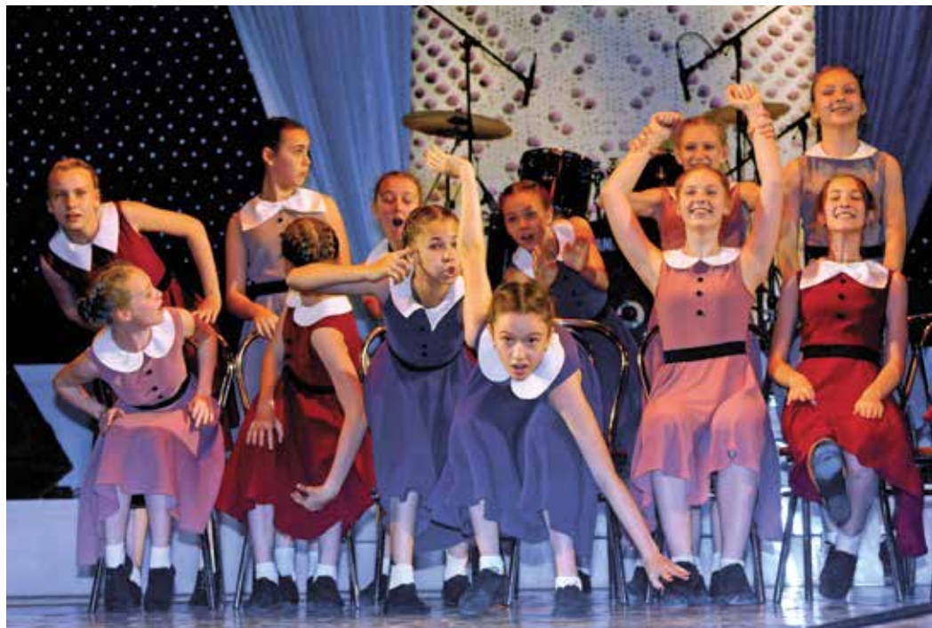
Детский музыкальный театр «Апельсин»

— Впечатления колоссальные! О некоторых исполнителях, которые участвовали