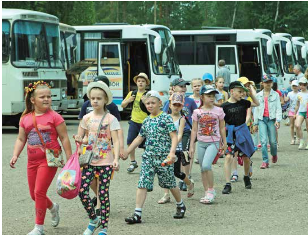
Впереди у маленьких «самородков» три недели отличного отдыха в загородном лагере

Здравницы ООО «Газпром добыча Оренбург» первыми в Оренбуржье открыли летний оздоровительный сезон. 29 мая 460 юных оренбуржцев заехали в санаторно-оздоровительный лагерь круглогодичного действия (СОЛКД) «Самородово», а днем ранее на его территории открылся палаточный городок.