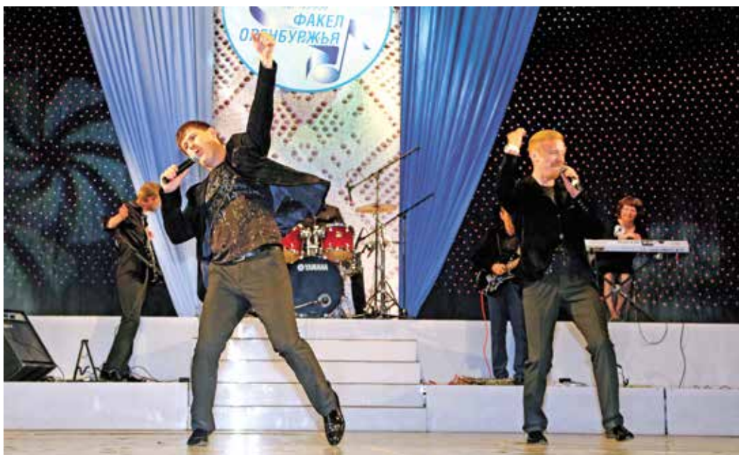
Вокально-инструментальный ансамбль «Экспромт» газоперерабатывающего завода

Одна из высших наград «Факела» принадлежит вокально-инструментальному ансамблю газоперерабатывающего завода «Экспромт». Коллектив, выступивший с композицией «Богемская рапсодия» легендарной группы «Queen», в Белгороде на зональном туре в 2014 году завоевал Гран-при, а через год в финале в Сочи — первое место. Сейчас в репертуаре ВИА другая композиция все той же «Queen» — «Somebody to love». «Экспромт» вновь стал одним из победителей.