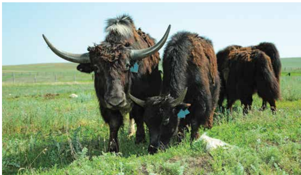
Ростовским якам оренбургская степь пришла «по вкусу»

28 мая Центр разведения степных животных «Оренбургская Тарпания», расположенный в Беляевском районе, пополнился новыми обитателями. Благодаря поддержке ООО «Газпром добыча Оренбург» сюда из Ростовской области были доставлены четыре яка.