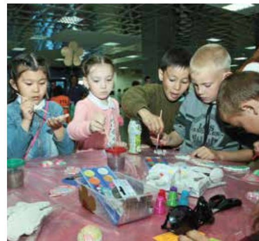
Дети раскрашивали поделки в яркие цвета