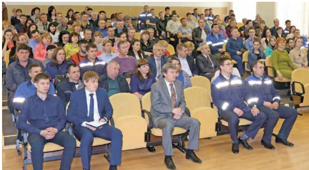
В едином дне информации приняли участие около 800 работников ООО «Газпром добыча Оренбург»

По поводу роста стоимости блюд в столовых и буфетах было сказано, что он связан с резким скачком цен на продукты еще в прошлом году (по отдельным позициям они выросли до 30%). Стоимость обеда формируется из двух основных составляющих: стоимости сырья и его приготовления. Компенсация, которую осуществляет предприятие, касается преимущественно второй доли. Что же касается жалобы на уменьшившиеся порции, то согласно технологическому раскладу за 4 месяца этого быть не должно. В точке питания, которая могла этим «грешить», будет проведена проверка.