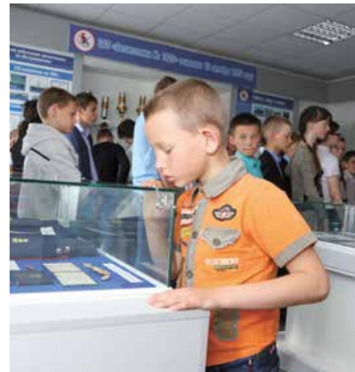
«Я в водители пошел. Пусть меня научат»

Дети с любопытством разглядывали фотографии, на которых запечатлена автотехника разных лет. Кроме того, они узнали, что в годы войны мастера автоколонны восстановили и отправили на фронт 630 автомобилей ЗИС и ГАЗ, а в 1980 году оренбургские водители на своих автобусах обслуживали гостей Олимпиады в Москве. Сегодня ежедневно на линии выходят более 200 автобусов, которые доставляют газовиков к месту работы и домой.