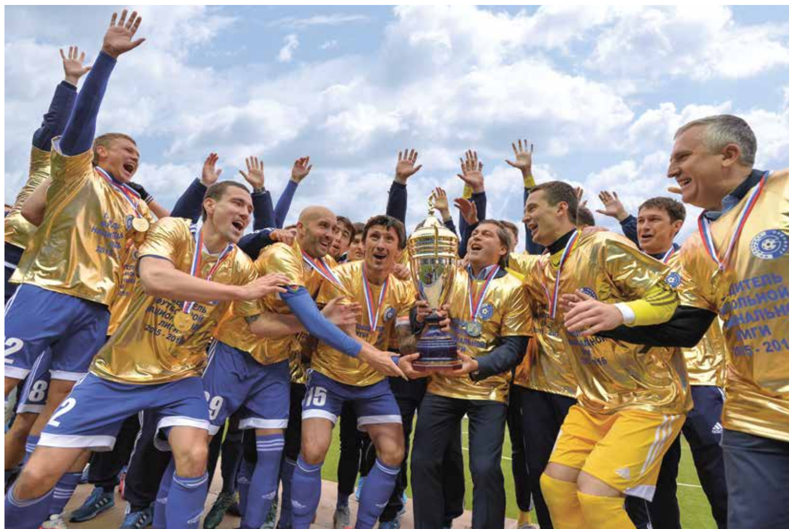
«Газовик» в золотом: главный трофей Футбольной национальной лиги у оренбургской команды!

«Газовик» стал победителем Футбольной национальной лиги и досрочно вышел в российскую футбольную Премьер-лигу! А ведь не так давно эта фраза воспринималась бы не иначе, как шутка.