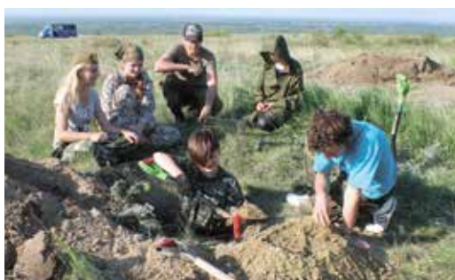
Чтобы не повредить находки, поисковики снимают землю слой за слоем

Наталья ПОЛТАВЕЦ