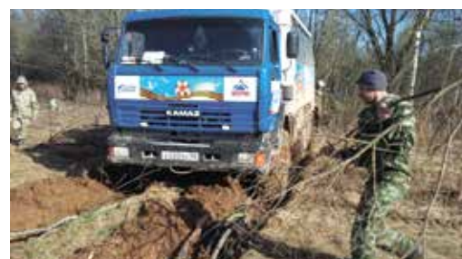
КамАЗ помог поисковикам добраться до места раскопок

В Тверской области оренбуржцы стали участниками межрегионального мемо-