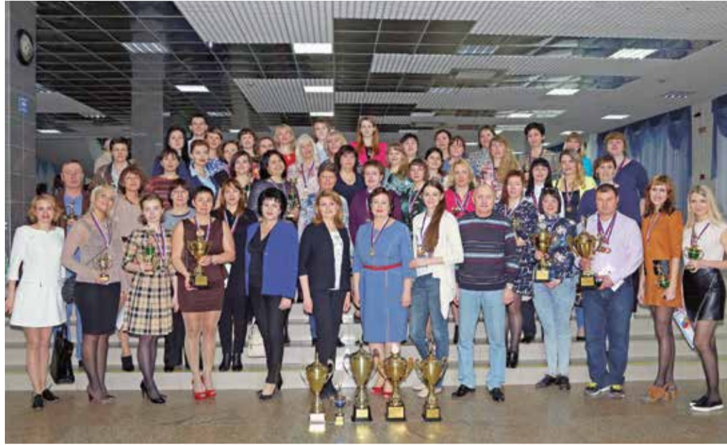
Участницами спартакиады стали более ста работниц предприятий некоммерческого партнерства «Газпром в Оренбуржье»

В программу спартакиады включены состязания по волейболу, настольному теннису, плаванию и шахматам. На спортивные площадки вышли свыше ста спортсменок от 10 предприятий партнерства.