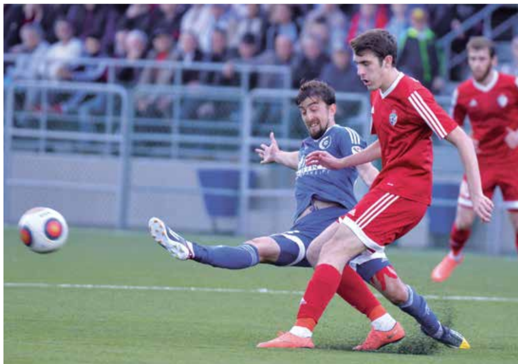
Индивидуальная борьба в этом матче была на каждом участке поля

Алексей СОРОКИН