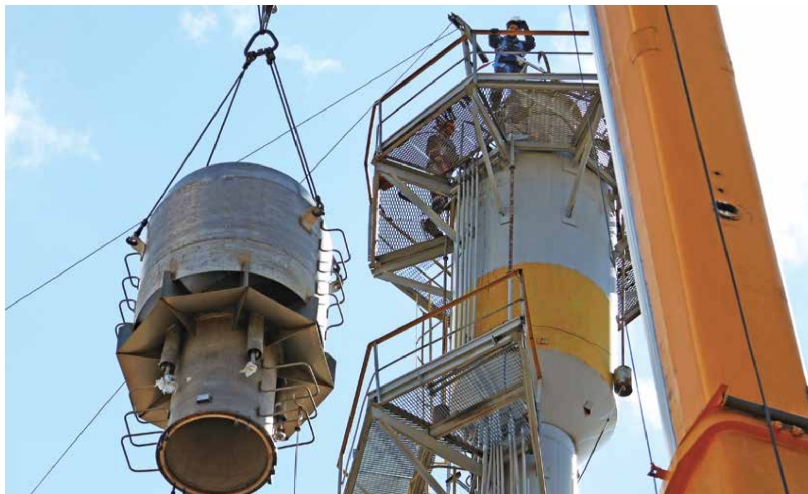
Идет установка модернизированного оголовка на ствол факела

В апреле на гелиевом заводе ООО «Газпром добыча Оренбург» завершилась модернизация факельного оборудования. Направлена она на повышение надежности, экологическую безопасность, обеспечение полного сгорания газа.