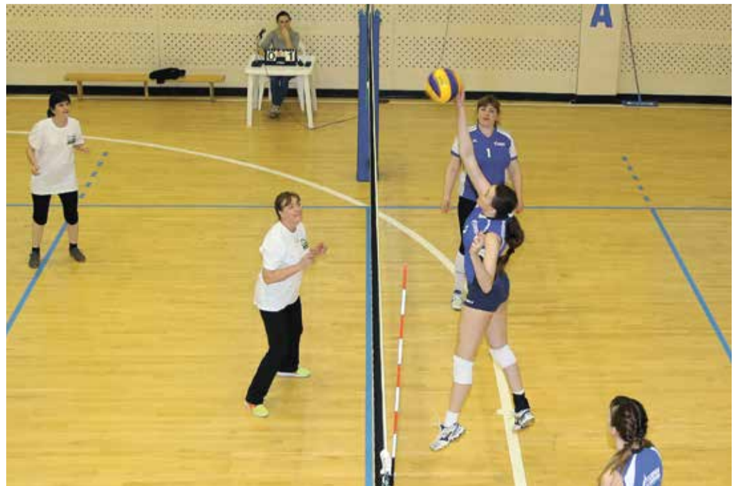
Матч между командами ООО «Газпром добыча Оренбург» и Павловского лицея Оренбургского района