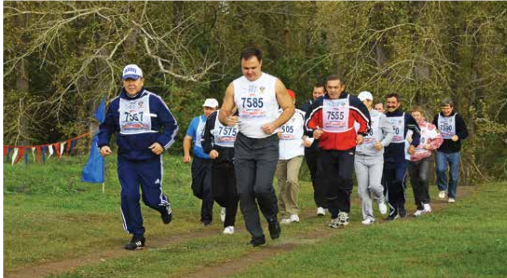
VIP-забег: руководители ООО «Газпром добыча Оренбург» и Переволоцкого района показывают пример

«Мы активно взаимодействуем с жителями районов, на территории которых ООО «Газпром добыча Оренбург» ведет