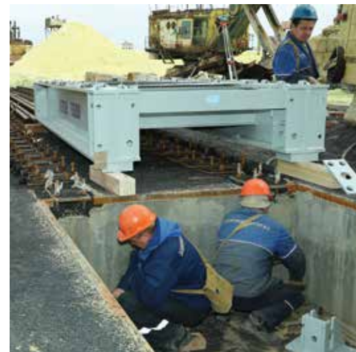
Скоро взвешивать серу на заводе будут точнее и быстрее

К окончанию ППР будет также введена в эксплуатацию система видеоидентификации, благодаря которой будет автоматически считываться бортовой номер вагона и оформляться квитанция взвешивания. На сегодня уже завершены ремонт и замена погрузочных бункеров, вертикального транспортера, проведена антикоррозийная обработка транспортной галереи, регламентные работы в машинном зале.