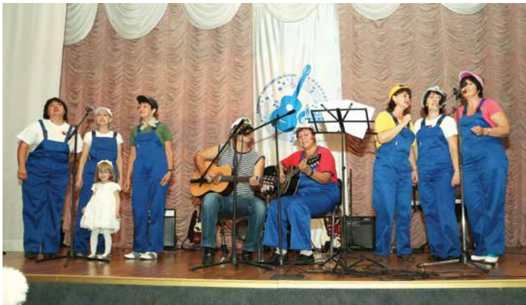
В порыве чувств...