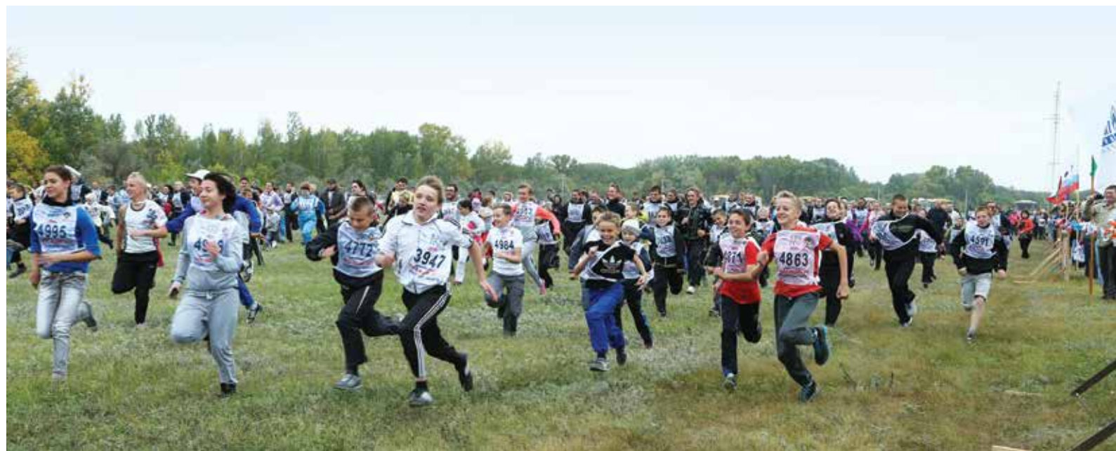
Массовый старт. Все бегут!

22 сентября состоялся массовый спортивный праздник — Всероссийский легкоатлетический забег «Кросс нации». В нем приняли участие более шести тысяч газовиков и жителей сел Оренбургского и Перволюцкого районов. Они вышли на старт на поляне возле озера Пионерского у села Дедуровка и в Тополиной роще в райцентре Перволюцкий. Здесь состязания проводились Обществом «Газпром добыча Оренбург» и администрациями муниципальных образований. Газовики также поучаствовали в забегах в Зауральной роще города Оренбурга.