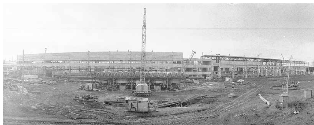
Ведется строительство 2-й очереди гелиевого завода. 1981 год