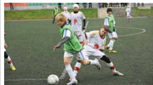
Теплый ноябрь подарил неделю футбола

Среди команд 2002—2003 года рождения победу одержала тольяттинская «Лада», второе место заняла сборная ДЮСШ № 1 из Бузулука, третье — у «Академии футбола» из Челябинска. Команда ДЮСШ «Газовик» заняла 4-е место.