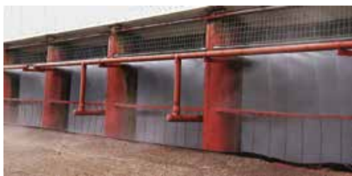
Вода в градирне льется круглый год

Каким бы сильным и теплым ни был водный поток, мороз берет свое. На внутрен-