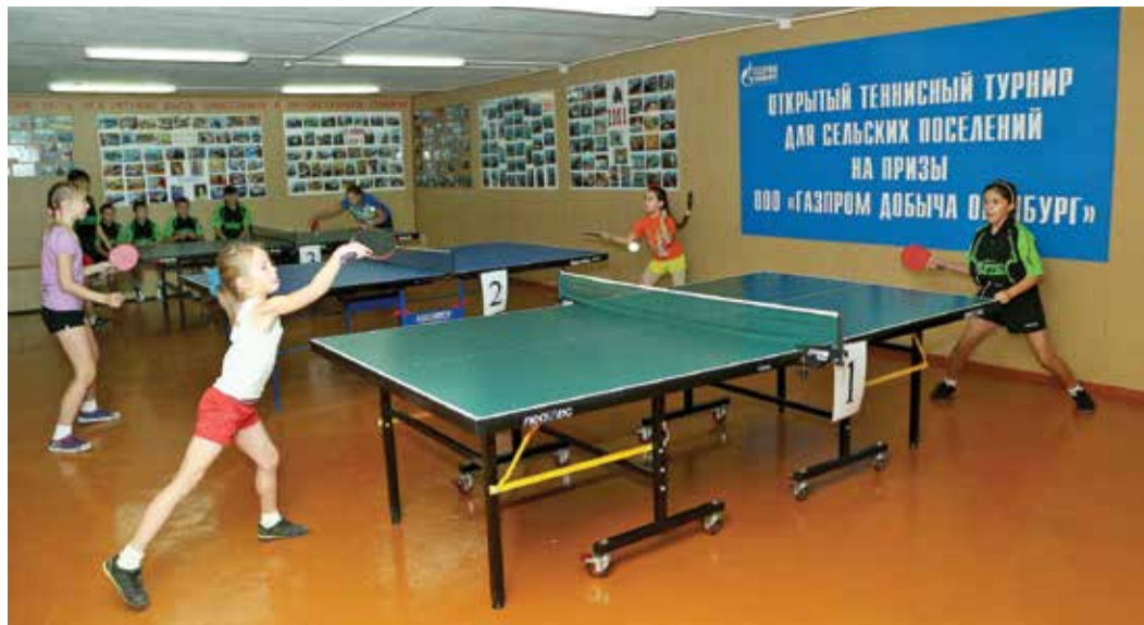
В соревнованиях мог участвовать любой сельский житель без ограничения по возрасту

9 ноября тишину опустевшей на время каникул Дедуровской средней школы нарушили голоса детей и взрослых. Здесь состоялся ежегодный открытый турнир по настольному теннису среди команд сельских поселений на призы ООО «Газпром добыча Оренбург».