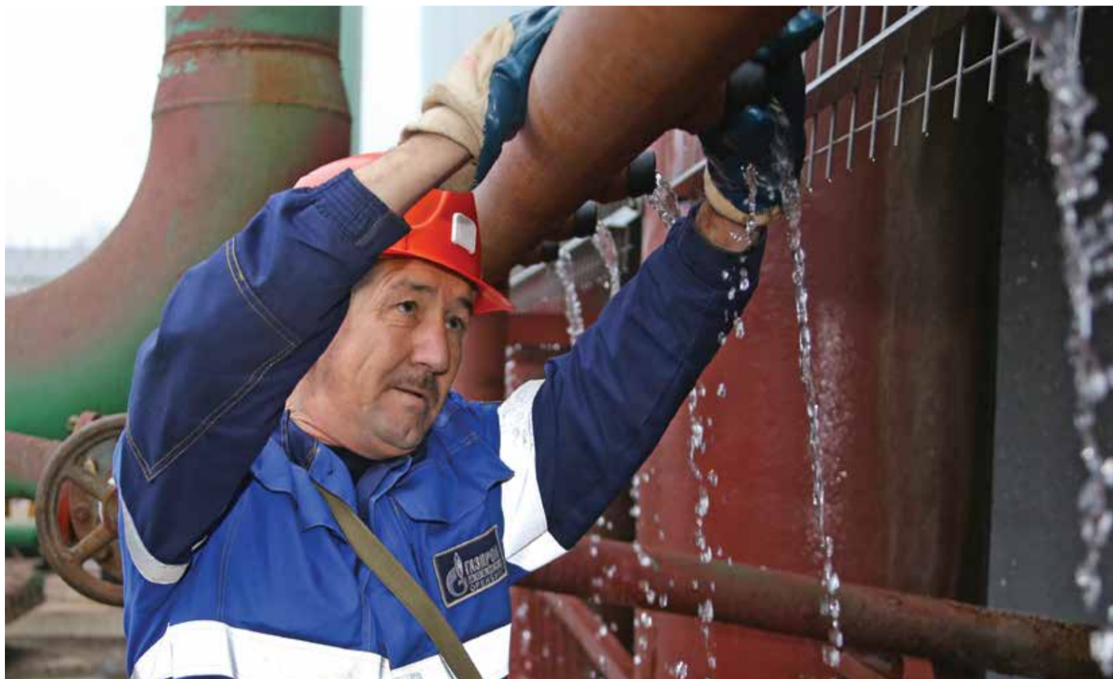
Ведется проверка работы антиобледенительной системы градирни