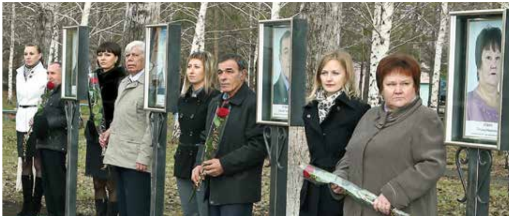
Ветераны на Аллее своей трудовой славы

15 ноября управление материально-технического снабжения и комплектации Общества отметит 45-летний юбилей. В преддверии, 7 ноября, в структурном подразделении торжественно была открыта Аллея трудовой славы.