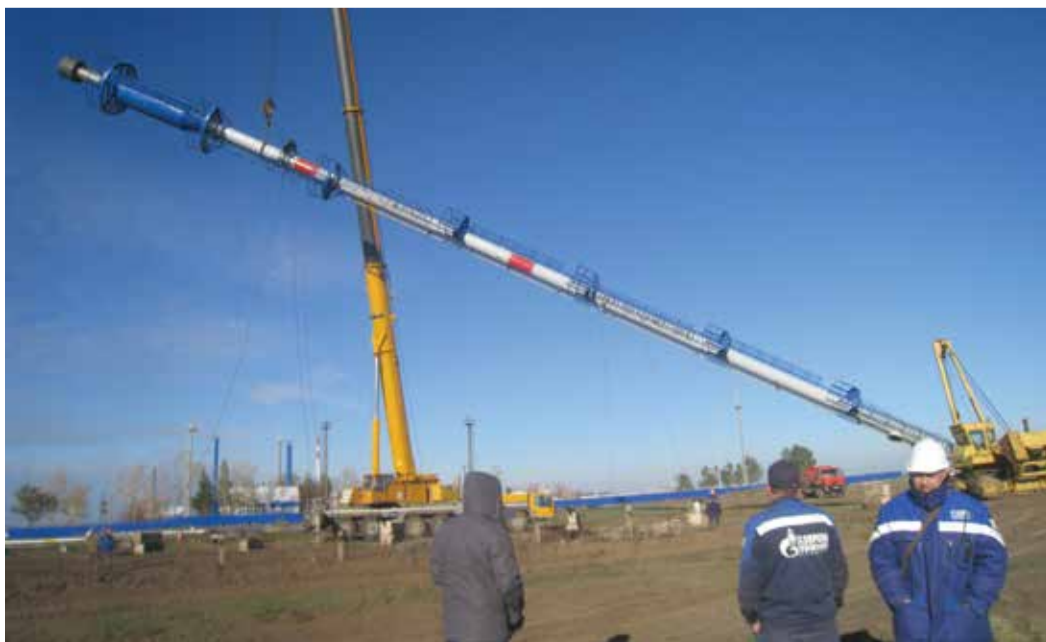
Установить такую 60-метровую конструкцию под силу только 250-тонному крану

60-метровый факел-старожил (установлен в 1975 году) уже вновь смонтирован и обвязан. Осталась только «косметика» — где требуется, поправить опоры трубопровода, подкрасить, привести в порядок прилегающую территорию. Глядя на факельную систему снизу вверх, сложно себе даже представить манипуляции на высоте 17-этажного дома. Но благодаря большому опыту монтажников и помощи 250-тонного подъемного крана возвращение факела в вертикальное положение прошло без проблем.