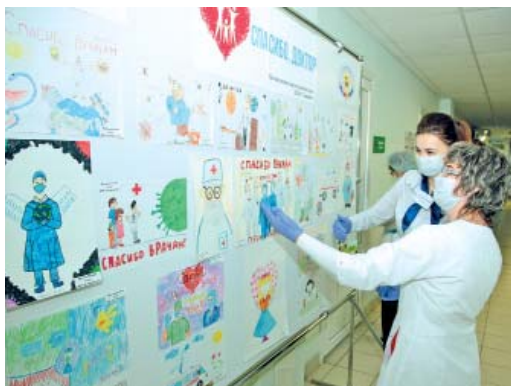
В фойе клиники появился стенд с рисунками детей, которые благодарят врачей за самоотверженный труд

Дети отразили в рисунках то, как представляют себе работу врачей в условиях пандемии. В творческом процессе участвовали родители и воспитатели. Медиков изобразили героями, которые ведут борьбу с вирусом, ангелами, укрывающими людей белыми крыльями. Слова благодарности — на каждом рисунке, переданном в клинику промышленной медицины (КПМ). В фойе из них оформили стенд.