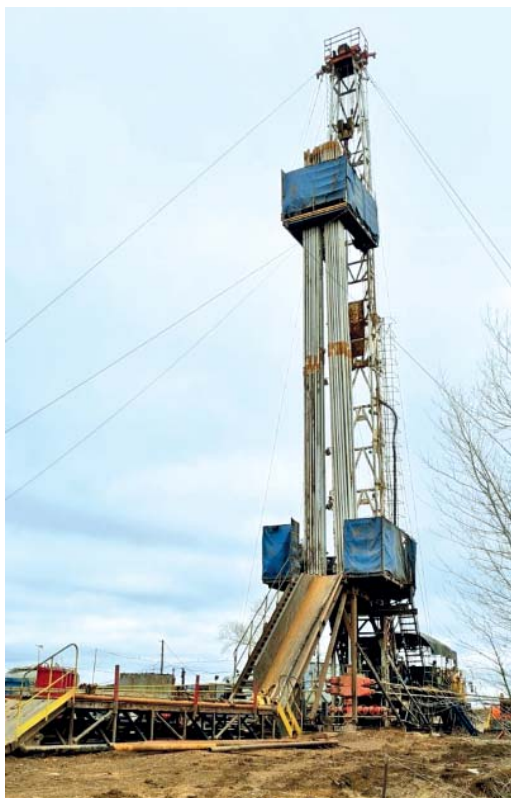
При ликвидации скважины используется специальное оборудование и подъемный агрегат