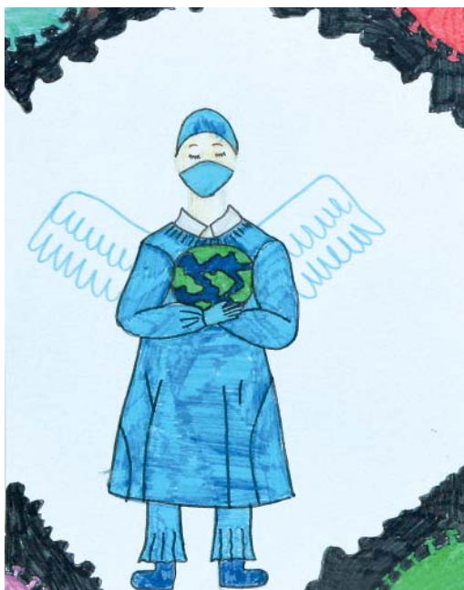
Милана Дидоха, 5 лет