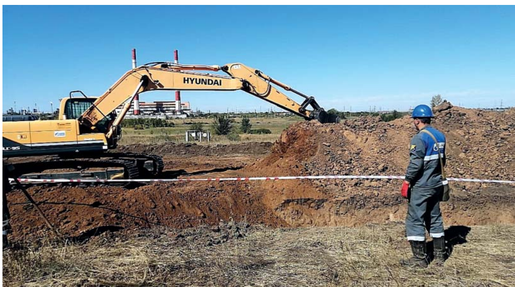
Представитель Нижнепавловского ЛПУ осуществляет контроль за проведением земляных работ

Мероприятия выполнены в рамках комплексной программы, направленной на предотвращение несанкционированного вмешательства в работу трубопроводов ООО «Газпром добыча Оренбург». В ее реализации участвовали специалисты управления по эксплуатации соединительных продуктопроводов (УЭСП), управления технологического транспорта и специальной техники (УТТиСТ), управления аварийно-восстановительных работ, службы строительного контроля инженерно-технического центра и службы корпоративной защиты Общества. На территории, которую обслуживает Нижнепавловское ЛПУ, внимание было сосредоточено на четырех трубопроводах диаметром 350 мм. По двум из них сырье поступает на газоперерабатывающий завод ООО «Газпром переработка», по дру-