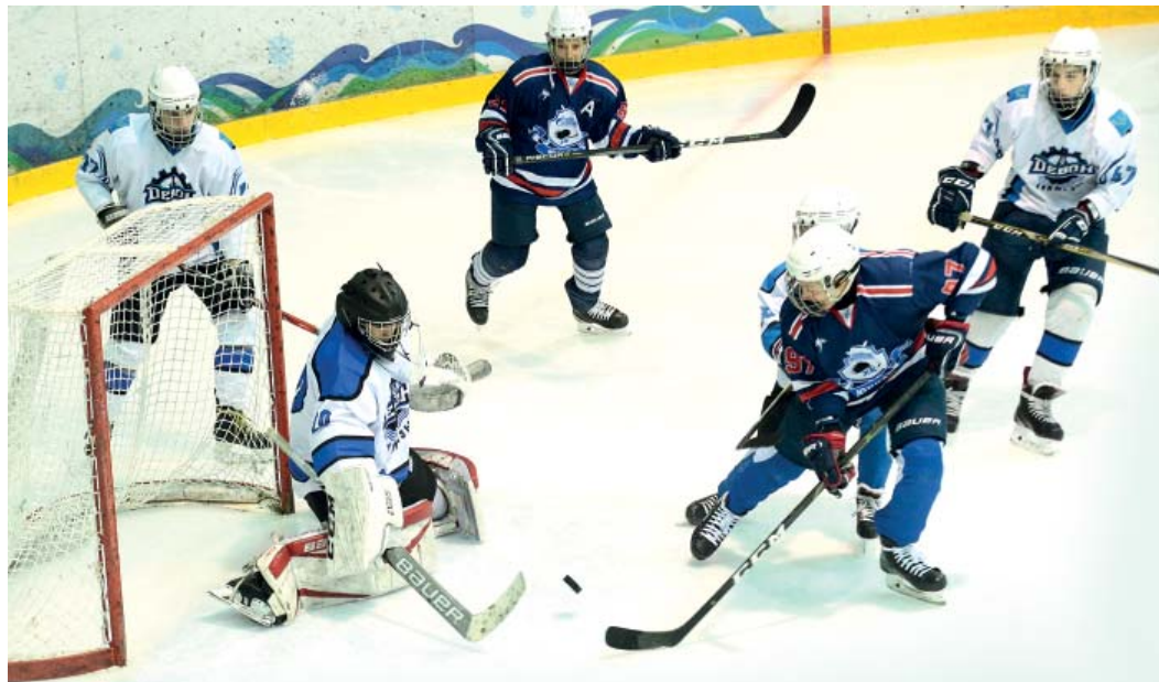
Атака «Юбилейного» завершилась взятием ворот «Девона»

В минувшие выходные в Оренбурге прошел очередной тур первенства ПФО по хоккею среди юношей до 15 лет и юниоров до 18 лет. Местом проведения стала социальная площадка ООО «Газпром добыча Оренбург» — Ледовый дворец на Цветном бульваре.