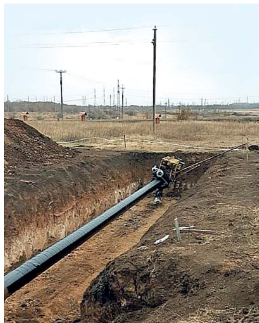
Изоляционное покрытие на трубопроводы наносится механизированным способом