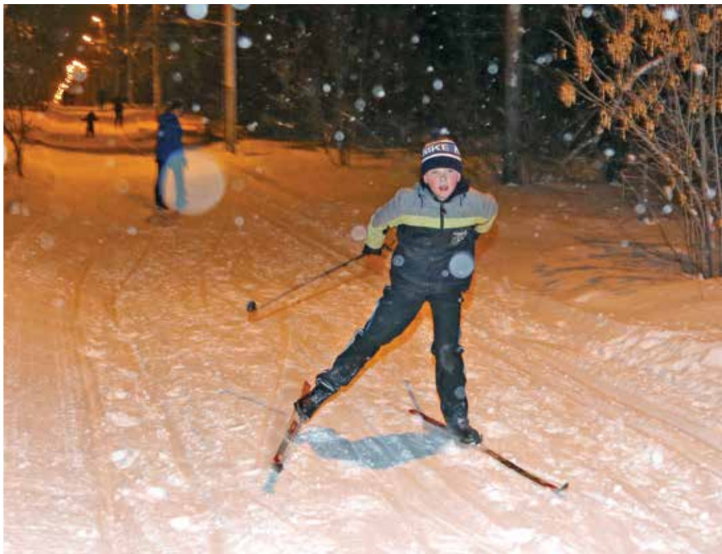
Сказочный зимний лес позвал на лыжную прогулку