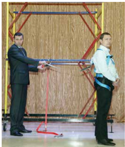
Для участников мероприятия — тренинг по безопасной работе на высоте