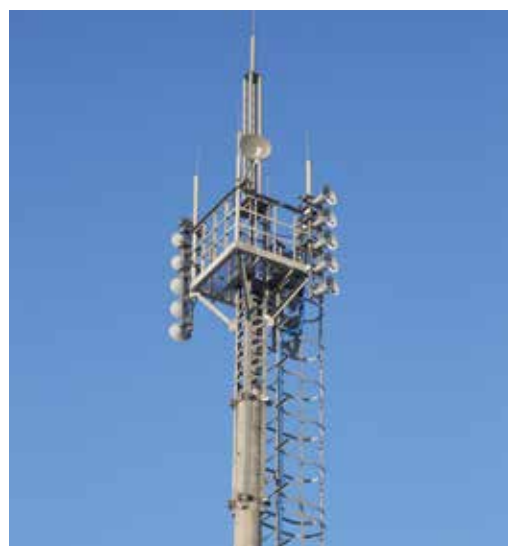
Громкоговорители расположены на 25-метровой высоте

Светлана НИКОЛАЕЦ