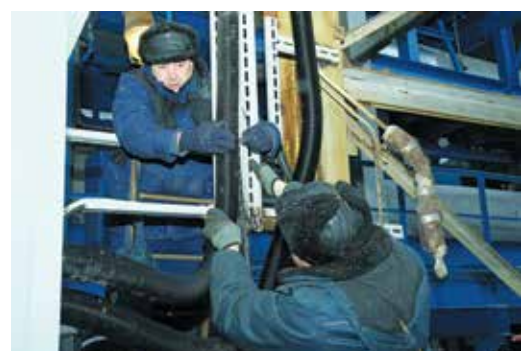
Монтируется анализатор для контроля качества отходящих газов