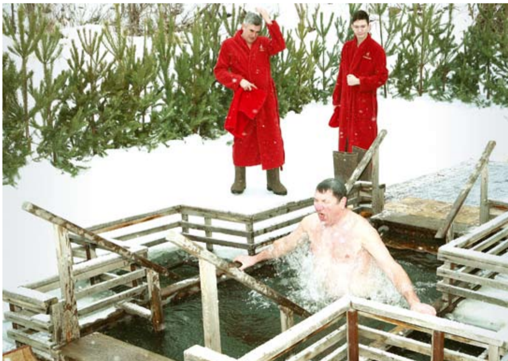
Купание — лучшая прививка от гриппа