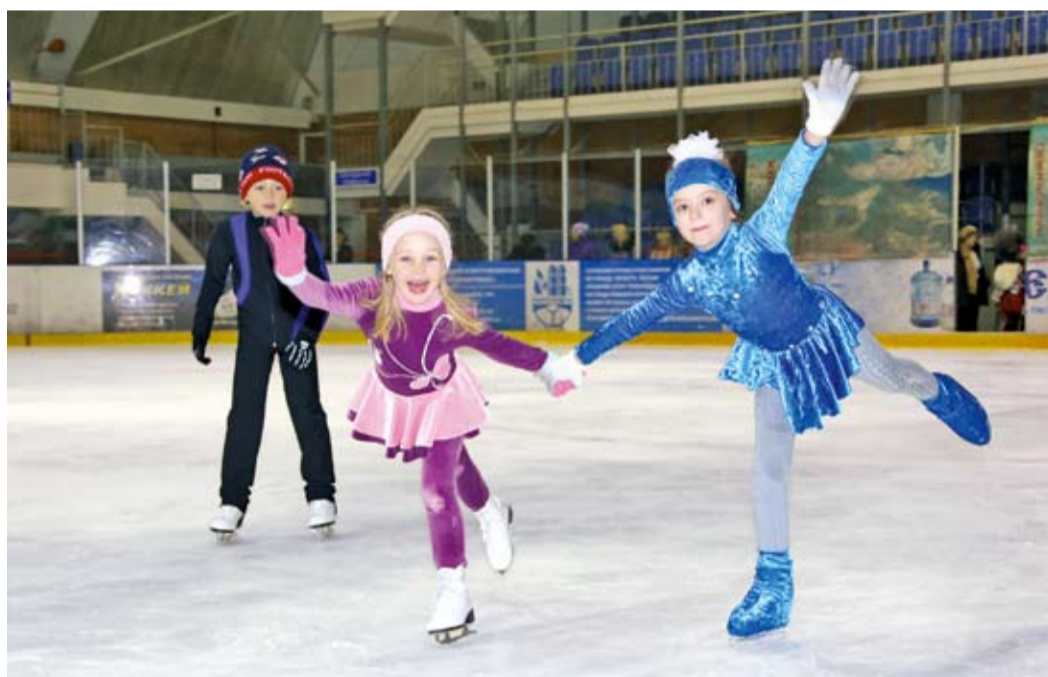
«Покажу я вам „ласточку”»

На его базе занимаются воспитанники отделения хоккея с шайбой и фигурного катания детско-юношеской спортивной школы спорткомплекса «Юбилейный», которая также развивает футбол, плавание, лыжный спорт, настольный теннис, легкую атлетику, волейбол и баскетбол. На восьми отделениях тренируются 1163 ребенка.