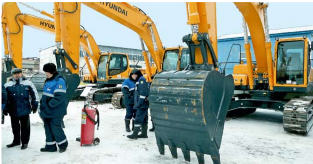
Парк автотехники Общества пополнился новенькими «железными конями»

Вы можете себе представить, как какую-то операцию на газовом комплексе выполнят одновременно 520 лошадей? Теперь увидеть это просто. Предприятие приобрело уникальный бульдозер ЧЕТРА Т35 с мощностью двигателя 520 лошадиных сил. Уникальная машина весит более 61 тонны (это общий вес почти 26 тракторов К-40). Масса одного лишь отвала едва дотягивает до 10 тонн. Этот бульдозер в числе 25 единиц новой техники поступил в управление материально-технического снабжения и комплектации. 17 января состоялась их торжественная передача управлению технологического транспорта и специальной техники и военизированной части.