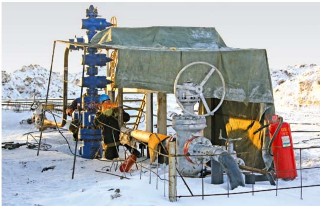
Для ремонта нет плохой погоды...

В октябре минувшего года «кормилица» (так газовики называют свои скважины) была остановлена на капитальный ремонт. В эксплуатацию она была введена более 30 лет назад, и это ее четвертый капитальный ремонт. Дебит скважины до остановки составлял 7 тысяч кубических метров газа в сутки. После капитального ремонта газодобытчики ожидают, что добыча возрастет в четыре раза.