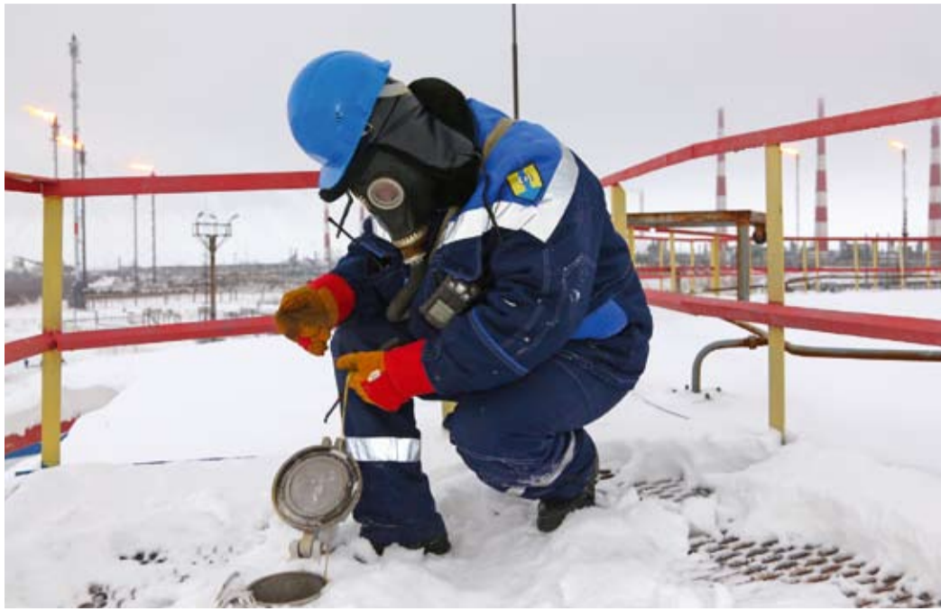
Ведется ручной замер уровня продукта в резервуаре