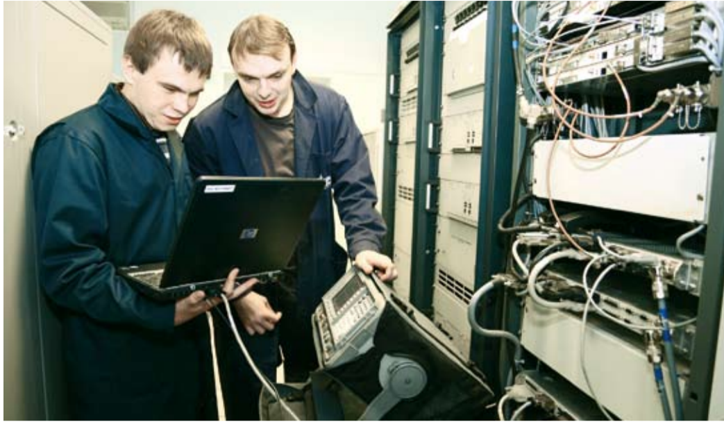
Радиоты проводят дистанционный мониторинг

Ветеранам-связистам радиоучасток управления связи ООО «Газпром добыча Оренбург» сегодня кажется... центром управления полетами. На огромном мониторе весело подмигивают десятки пиктограмм оборудования. Каждый объект «виден» как на ладони. С места проводится дистанционный мониторинг радиорелейных линий.