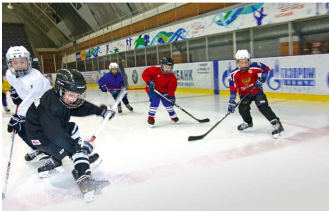
Игра с характером

Весь день в Ледовом дворце поселка Ростоши точно по Пушкину. Ранним утром сюда спешат маленькие фигуристы, чтобы потренироваться и успеть в детский сад, пока каша не остыла. Затем на каток выходят хоккеисты. Свободным он бывает только ночью.