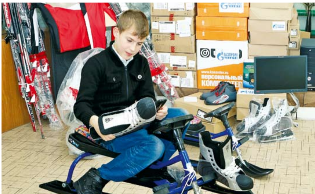
Подарки для отличной учебы и крепкого здоровья

16 января представители ООО «Газпром добыча Оренбург» побывали в Кардаиловском детском доме Илекского района. Это одно из пяти детских учреждений области, над которыми с 2006 года шефствует предприятие.