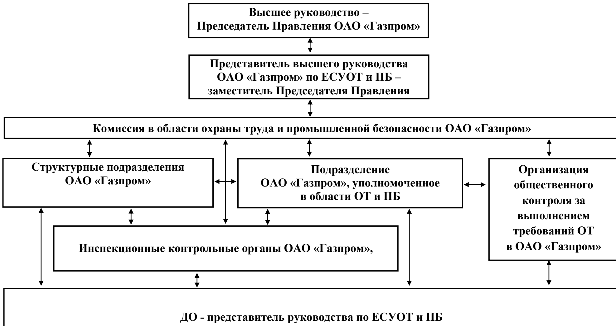
Схема структуры Единой системы управления охраной труда и промышленной безопасностью в ОАО «Газпром»