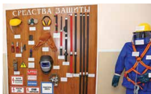
Использование СИЗ — эффективная мера профилактики травматизма

На территории гелиевого и газоперерабатывающего заводов Общества организована химчистка, стирка и ремонт спецодежды для работников всех подразделений Общества. В минувшем году здесь было постирано около 23 тысяч килограммов спецодежды, почищено порядка 7,5 тысячи единиц средств индивидуальной защиты.