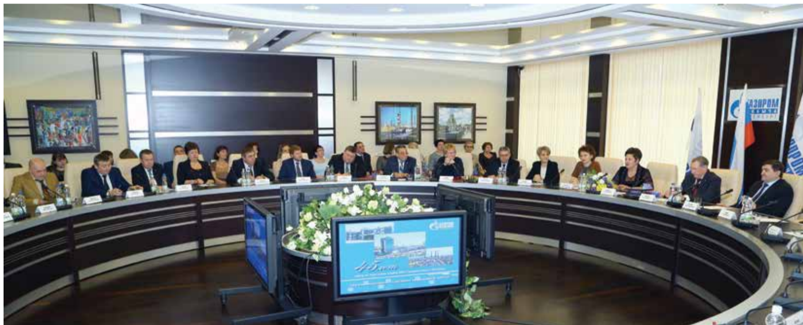
ЦПК отметил юбилей проведением семинара «45-летний опыт подготовки персонала»

ЦЕНТР ПО ПОДГОТОВКЕ КАДРОВ ООО «ГАЗПРОМ ДОБЫЧА ОРЕНБУРГ» ОТМЕТИЛ 45-ЛЕТИЕ