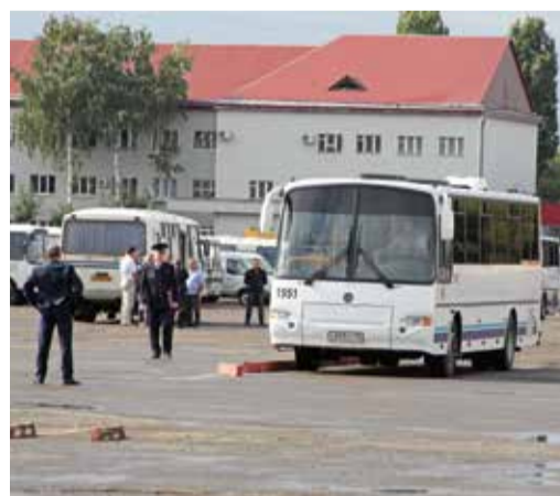
Выполняется фигурное маневрирование