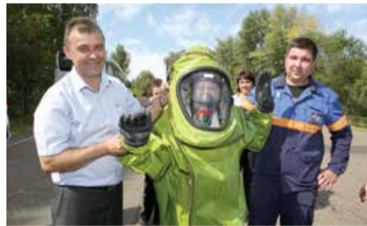
На необычном уроке, проведенном работниками военизированной части, ребята примерили костюмы, похожие на космический скафандр

Губернатор Оренбургской области Юрий Берг на церемонии открытия «Тепла детских сердец» сказал: «Спасибо за то, что такой фестиваль есть у нас в области и в нашей стране!»