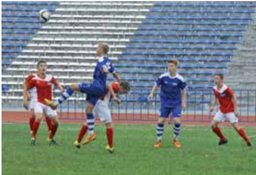
Оренбург (сине-белая форма) атакует Ухту