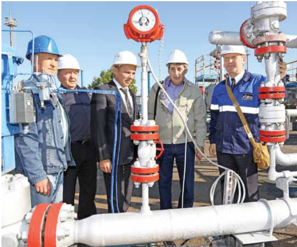
На юбилей УКПП-8 газодобытчики пригласили своих коллег, вышедших на заслуженный отдых

К слову о показателях. За 40 лет здесь было добыто почти 47 миллиардов кубических метров газа, 2 миллиона тонн конденсата и попутно с газом извлечено 580 тысяч