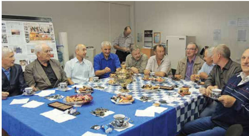
Ветераны механоремонтной службы ГПУ тепло вспоминают дела давно минувших лет

У французов тогда был большой опыт работы с сероводородом. Начались поставки оборудования, приехали специалисты из Франции. И вот поступила большая партия клиновых дюймовых задвижек — сплошной брак. Пропускают, разваливаются. Специалисты МРС их проверяют, а они рвутся.