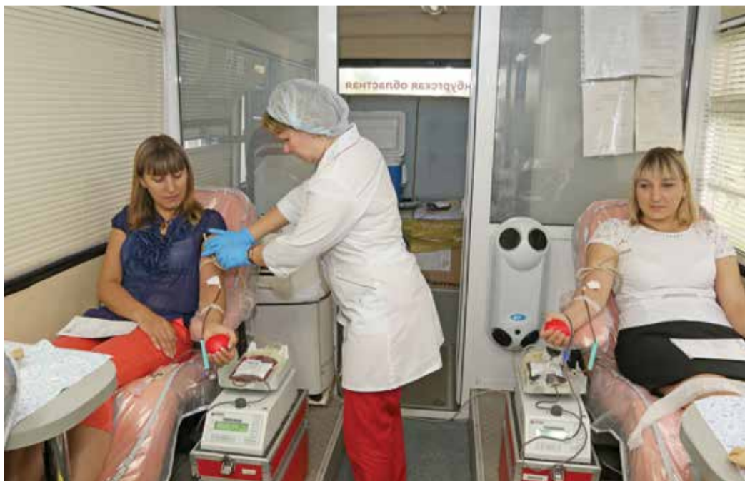
Ежегодно доноры гелиевого завода сдают порядка 500 литров крови