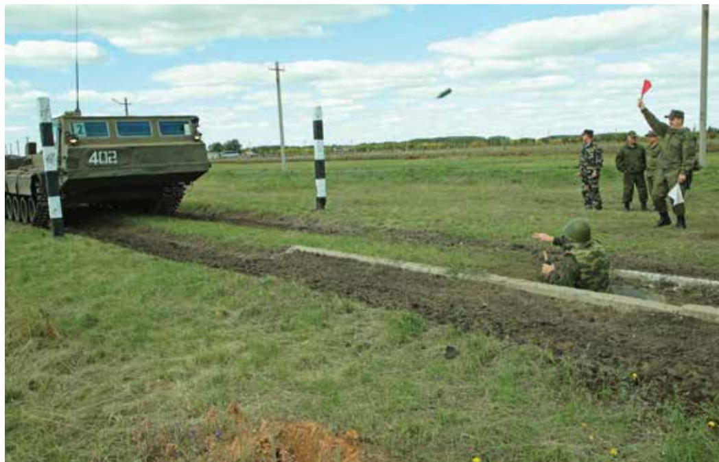
Танки не пройдут