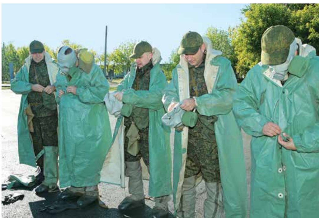
Прозвучала команда: «Плащ в рукава, чулки, перчатки надеть! Газы!»