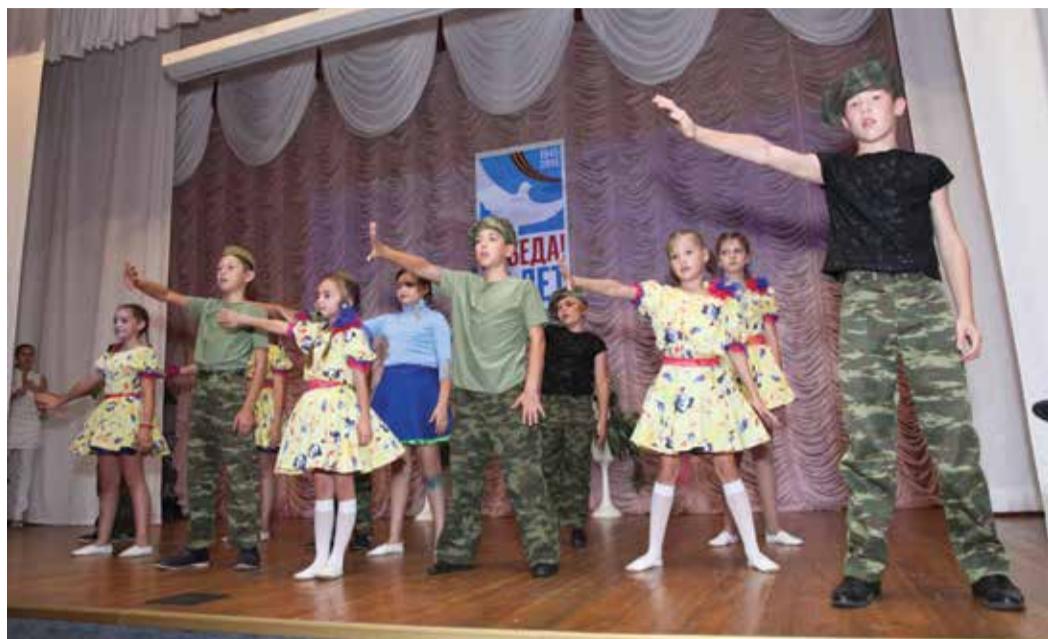
Постановка «Дети против войны» в исполнении воспитанников школы-интерната № 4 г. Оренбурга