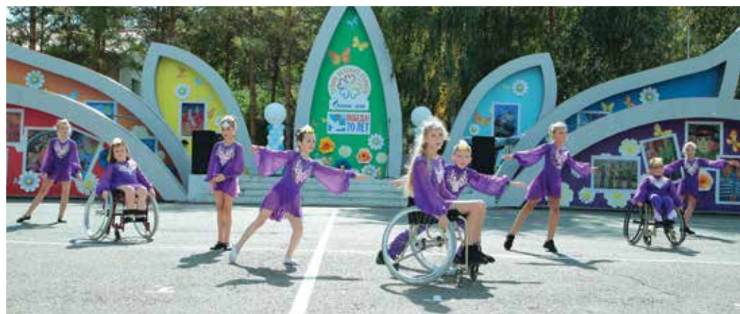
Коллектив «Преодолей-ка»: трудно ходить, но можно летать