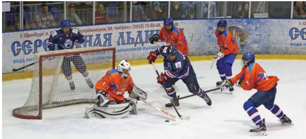
Борьба «Юниоров Газпрома» была упорной

В минувшие выходные в Ледовом дворце поселка Ростоши прошли календарные игры первенства России по хоккею с шайбой. С них начался игровой сезон 2015–2016 годов. В этом году в борьбу включатся три юношеские команды и юниоры.