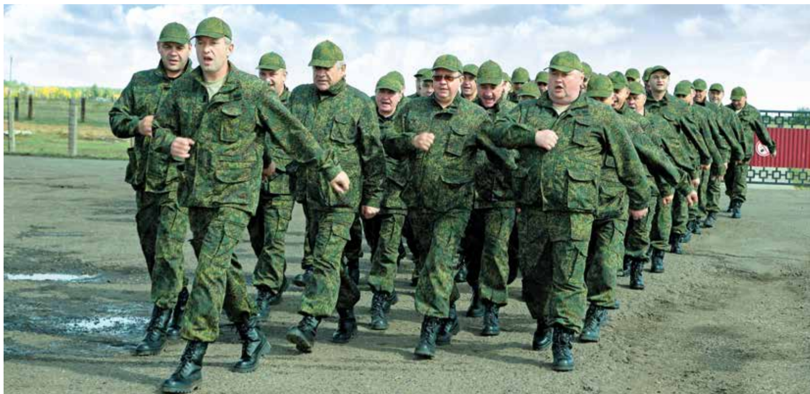
Прохождение строем с песней завершило сборы