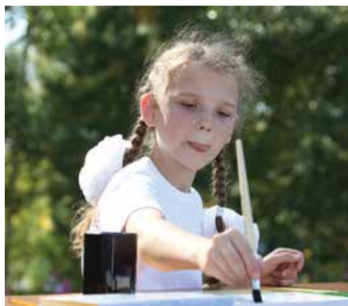
Юные художники для акварельных работ использовали теплые тона

глазами смотрели, как работают газоанализаторы, а воздушная подушка отрывает от земли многотонный автомобиль. Всем хотелось подышать воздухом из баллона и примерить защитную экипировку представителей одной из самых мужественных профессий в газовой отрасли.