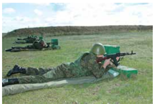
«На рубеже 50 метров! К бою!»

времени. Начав подготовку к сборам задолго до этого приказа, мы стали первыми в регионе, кто испытал себя в военно-полевых условиях. Результаты хорошие.