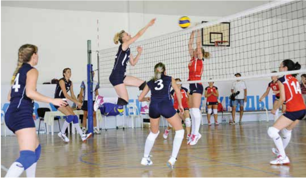
Наши волейболистки выиграли у соперниц из Ямбурга со счетом 2:0 (Оренбург — в синей форме)