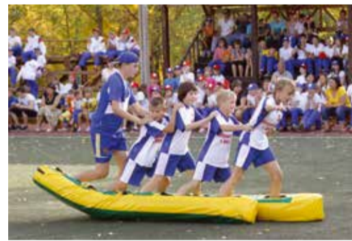
«Лыжная гонка» в сентябре

Сотни дипломов и подарков вручены юным участникам фестиваля на церемонии награждения. Жюри поощрило каждого ребенка, который проявил себя в спорте и творчестве. В общекомандном зачете первое место завоевали воспитанники детского дома села Кардаилово Илекского района Оренбургской области, второе — делегация школы-интерната № 1 города Оренбурга, третье — школы-интерната № 5 города Оренбурга.