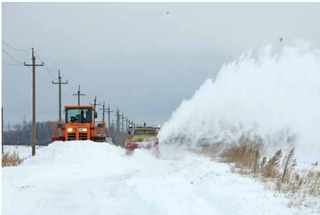
Идет очистка и расширение дороги, ведущей к установкам комплексной подготовки газа № 7 и № 8, дожимной компрессорной станции № 1 и базисному складу метанола

На трассе, соединяющей Илекское шоссе с седьмым и восьмым промыслами, трудилась техника первого цеха УТТиСТ. По словам транспортников, такие «снежные заряды» бывают ежегодно, так что сюрпри-