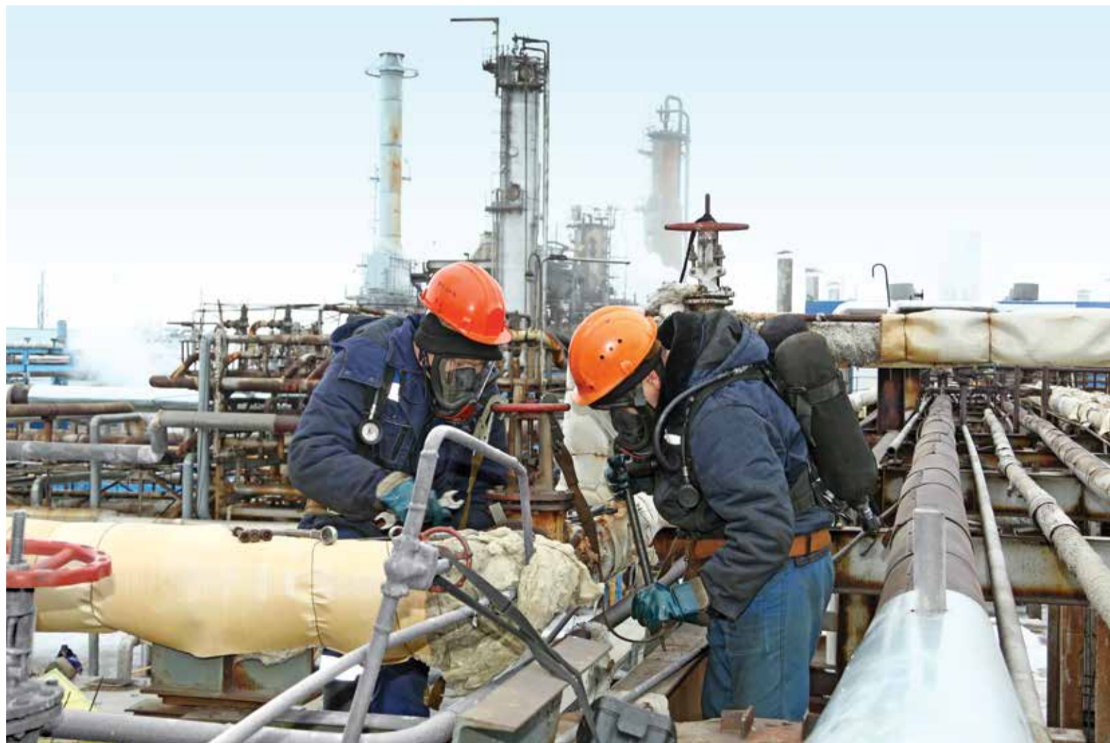
Ведется монтаж заглушек на технологических трубопроводах третьей очереди газоперерабатывающего завода