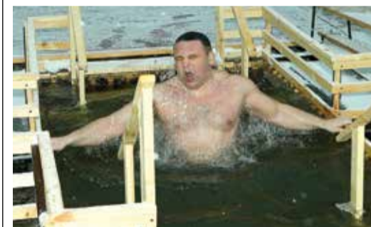
Вода, очищающая душу