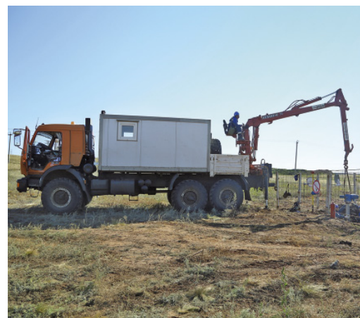
Монтаж оборудования на площадке проводится с помощью грузоподъемной техники

Людмила ЛОКТИОНОВА