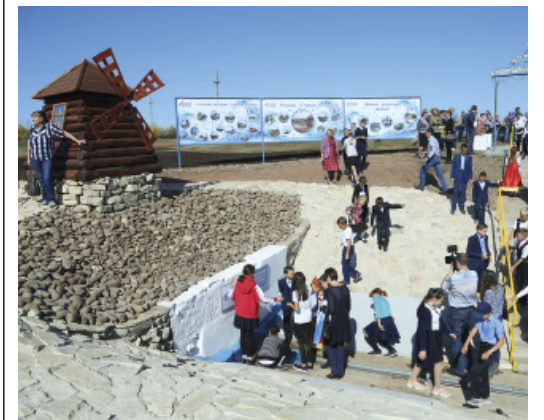
У родника «Старая мельница» планируется сделать пруд и разбить сад