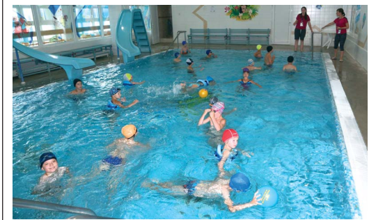
От занятий в бассейне в восторге и малыши, и дети постарше

В этом году «Олимпиец» встретил первых отдыхающих 3 июня. Сейчас в разгаре третья смена. Всего за летние каникулы здесь отдохнут около 300 ребят.