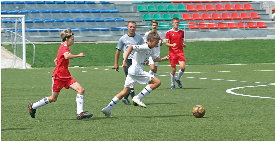
Футболисты Оренбургского района (в белой форме) вырвали победу в региональном этапе и теперь будут готовиться к финалу

Завершился региональный этап Всероссийского фестиваля детского дворового футбола 6 x 6. Два дня на стадионе «Факел» Дворца культуры и спорта «Газовик» кипели недетские страсти.