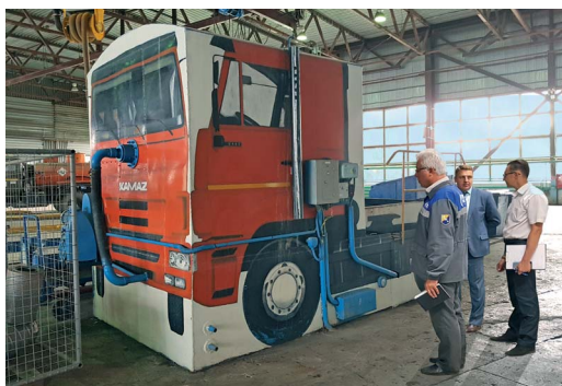
Креативный подход работников цеха № 1 преобразил мочную установку для агрегатов автомобилей в ремонтно-механических мастерских

Прогресс виден даже по символу подразделения. Если несколько лет на газоне был «припаркован» деревянный автомобиль с госномером Ц001ЕХ56, то теперь работников и гостей приветствует робо-