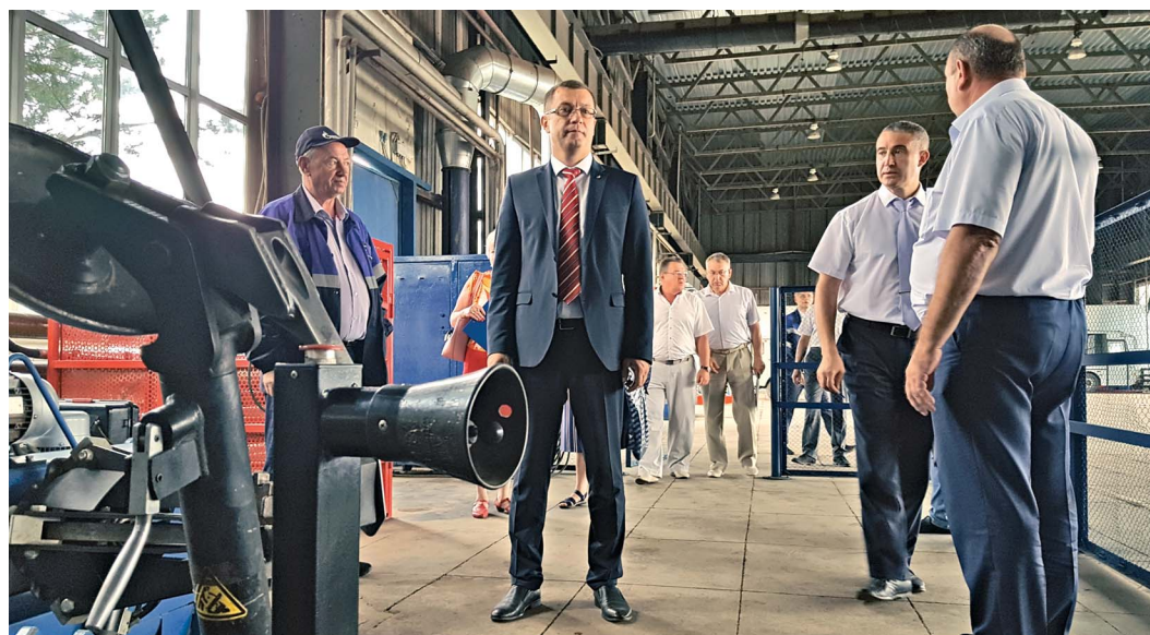
Комиссия отмечает, что шиномонтажный стенд в боксе технического обслуживания, как и другое оборудование в цехе № 3, поддерживается в хорошем состоянии

До очередного смотра-конкурса по эстетике производства осталось около месяца. В подразделениях ведется интенсивная подготовка к нему.