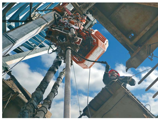
Буровые работы ведутся круглосуточно

За шлабгаумом — городок буровиков. На площадке — комплекс машин, механизмов и оборудования. Процесс бурения не прерывается даже ночью. «На работу от-