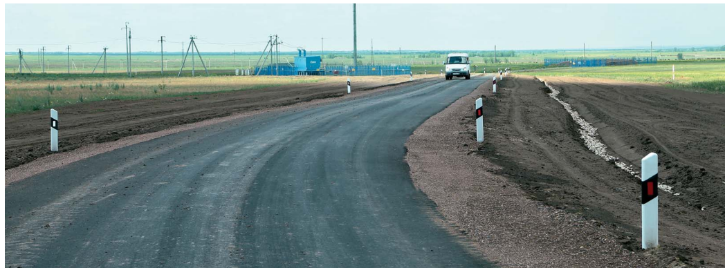
Преимущества дороги с асфальтовым покрытием очевидны не только в период распутицы

Раньше газодобытчики добирались до объектов по полевой дороге, проезд в весенне-осенний период был затруднен. Осенью 2018 года началось строительство асфальтированной дороги и завершилось в конце июня 2019 года. Проведен комплекс работ по планировке грунта, устройству земляного полотна и укладке асфальтобетонного покрытия. Длина полотна новой дороги