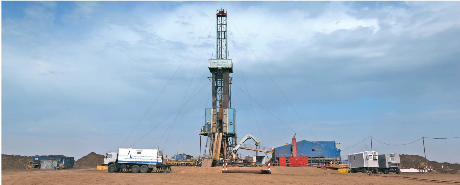
В текущем году горизонтальные отводы будут пробурены на четырех скважинах УКПГ № 3

С какой скоростью вращается долото, сколько метров осталось до проектной отметки — каждое утро в оперативно-производственную службу (ОПС) № 3 газопромышленного управления поступает сводка с буровой. В 70-80-х годах прошлого века зарезка бокового горизонтального ствола на скважине была смелым экспериментом, а в настоящее время это производственная необходимость.