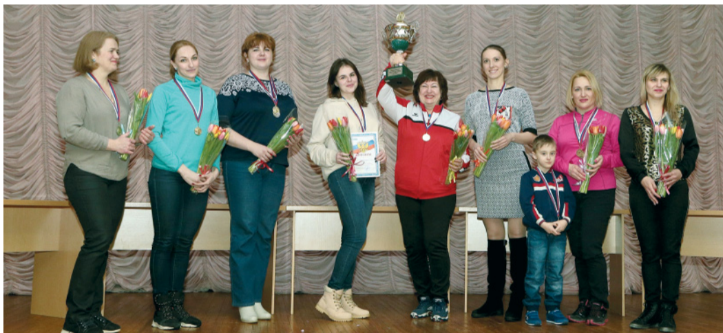
Сборная аппарата управления — лидер первого этапа женской спартакиады

Их было более сотни. И имя им — самые спортивные и позитивные. Завершился первый этап XIV женской спартакиады Общества. За победу боролись шесть команд.