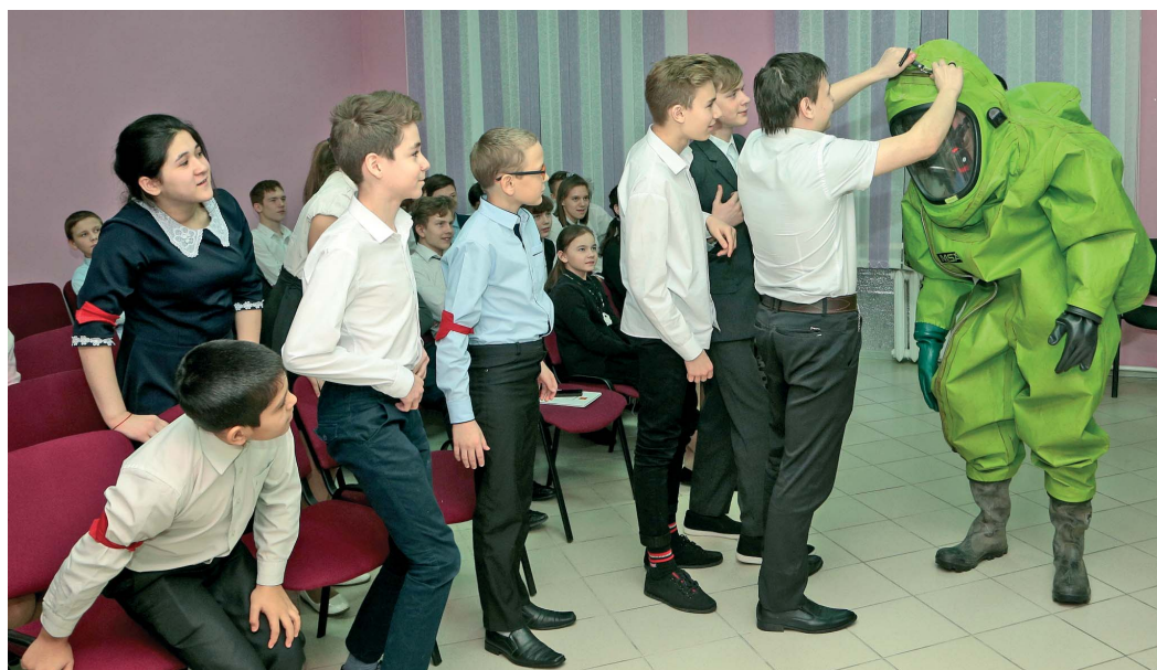
Газоспасатели продемонстрировали ребятам абсолютно герметичный костюм, в котором на протяжении 8 часов можно работать в атмосфере, содержащей агрессивные вещества

Инженер центра газовой и экологической безопасности ВЧ, председатель совета