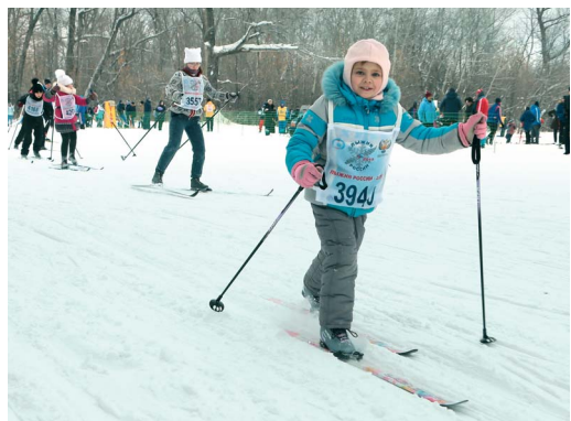
На «Лыжне России» маленькие оренбуржцы делают первые спортивные шаги

Ольга ЮРЬЕВА, Мария ГОЛУБЕВА