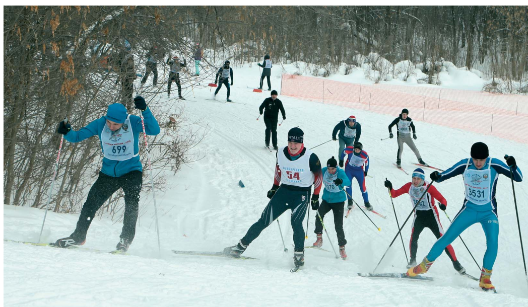
Подъемы и спуски добавили азарта гонщикам

— Тысячи спортсменов участвуют во всероссийской гонке, чтобы проверить свои возможности и сделать эту трассу незабываемой, — отметил председатель объединенной первичной профсоюзной организации