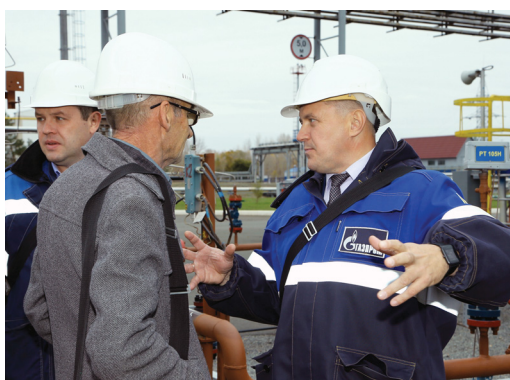
Для ветеранов такие встречи — как экскурс в молодость

Наталья АНИСИМОВА