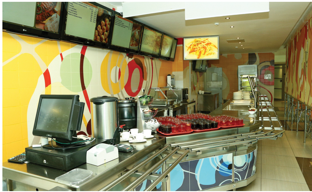
Удобно, что меню можно увидеть на мониторах

Эксперты проверили сроки и условия хранения продуктов. Хранение свежих овощей, зелени и фруктов не вызвало нареканий. Замороженное мясо и овощи лежат в одной камере, но на разных стеллажах, что допустимо при отсутствии дополнительного холодильника. Соль, сахар, крупы и специи хранятся по правилам. За исключением манки, насыпанной в кастрюлю. На вопрос: «Почему без крышки?» — был дан ответ: «У нас нехватка посуды». Аббревиатуры на рукоятках ножей в холодном