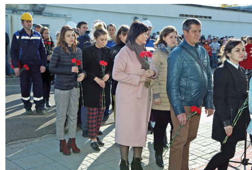
Заводчане несут к мемориальной доске цветы