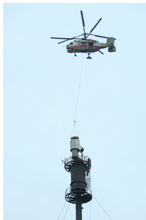
На газоперерабатывающем заводе завершили работу по оснащению факельного хозяйства оголовками бездымного горения

Людмила ЛОКТИОНОВА