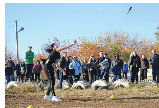
Именно броски девушек помогли распределить места четырех команд в экстриме, набравших одинаковые баллы