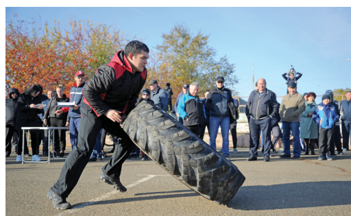
К кантованию автошин транспортники подошли профессионально