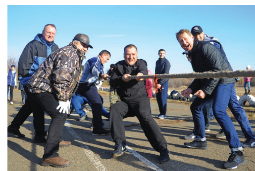
В перетягивании каната цех № 2 несколько раз едва не упустил победу

рье, которое открыли состязания по силовому экстриму (кантование автомобильных шин большого размера) для мужчин и интеллектуальная схватка для женщин, бросание гранаты представителями обоих по-