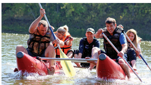
Даже осенние воды Урала не остудили пыл команд