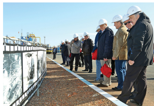
Гости рассматривают кадры фотохроники

40-летний юбилей отметила установка комплексной подготовки газа № 14 газопромыслового управления (ГПУ). В прошлую пятницу там собрались те, кто стоял у истоков промысла, — ветераны, отдавшие ему лучшие годы своей жизни.