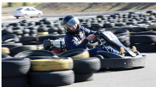
С такими виражами на работе газовики не сталкиваются, но они справились