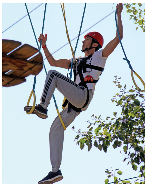
Ходить на высоте двухэтажного здания делегировали самых бесстрашных