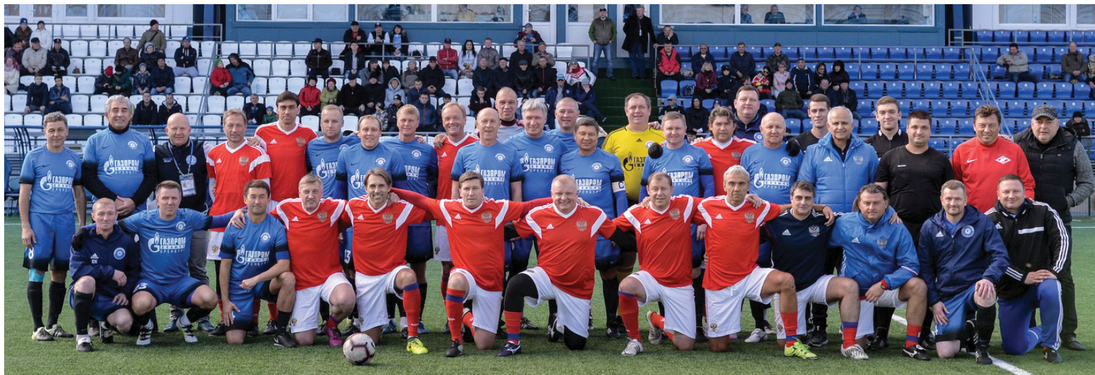
Памятное фото соперников по благотворительному матчу между командами ветеранов ФК «Оренбург» (в синей форме) и сборной России