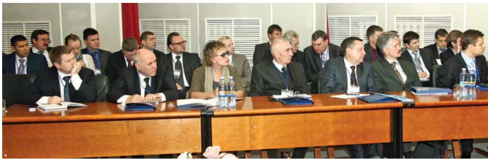
Участники конференции с интересом заслушивали каждый доклад