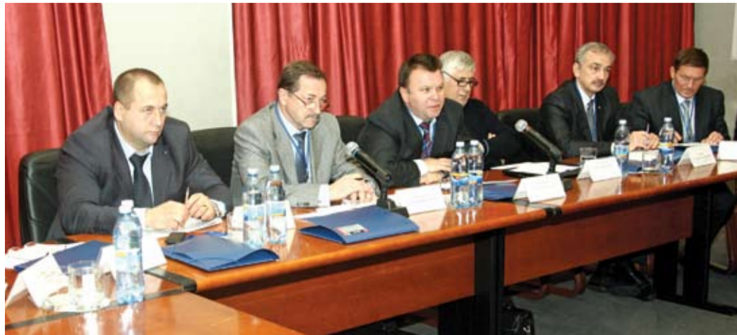
Члены оргкомитета конференции отметили актуальность и разнообразие тем докладов

Завершилась IX международная научно-техническая конференция «Диагностика оборудования и трубопроводов, подверженных воздействию сероводородсодержащих сред». В настоящее время ведется выработка итоговой резолюции.