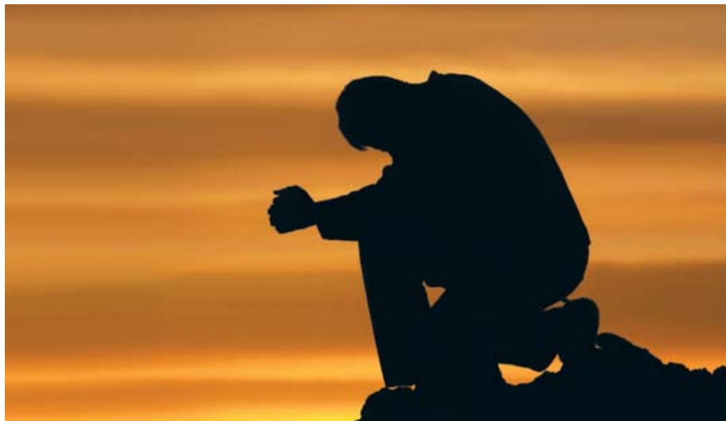
Одиночество — это когда те, кого ты любишь, счастливы без тебя