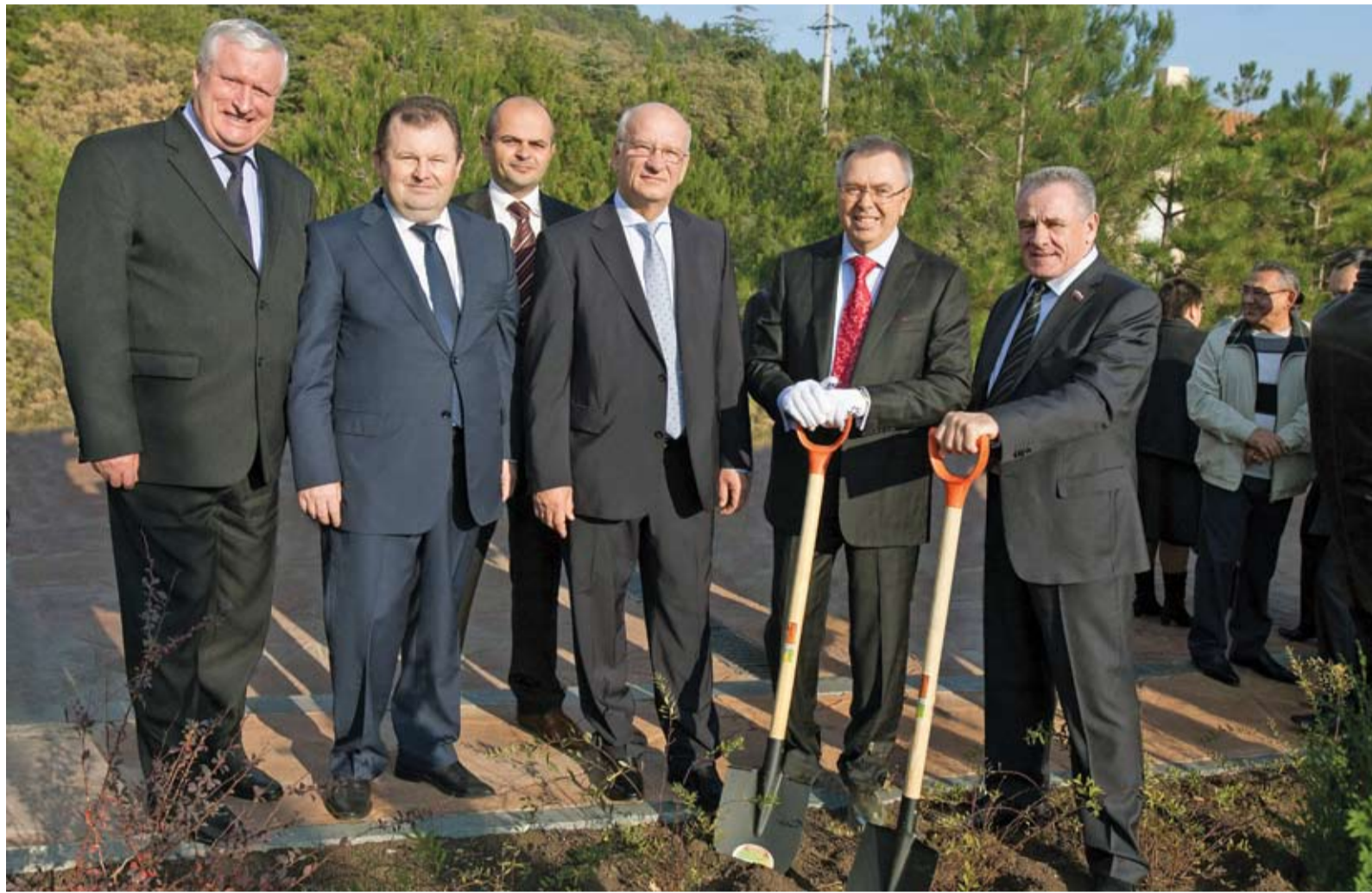
Оренбургская делегация посадила аллею на курорте «Крымский бриз»

Выездное совещание руководителей предприятий – членов некоммерческого партнерства «Газпром в Оренбуржье» состоялось в санатории «Крымский бриз» г. Ялты 16–18 ноября.