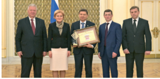
Вручение Гран-при Всероссийского конкурса «Российская организация высокой социальной эффективности». 2016 год