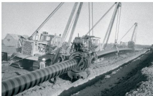
Строительство этанопровода Оренбург — Казань. 1978 год