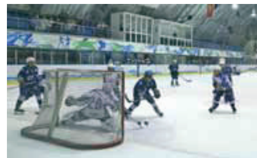
Опасный момент у ворот команды «Юрматы СКА» создали хоккеисты ДЮСШ СК «Юбилейный»

В финале боролись оренбургские «Сарматы» 2005 и 2006 года рождения. Старшие ребята завоевали золотые медали и кубок, младшим досталось серебро. Бронзовые медали выиграла команда ДЮСШ спорт-комплекса «Юбилейный», одержав победу в матче за третье место у гостей из Башкортостана — «Юрматы СКА».