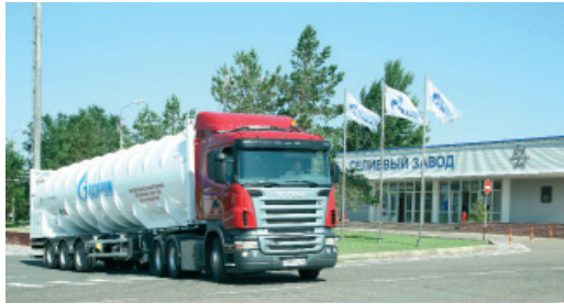
Отправка экспериментальной отечественной цистерны с жидким гелием в г. Новотроицк. 2012 год