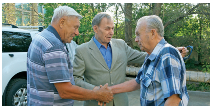
Радостная встреча, дружеское рукопожатие

За полувековую историю газового комплекса в Оренбурге построено порядка 1,7 миллиона квадратных метров жилья. До начала XXI века это составляло около трети жилого фонда областного центра.