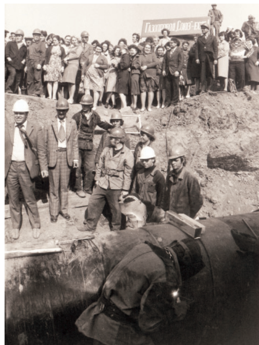
Сварка красного стыка на газопроводе «Союз». 1978 год