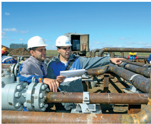
Ведутся работы на восточном участке месторождения

Один из пунктов инвестпрограммы ПАО «Газпром» — доработка основной газоконденсатной залежи на востоке Оренбургского месторождения — участке, где раньше запасы газа считались трудноизвлекаемыми из-за особенностей геологического строения недр. Поэтому прежде скважины там не бурили. Теперь же за несколько лет пробурено 18 скважин (всего их будет 43. — Ред.), проложены газопроводы, построены сборно-распределительные гребенки и другие производственные объекты. И работы