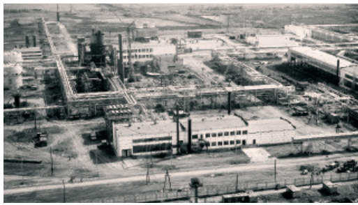
Панорама строительства гелиевого завода. 1976 год