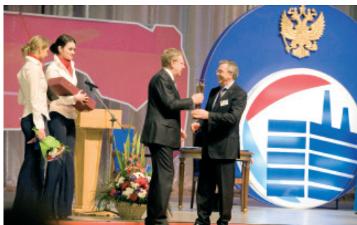
Вручение Гран-при Всероссийского конкурса «Российская организация высокой социальной эффективности». 2008 год