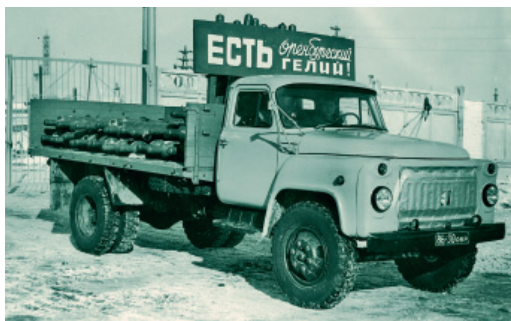
Первые баллоны оренбургского гелия. 1978 год