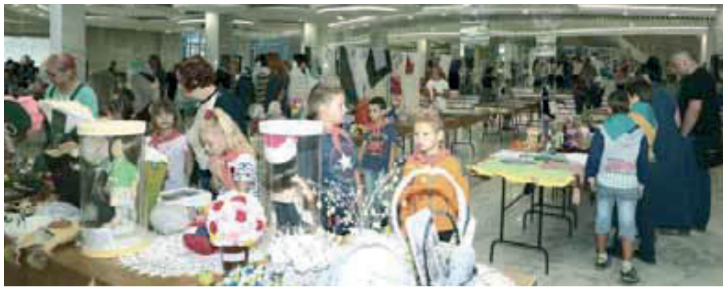
Интерес к конкурсу растет. Это отличное подтверждение того, что газовик — профессия творческая

С 18 по 24 августа во Дворце культуры и спорта «Газовик» проходил XIII конкурс технического творчества, изобразительного и декоративно-прикладного искусства «Мир увлечений».