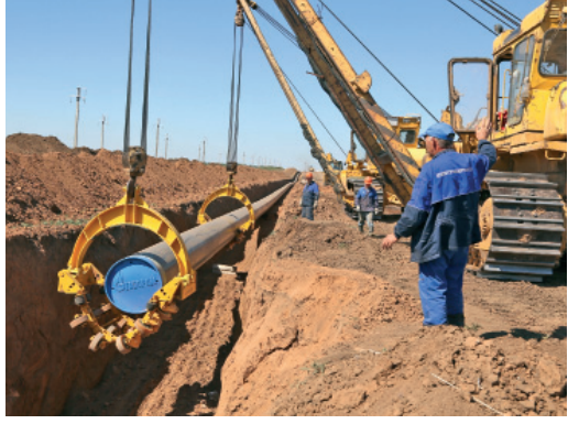
Строительство перемычки ДКС-1 — ДКС-2. 2015 год

ным ремонтам, постоянной работе по обновлению производства удается сохранять эффективность газоперерабатывающего и гелиевого заводов, углублять переработку углеводородного сырья, расширять ассортимент товарных продуктов.