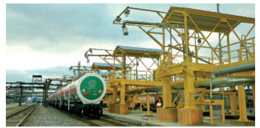
Новая эстакада налива жидкой серы на газоперерабатывающем заводе. 2017 год