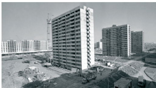
Новые высотки, построенные газовиками на улице Чкалова. 1983 год