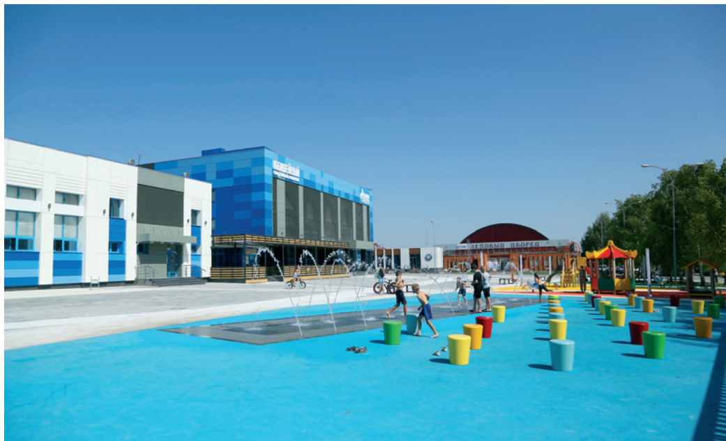
После ремонта спортивное ядро поселка Ростоши выглядит современно и динамично

В селе им. 9 Января завершается строительство Сквера газиков с памятной стелой первооткрывателям в центре композиции. На финишную прямую вышла реконструкция футбольного поля в гимназии № 4.