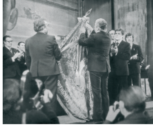
Вручение ордена Ленина ВПО «Оренбурггазпром». 1981 год