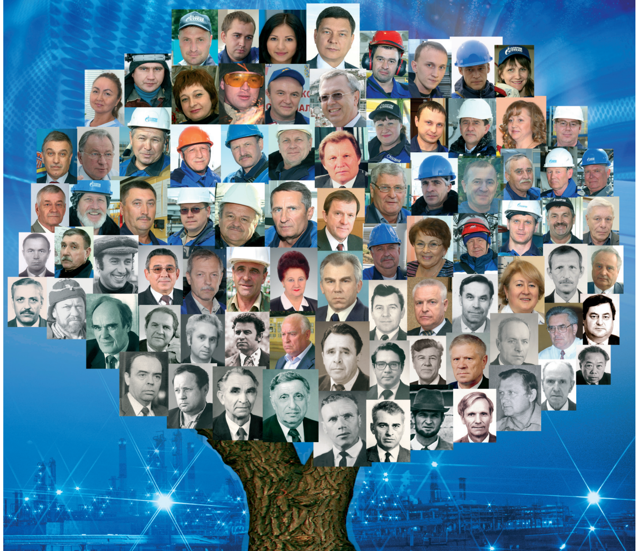
Коллаж Евгения МЕДВЕДЕВА