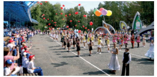
Открытие фестиваля «Тепло детских сердец». 2015 год