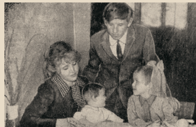
Семья Пантелеевых в новой квартире.