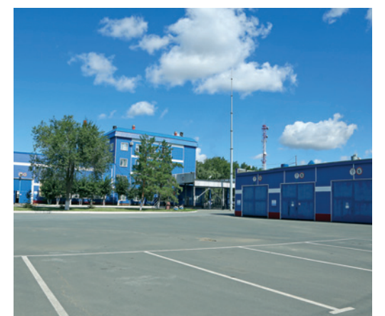
Цех № 2 управления технологического транспорта и специальной техники