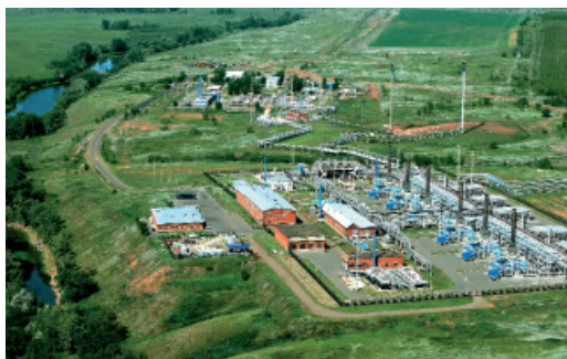
Панорама ДКС-3 и УКПГ-14. 2015 год