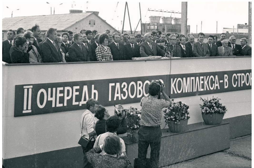
Выступает министр газовой промышленности СССР С. А. Оруджев на пуске II очереди ГПЗ. 1975 год