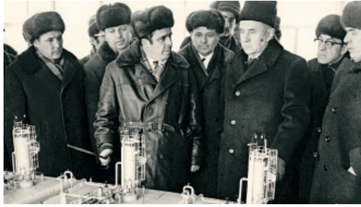
Председатель Совмина СССР А. Н. Косыгин и начальник промышленного объединения «Оренбурггазпром» В. А. Швеи у макета производственного объекта. 1973 год