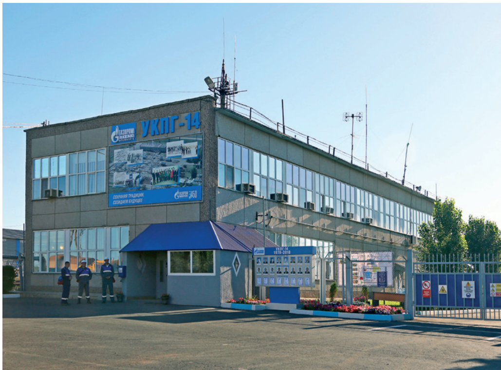
Установка комплексной подготовки газа № 14 газопромыслового управления

Коллектив УКПГ № 14 в 2001 году получил почетное право добыть триллионный кубометр оренбургского газа, о чем сви-