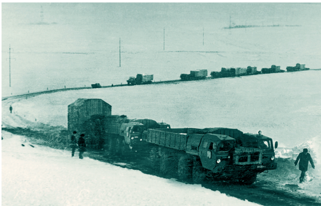
Доставка оборудования к месту строительства газового комплекса. 1970 год

Записала Ольга ПУТЕНИХИНА