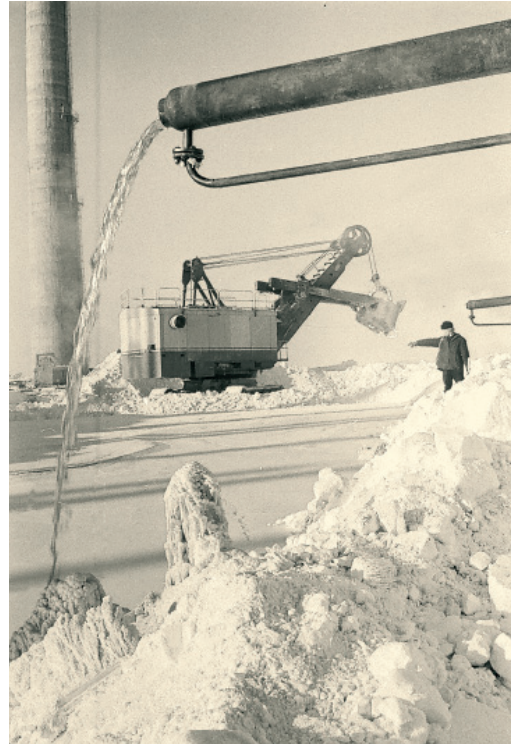
Пошла газовая сера! 1974 год