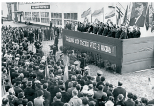
Торжественный пуск в эксплуатацию ГП-2. 1971 год