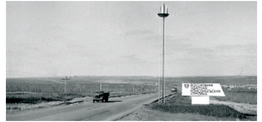
Дорога к строительной площадке ГПЗ. 1973 год