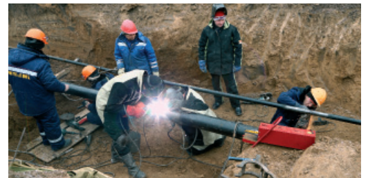
Золотой стык на газопроводе УКПГ-10 — СРГ-6. 2017 год