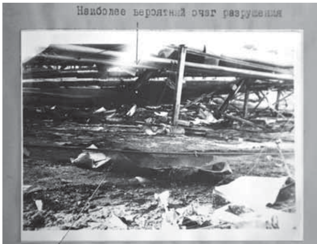
Фото из материалов расследования аварии на газоперерабатывающем заводе. 1987 год