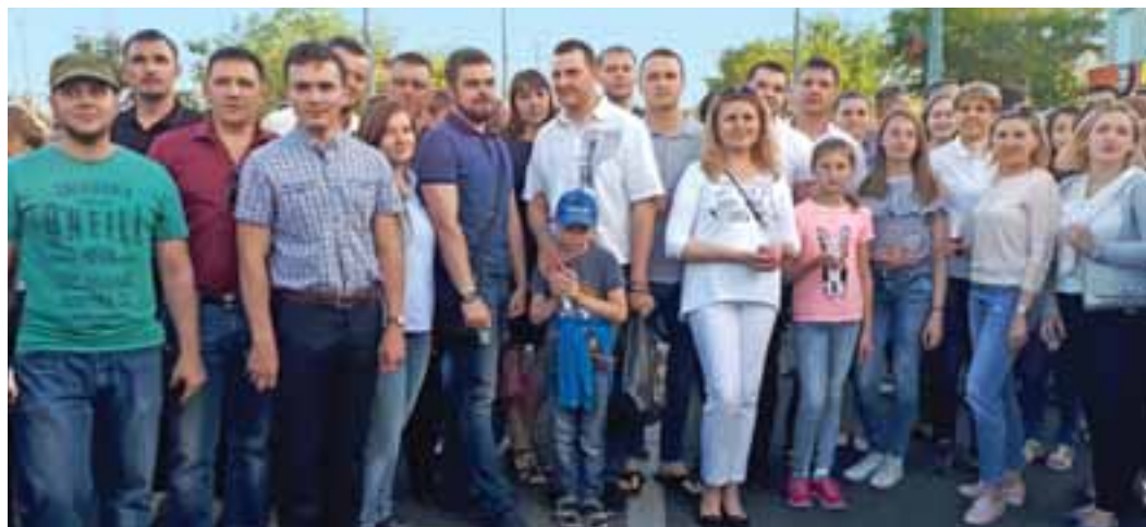
В акции приняли участие десятки представителей ООО «Газпром добыча Оренбург»

Накануне Дня памяти и скорби тысячи оренбуржцев стали частью всероссийской акции. В очередной раз «Свеча памяти» объединила и работников ООО «Газпром добыча Оренбург».