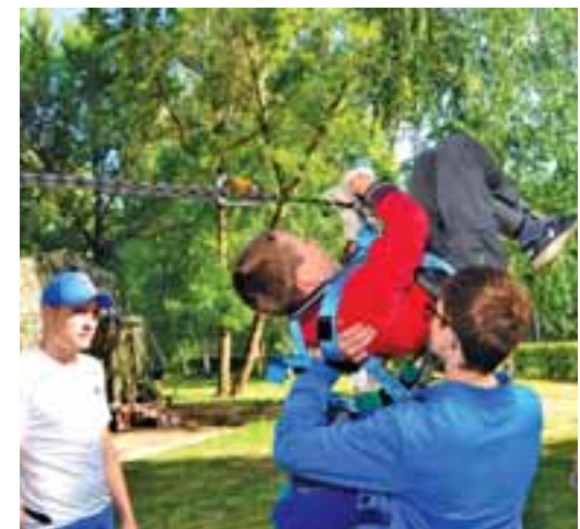
Туристические навыки, полученные в лагере, помогут в походах