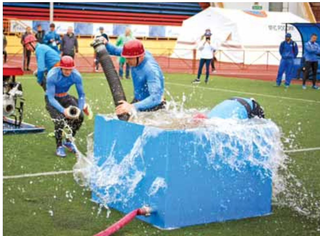
Команда ООО «Газпром добыча Оренбург» выполняет боевое развертывание от мотопомпы

Мария ГОЛУБЕВА