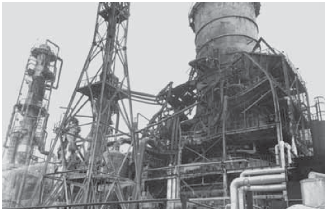
Гелиевый завод после аварии. 1987 год