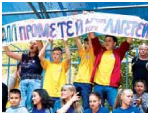
Подхватившие огонь «Прометей»

Сегодня, когда спортивная общественность следит за чемпионатом мира по футболу, который проходит в России, в палаточном лагере «Прометей» ставят свои рекорды и зажигают свои звезды.