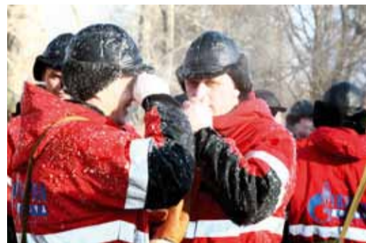
Мороз работе не помеха