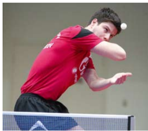
Дмитрий Овчаров приносит первое очко «Факелу»