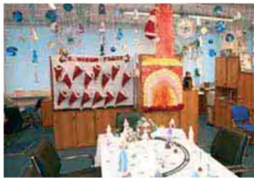
К нам приходит праздник

Жюри было презентовано множество разнообразных идей: Новый год на промысле, зимняя сказка, гнездо дракона, новогодний лес, зимние деревенские забавы, январская выюга, хоровод елок, христианские праздники (Рождество и Крещение), восточные мотивы и история праздника в открытках, зима в избушке и многие другие. Завершение года Кролика и наступление года