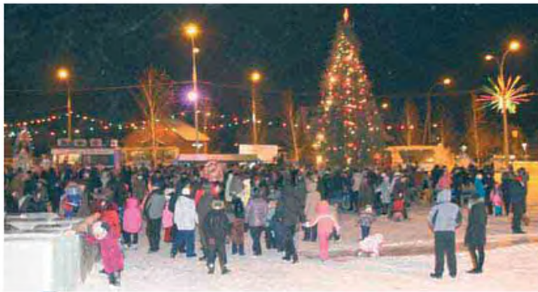
Народное гулянье в поселке Газодобытчиков

Владимир СЕРГЕЕВ