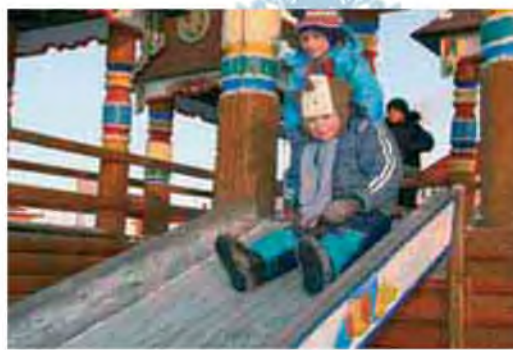
Вот оно детское счастье!

Тем временем на сцене развернулось сказочное представление с участием восточных мудрецов. Они никак не могли усмирить трехглавого зеленого дракона, пока не появились главные новогодние персонажи — Дед Мороз и Снегурочка. Одним взмахом посоха добрый волшеб-