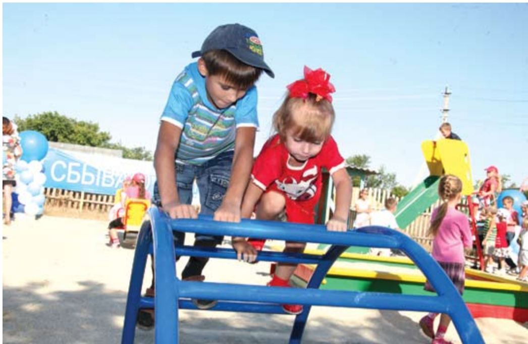
Маленькие жители Кубанки остались довольны

ООО «Газпром добыча Оренбург» активно участвует в реализации социально значимых проектов на территории Перволюцкого района, предоставляя детям возможность воплотить в жизнь свои творческие и спортивные устремления. 19 августа свершилось еще одно долгожданное событие — открытие на территории детского сада села Кубанка новой игровой площадки, уже четвертой в районе, построенной по программе «Газпром — детям».