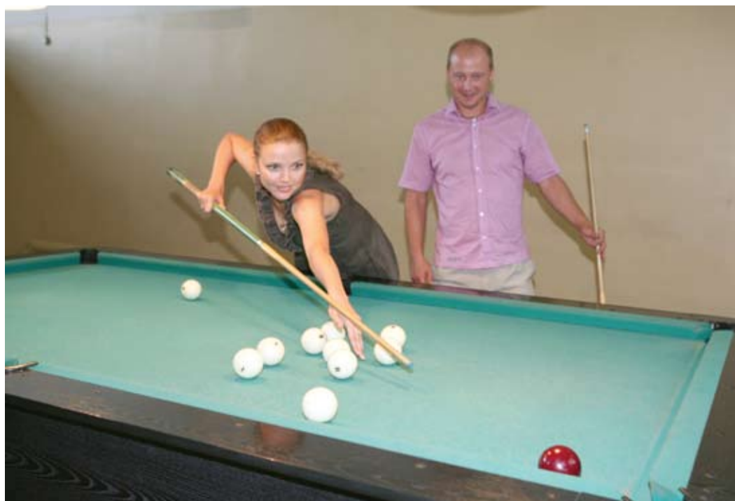
Бильярд — полезное развлечение