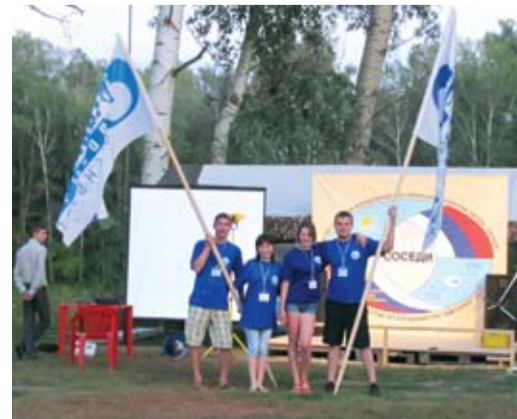
Молодые работники Общества в лагере «Соседи»

В рамках лагеря прошли семинары, тренинги, круглые столы, где обсуждались проблемы современной молодежи, мастер-классы и спартакиада.