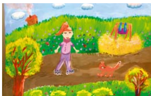
«На прогулке». Аня БАТЛАЖАН, 8 лет