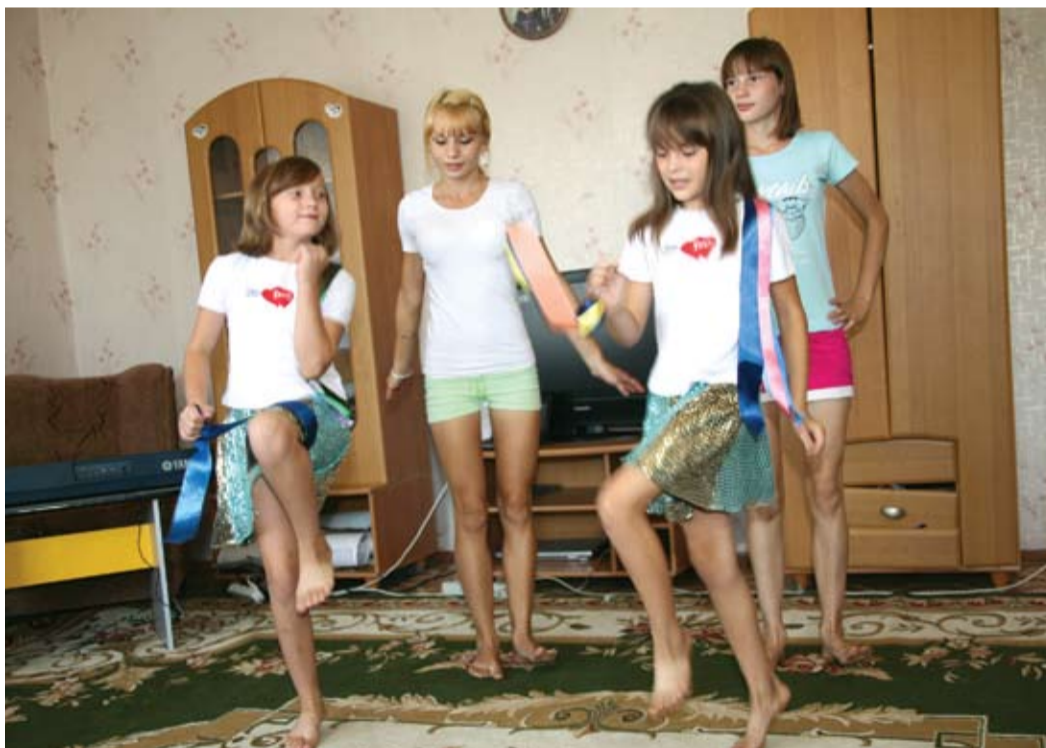
Тихо: идет репетиция