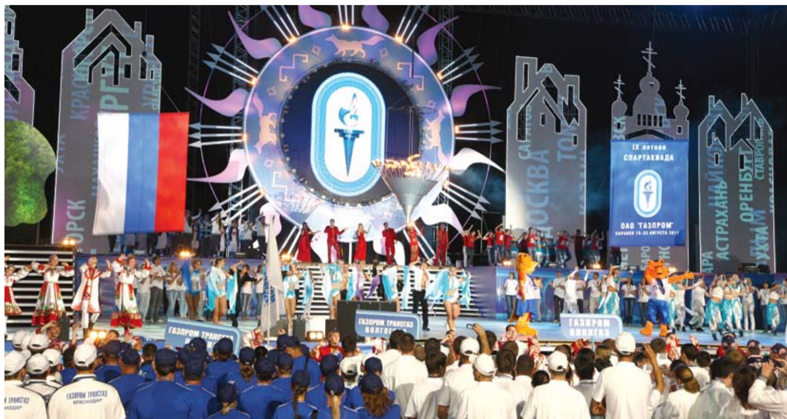
Церемония открытия спартакиады

Спортсмены ООО «Газпром добыча Оренбург» вернулись из Саранска, где проходила IX летняя спартакиада ОАО «Газпром». Во второй раз подряд сборная оренбургских газовиков занимает тринадцатую строку турнирной таблицы самых масштабных спортивных состязаний российского газового холдинга.