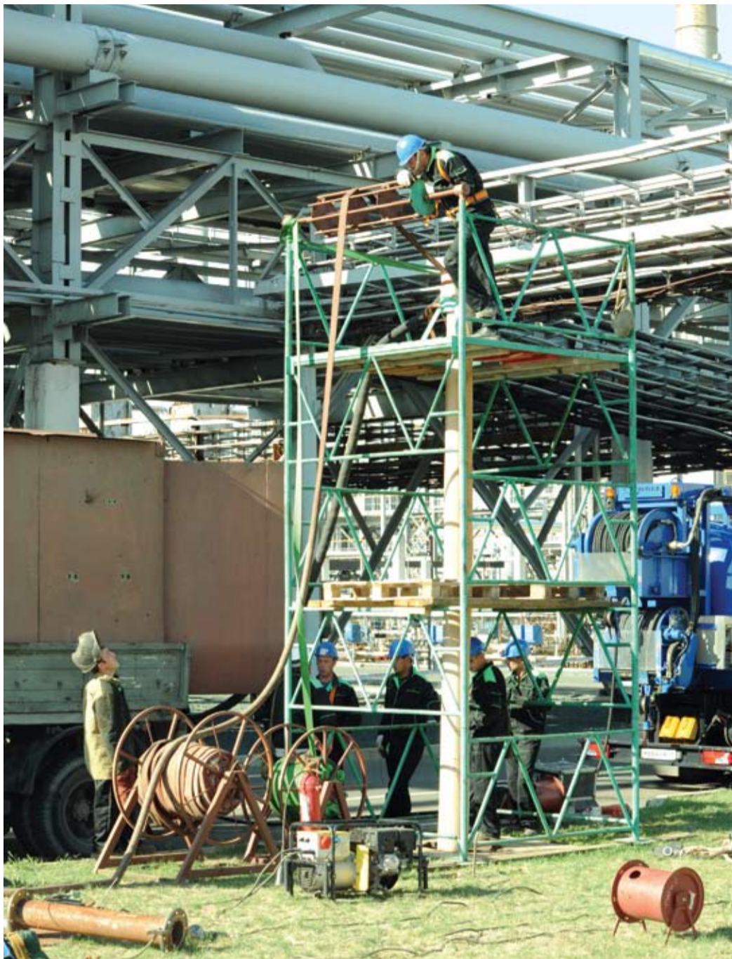
Метод санации — технология сложная

И экономится не только время, но и вполне реальные деньги. Повторный ремонт этого же трубопровода понадобится не скоро. Недавно робота запустили в трубы, которые были отремонтированы методом санации три года назад. Их состояние идеально. Значит, все расходы, связанные с выполнением ремонта и последующим благоустройством территории, можно направить на другие нужды.