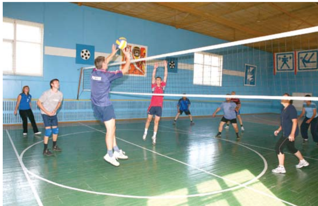
Товарищеский матч в разгаре

Сотрудники восприняли спортивное нововведение на ура. Мужчины потянулись сразу же. А когда в ООО «Газпром добыча Оренбург» стали проводить женские спартакиады, зал заполнился прекрасной половиной работников управле-