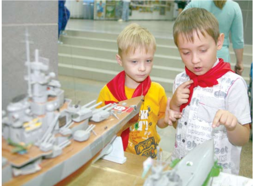
Точно такая русская подложка немецкую потопила

В этом году в конкурсе принимают участие почти 250 конкурсантов из 36 организаций, которые представили около 900 работ. Итоги будут подведены 27 августа. Тогда определятся обладатели 25 дипломов «Золотые руки», 10 специальных призов и двух Гран-при. Подробнее об этом — в следующем номере.