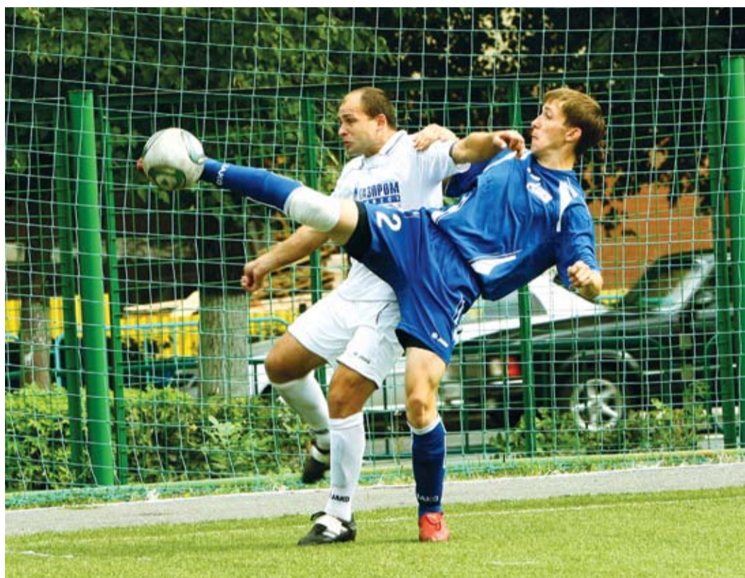
В футболе главное — ловкость ног

Соревнования по легкой атлетике включали личные и командные забеги. Наряду с любителями в этом виде спорта выступали профессионалы мирового и международного класса, потому борьба за медали получилась захватывающей по красоте.