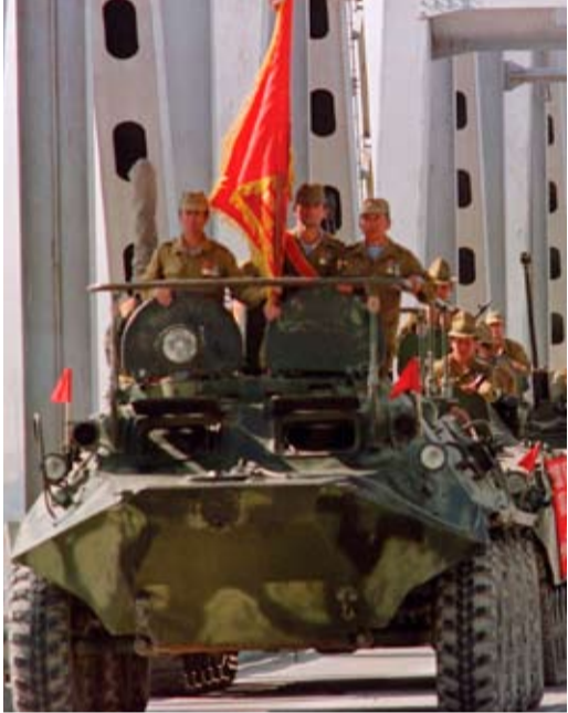
Исторический снимок 15 февраля 1989 года: последняя колонна советских войск выходит с территории Афганистана

В настоящее время на учете в ООО «Газпром добыча Оренбург» состоит 167 участников боевых действий. Все они — работники и пенсионеры Общества. Из них 70 человек — воины-афганцы, 59 — участники вооруженного конфликта в Чечне. Также есть ветераны боевых действий в Дагестане (1999 год), Корее (1953 год), Абхазии (1993 год), Венгрии (1954—1957 годы), Южной Осетии (1992 год), Чехословакии (1967—1970 годы), Сирии (2003—2005 годы), на острове Даманском (1968 год) и в других регионах. Коллективным договором ООО «Газпром добыча Оренбург» предусмотрены льготы для данной категории работников. В частности, они ежегодно получают дополнительную материальную помощь в размере двух минимальных тарифных ставок.