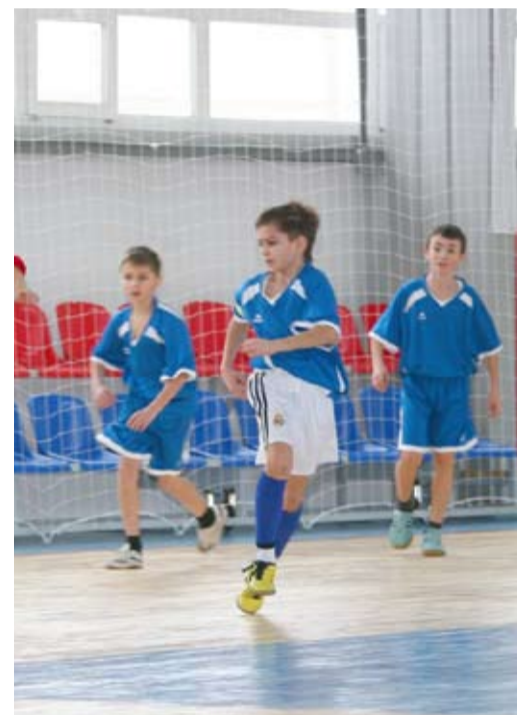
Футбол начинается с детства

Татьяна РУДНИЦКАЯ