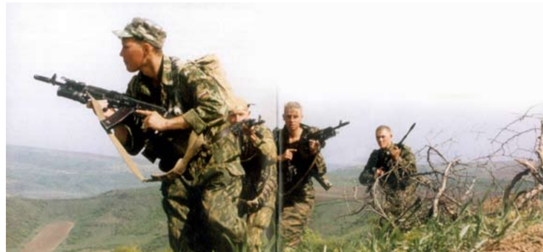
Момент чеченской войны