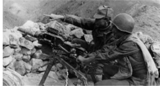
Момент афганской войны

Сколько их было за последние 65 лет? Не шесть! Сирия. Корея. Афганистан. Чечня. Абхазия. Приднестровье. Египет. Остров Даманский. Это далеко не полный перечень локальных сражений, в которых принимали участие российские солдаты. Только работники и пенсионеры ООО «Газпром добыча Оренбург» приняли уча-