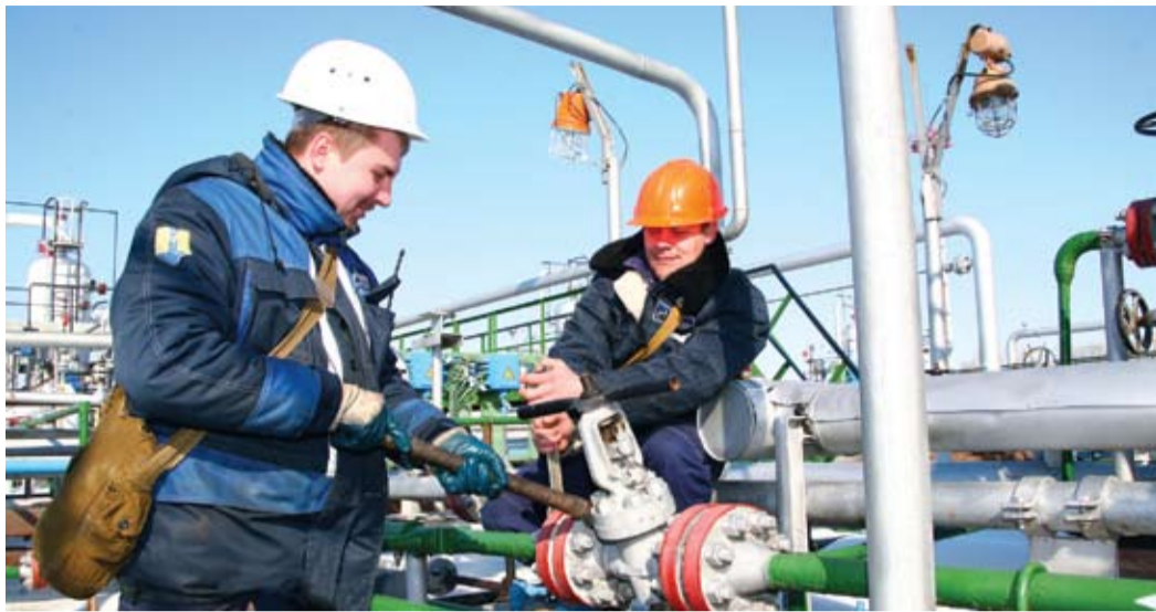
Весенние хлопоты на УКПГ-12

— На сегодняшний день практически все работы завершены. Готовность к па-