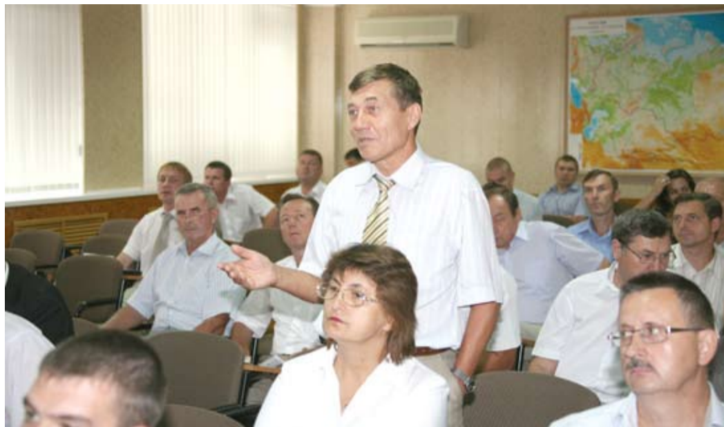
Участники совещания обсуждали насущные проблемы

Газовая, противоданная и пожарная безопасность на объектах Общества обеспечивается персоналом структурных подразделений, военизированной частью ООО «Газпром добыча Оренбург», Оренбургской ВЧ ООО «Газпром газобезопасность» и ООО «Оренбурггазпожсервис» в соответствии с