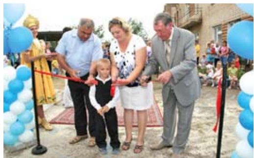
Лента перерезана — детский городок открыт!

Во время небольшого перерыва перед вторым кругом проходит дозаявочная кампания, в ходе которой команды стараются усилить составы. В настоящее время продолжается подготовка «Газовика» ко второму кругу Первенства России среди клубов ФНЛ.