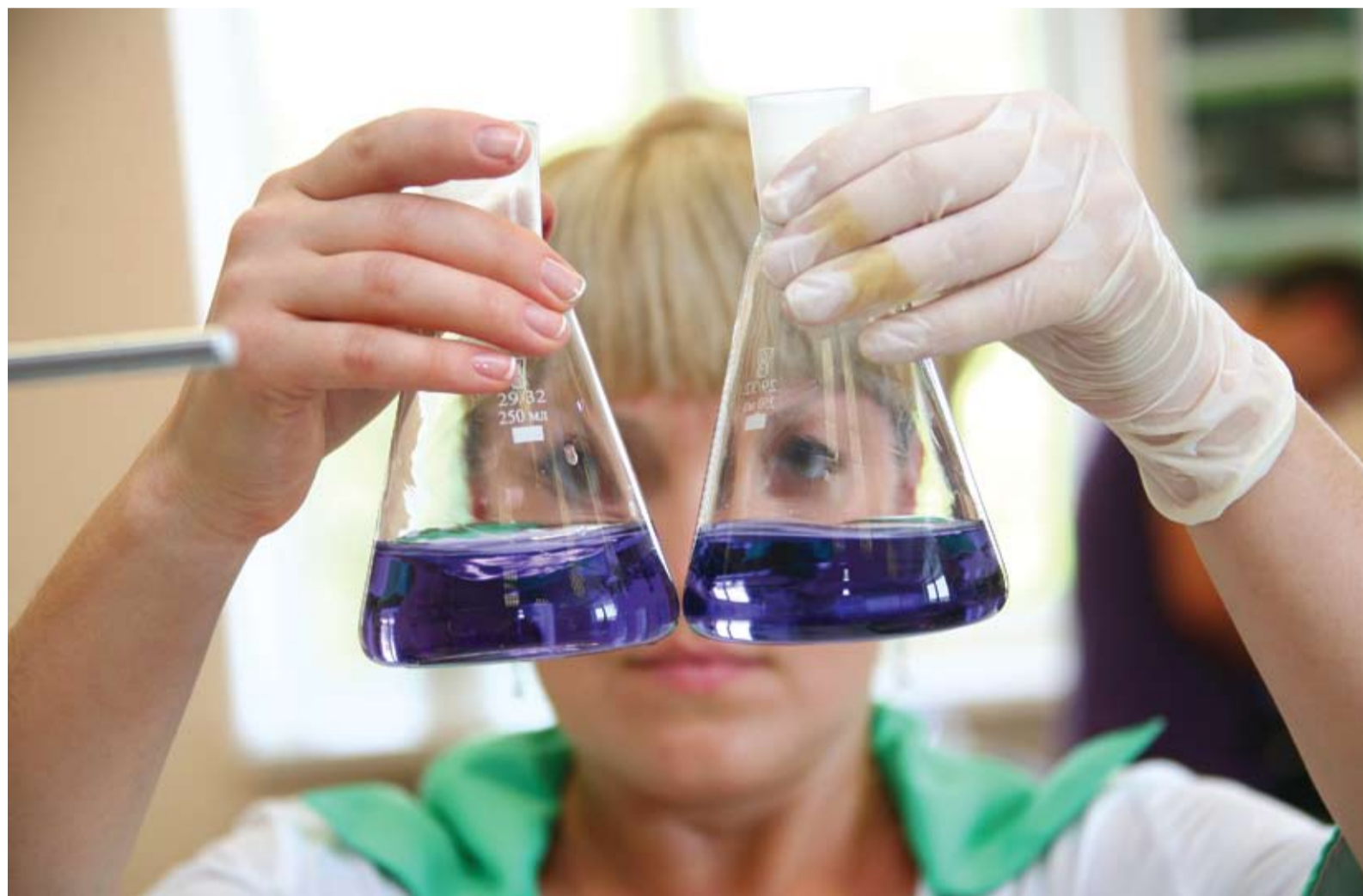
Выполняется анализ общей жесткости раствора стандартного образца