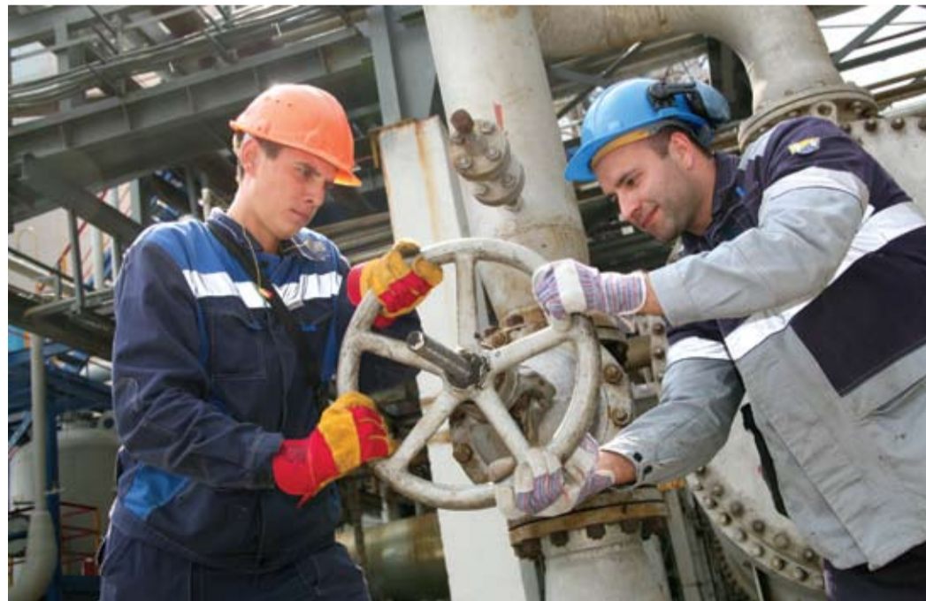
Работа спорится несмотря на жару

Газоперерабатывающий завод создавался в 70-е годы прошлого столетия с расчетом на среднесуточную температуру окру-