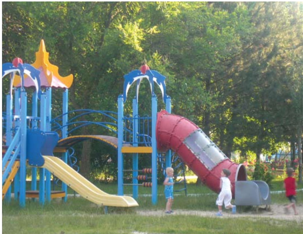
Детский уголок в «Дюне»

Практически все газовики стремятся в «Дюну» — не только купаться вдоволь в Черном море, но и подлечиться. Прямо на «дюновском» пляже мы поговорили с начальником установки У-170 газоперераба-