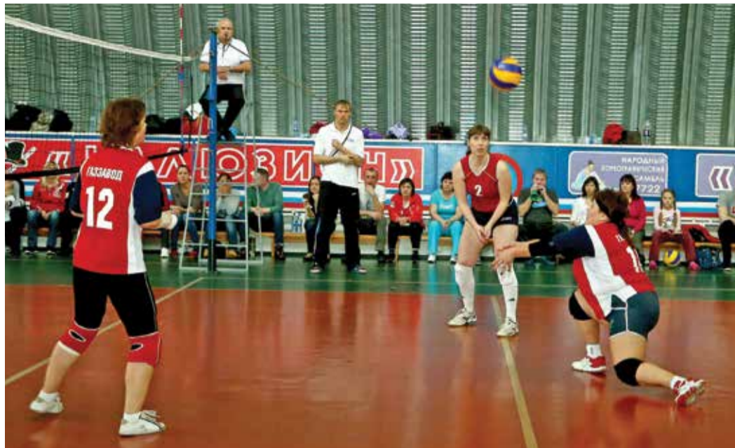
До последнего мяча

Перед соревнованиями по волейболу сборную газоперерабатывающего завода