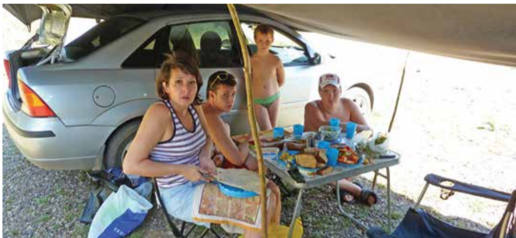
Пикник на берегу