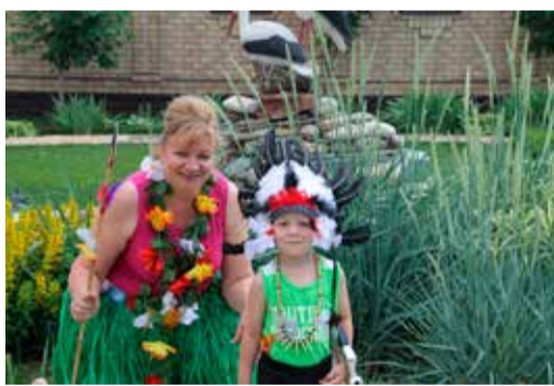
«С внуком мы индейцы»